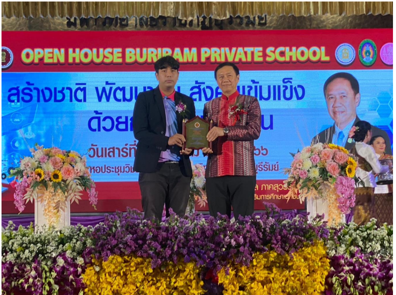
รับรางวัลครูดีเด่น OPEN HOUSE BURIRAM PRIVARE SCHOOL ณ หอประชุมอัครศาสตร์ มหาวิทยาลัยราชภัฏบุรีรัมย์