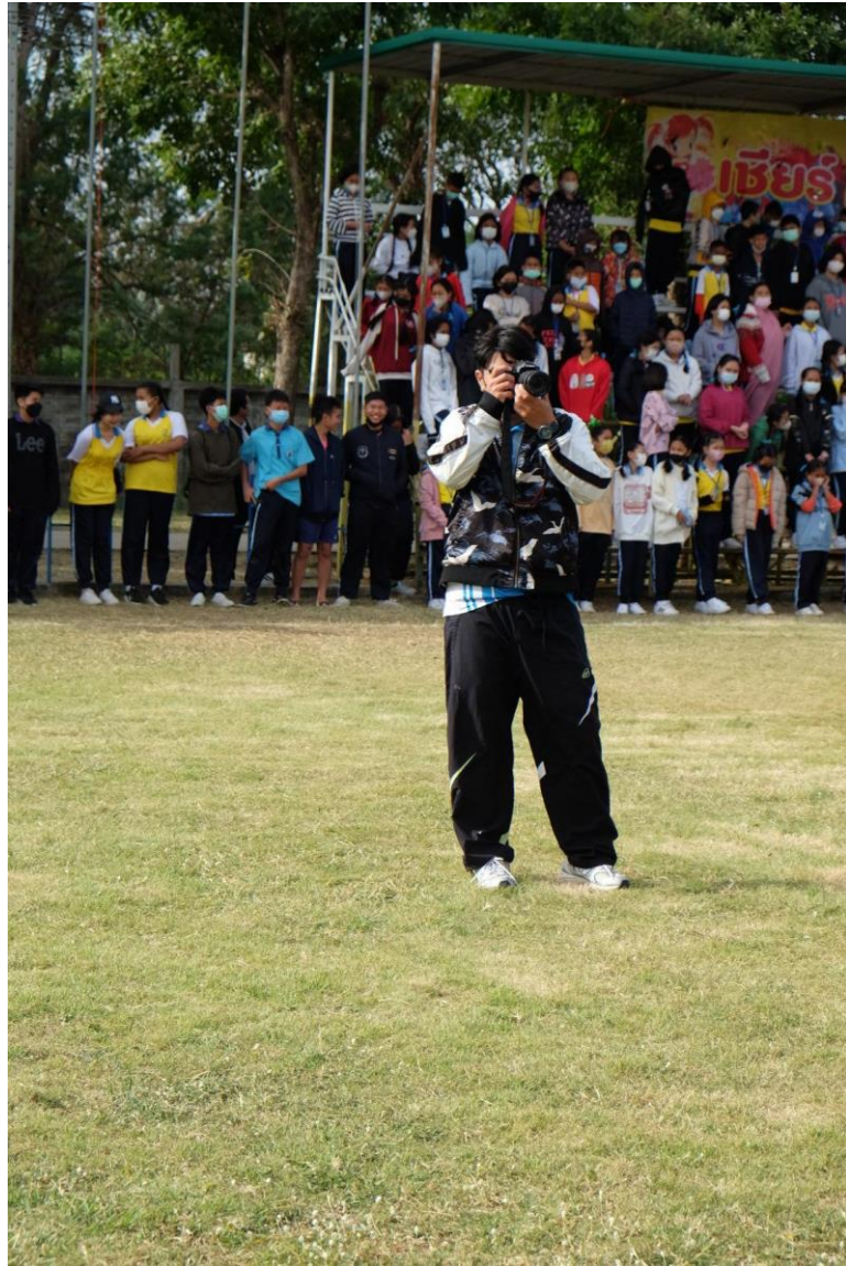
รับหน้าที่เก็บภาพกิจกรรมวันกีฬาของโรงเรียน ณ โรงเรียนมารีย์อนุสรณ์