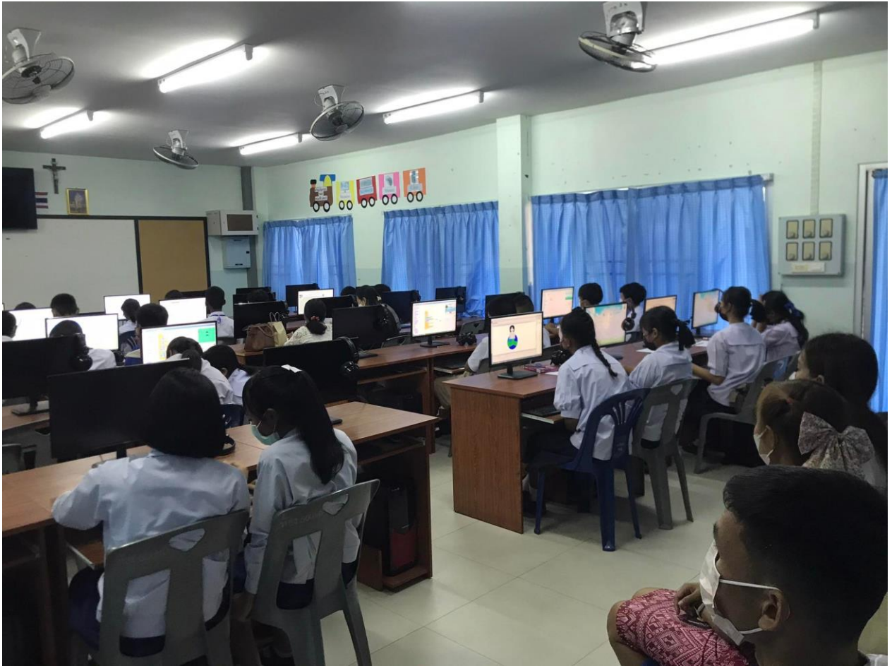
กรรมการการแข่งขันทักษะวิชาการโรงเรียนเอกชน ณ โรงเรียนมารีย์อนุสรณ์