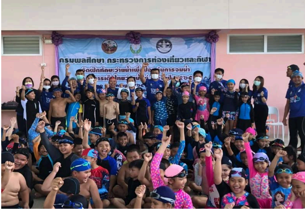
เป็นวิทยากร โครงการ เด็กไทยว่ายน้ำได้