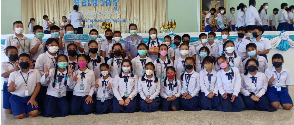
กิจกรรมไหว้ครูประจำปีการศึกษา 2565