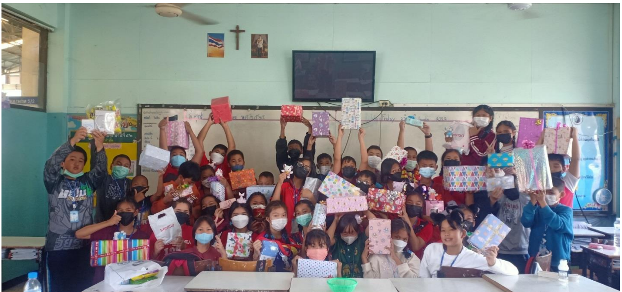
ร่วมกิจกรรมคริสต์มาส