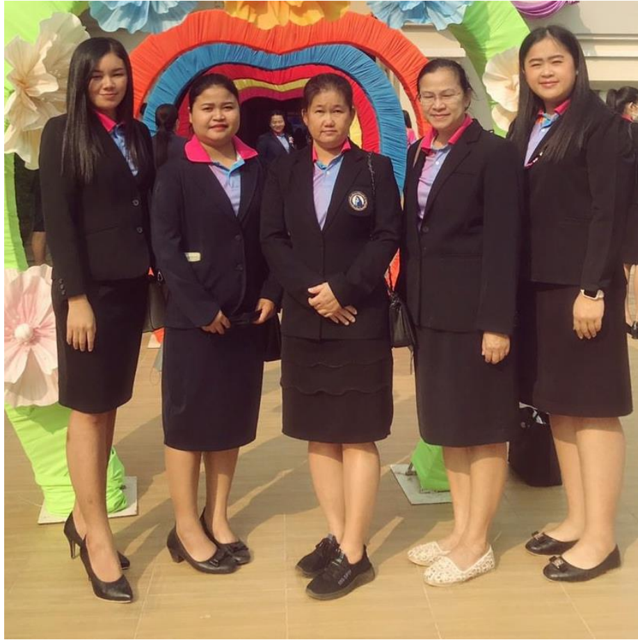
ร่วมกิจกรรมวันการศึกษาเอกชน