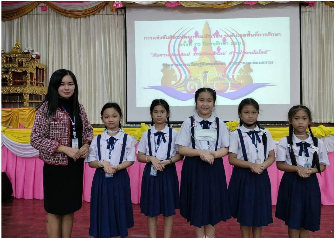
ครูผู้ฝึกสอนนักเรียนกิจกรรมการประกวดเพลงคุณธรรม ระดับชั้น ป.1-ป.3