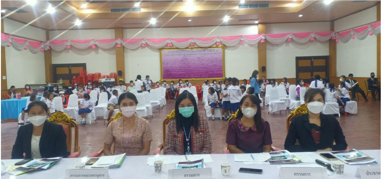
เป็นกรรมการตัดสิน การแข่งขันเพลงคุณธรรม ระดับชั้น ป.1-ป.3