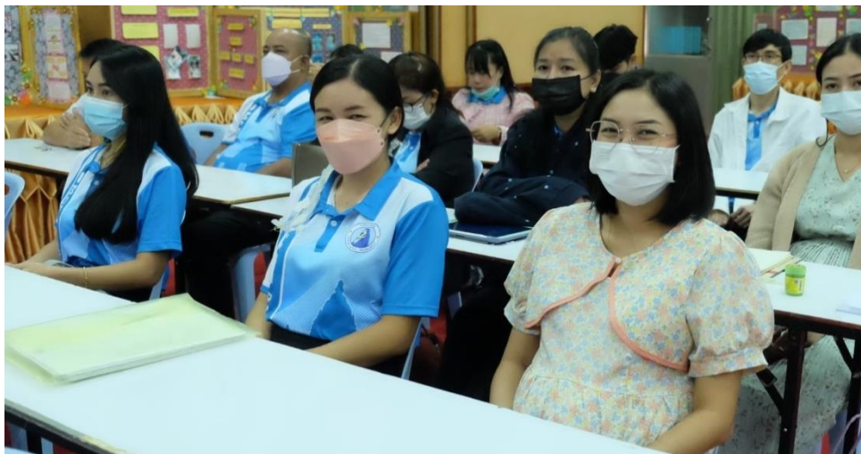
อบรมเชิงปฏิบัติการ “การพัฒนาสมรรถนะผู้เรียน ด้วยหลักสูตรแกนกลางฯ พ.ศ.2551 (ฉบับปรับปรุง พ.ศ.2560) สู่หลักสูตรฐานสมรรถนะ