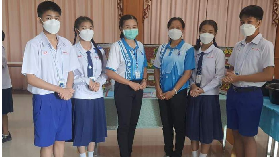
ครูผู้ฝึกสอนนักเรียนกิจกรรมการประกวดโครงงานคุณธรรมระดับชั้น ม.1-ม.3