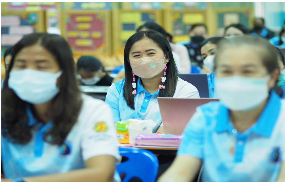
อบรมเชิงปฏิบัติการโรงเรียนคุณธรรม เรื่อง การพัฒนาครูโครงการคุณธรรม