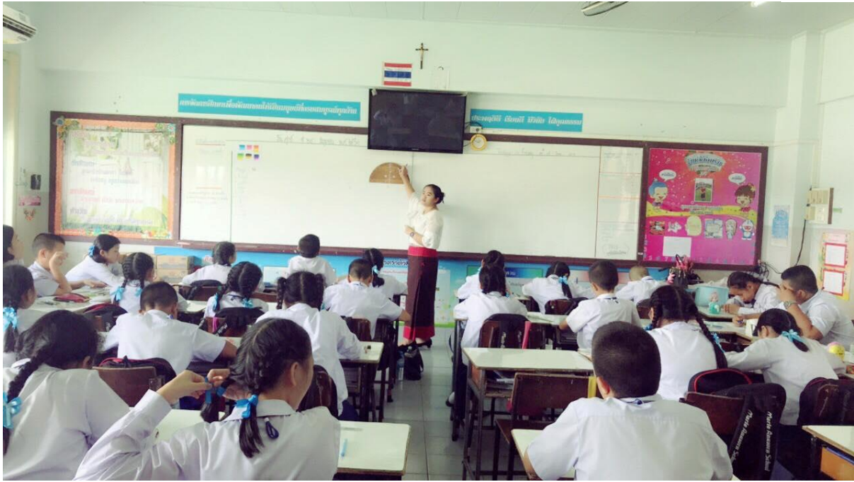
กิจกรรมการสอนเรื่องการสร้างเส้นขนาน