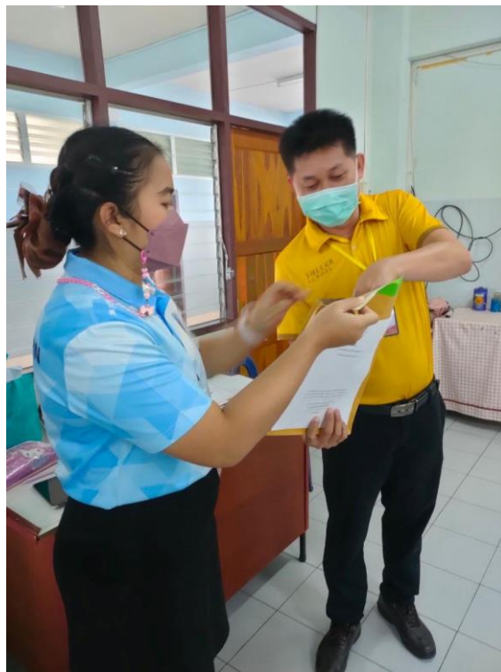
เป็นประธานกรรมการการแข่งขันอัจฉริยภาพทางคณิตศาสตร์ ระดับชั้น ป.4 - ป. 6