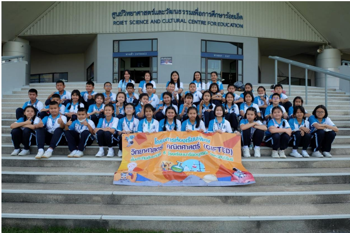
ร่วมกิจกรรมทัศนศึกษานักเรียน ป.5/8 ณ ศูนย์วิทยาศาสตร์ อ.วังขุบุรี จ.ร้อยเอ็ด