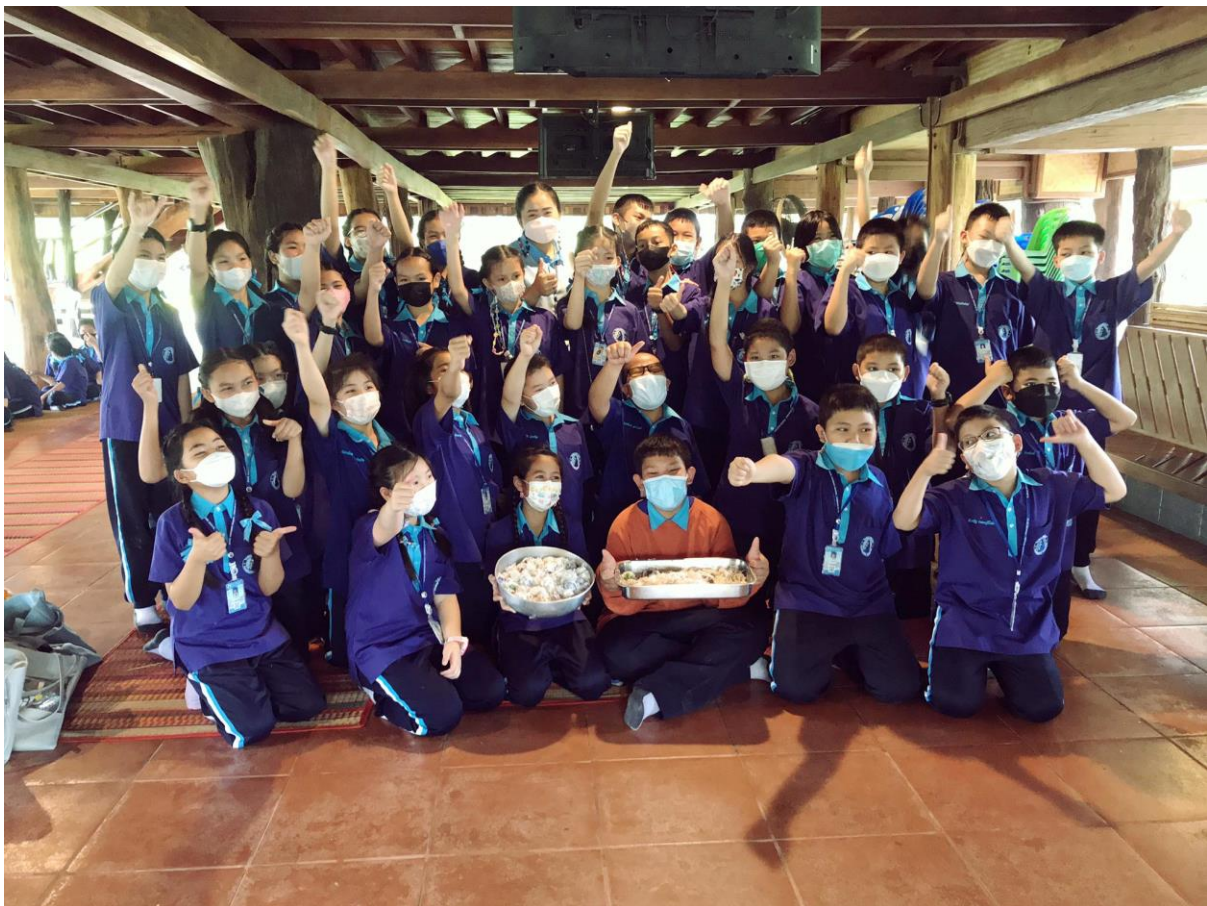
ร่วมกิจกรรมทัศนศึกษานักเรียน ป.5/8 ณ สวนพฤกษากาเดิน อ.ลำปลายมาศ