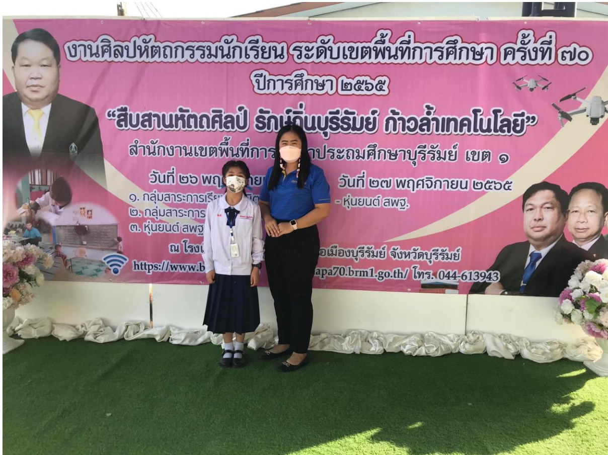
ครูผู้ฝึกสอนนักเรียนกิจกรรมการแข่งขันเวทคณิต ระดับชั้น ป.4 - ป.6