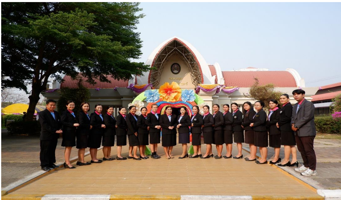
ร่วมกิจกรรมวันการศึกษาเอกชน