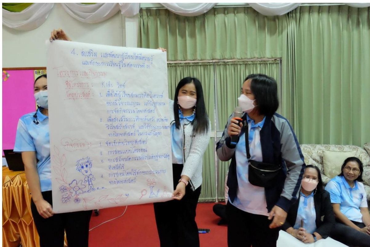
อบรมเชิงปฏิบัติการ “การพัฒนาสมรรถนะผู้เรียน ด้วยหลักสูตรแกนกลางฯ พ.ศ.2551 (ฉบับปรับปรุง พ.ศ.2560) สู่หลักสูตรฐานสมรรถนะ