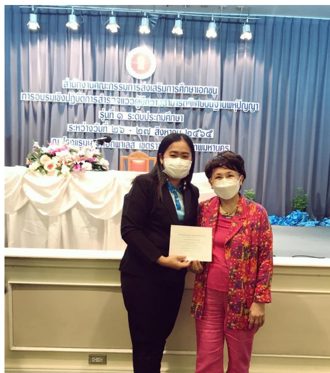
อบรมเชิงปฏิบัติการสำรวจแว่ผู้มีความสามารถพิเศษบนฐานพหุปัญญา