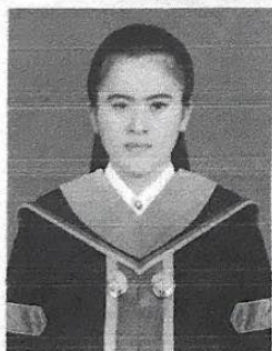
หมายเลขบัตรประชาชน

ให้ไว้ ณ วันที่ ๑ เดือน พฤษภาคม พ.ศ. ๒๕๖๒