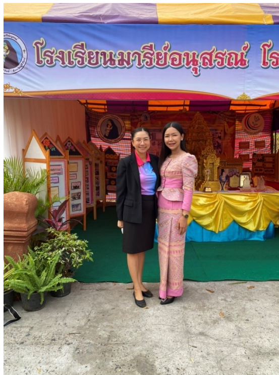
ครูร่วมกิจกรรมครูเอกชน