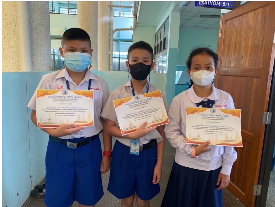
ครูส่งเสริมนักเรียนกิจกรรม “เด็กดี ศรีมารีย์”