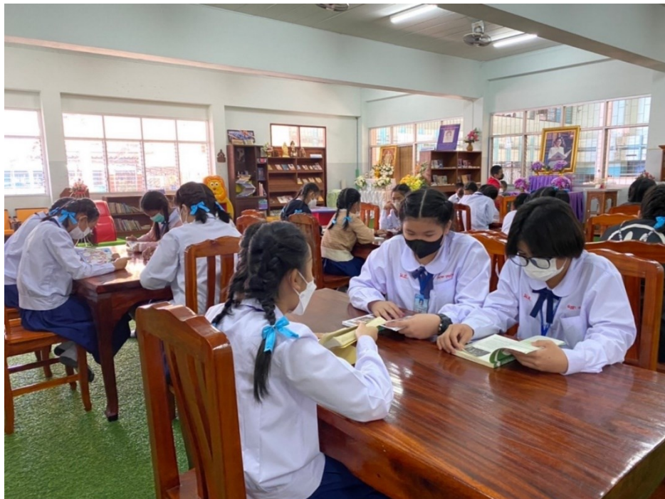
ครูพานักเรียนศึกษานอกห้องเรียนที่ห้องสมุดโรงเรียนมารีย์อนุสรณ์