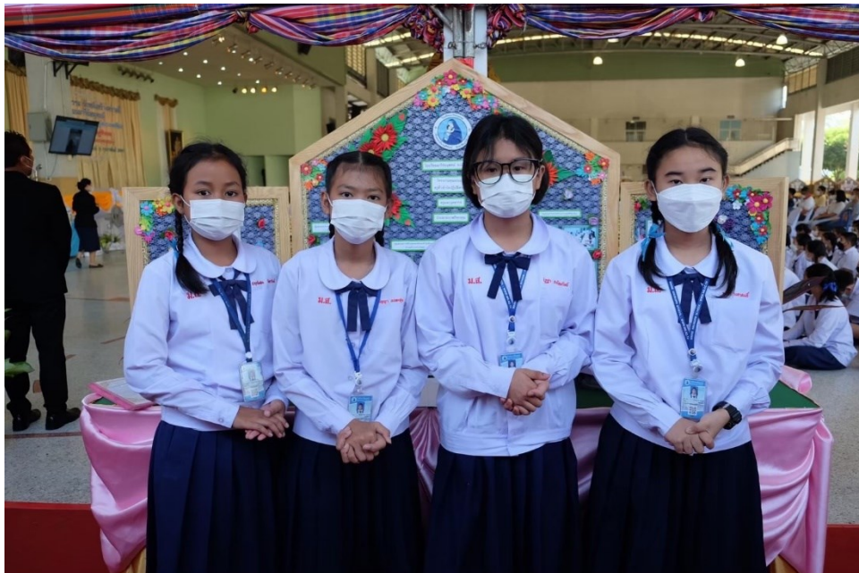
ครูส่งเสริมนักเรียนในการเข้าร่วมกิจกรรมธนาคารขยะ