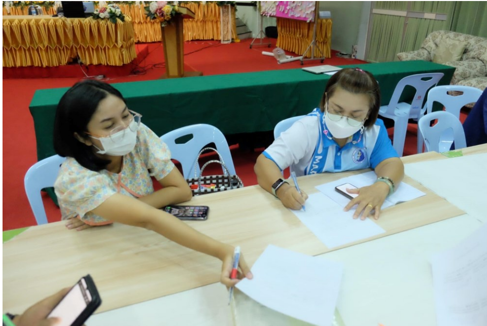
อบรมเชิงปฏิบัติการ “การพัฒนาสมรรถนะผู้เรียน ด้วยหลักสูตรแกนกลางฯ พ.ศ.2551 (ฉบับปรับปรุง พ.ศ.2560) สู่หลักสูตรฐานสมรรถนะ