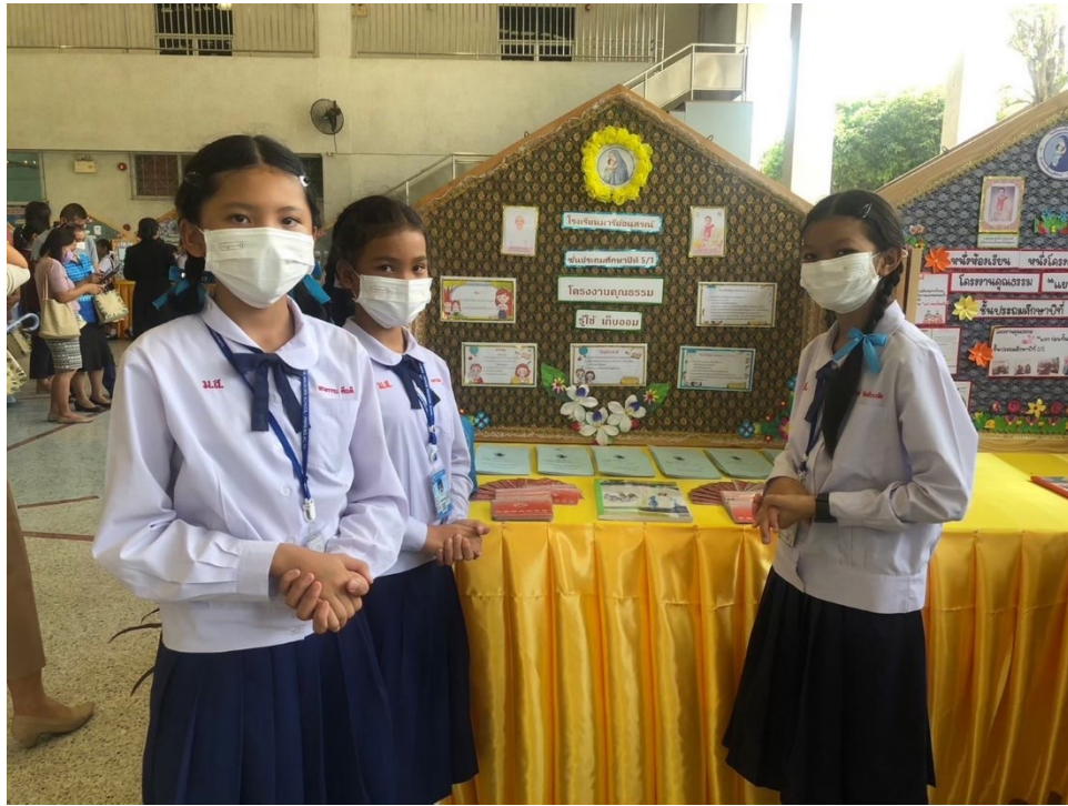
ครูที่ปรึกษาโครงการคุณธรรม รุ่งเรือง เก็บออม