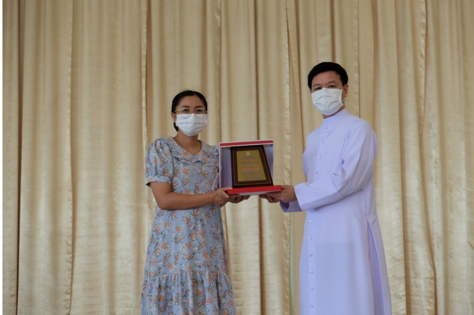
ครูรับโล่รางวัล ครูดีศรีเอกชน