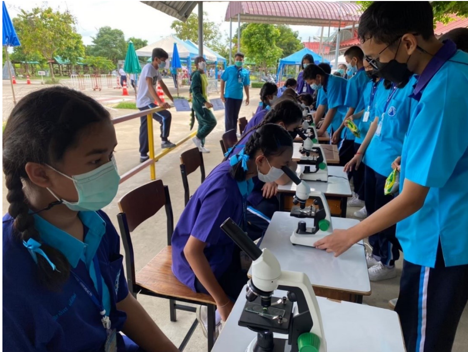
ครูพานักเรียนร่วมกิจกรรมวันวิทยาศาสตร์