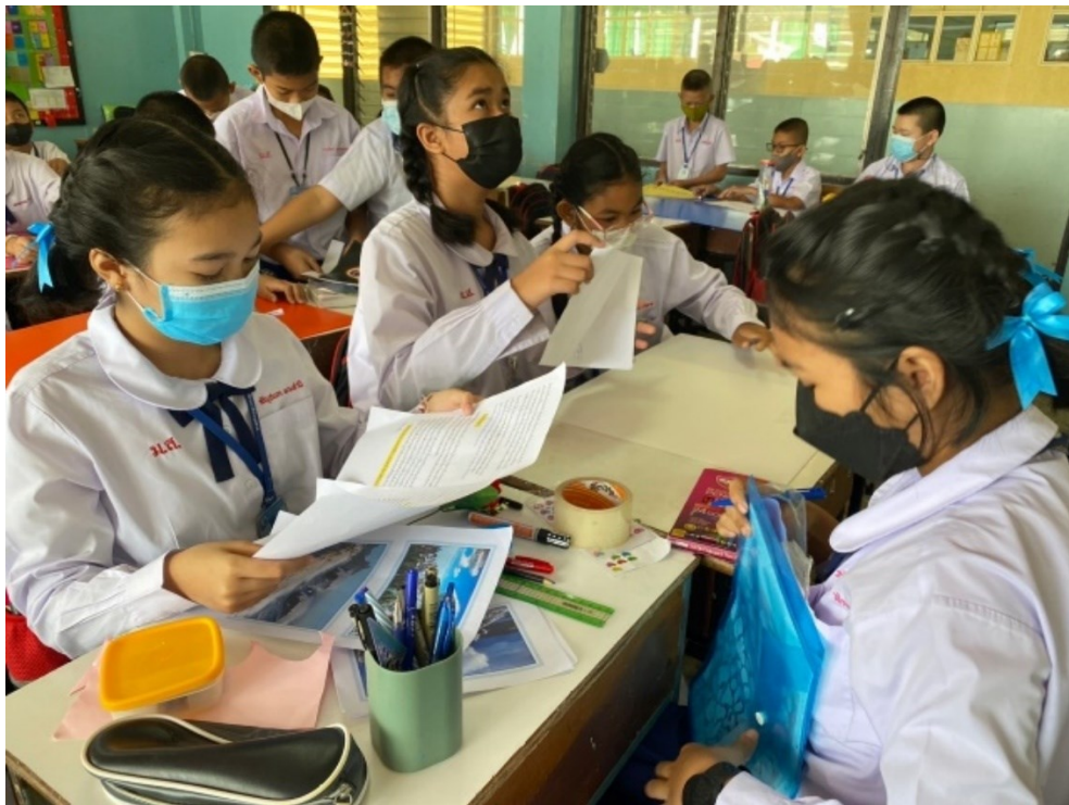
ครูพานักเรียนศึกษาความรู้ด้วยตนเองโดยปฏิบัติจริง