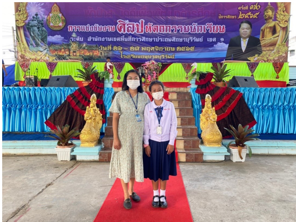
ครูฝึกสอนนักเรียนการแข่งขันศิลปหัตถกรรมนักเรียน ครั้งที่ 70