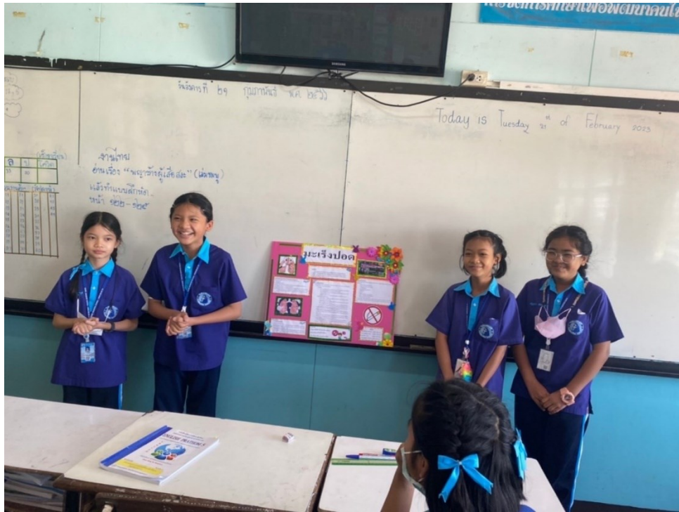
ครูให้นักเรียนนำเสนอความรู้เรื่องที่ตนเองสนใจ