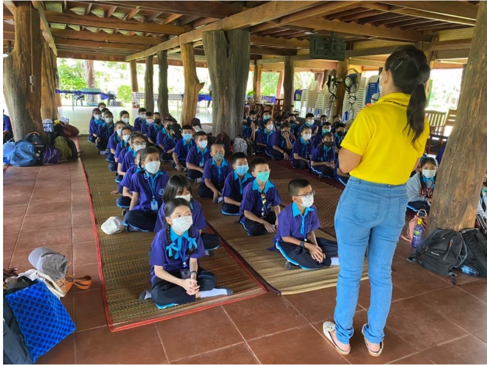
ครูร่วมกิจกรรมทัศนศึกษานักเรียน ป.5/1 ณ สวนพฤกษศาสตร์ อ.ลำปลายมาศ จ.บุรีรัมย์