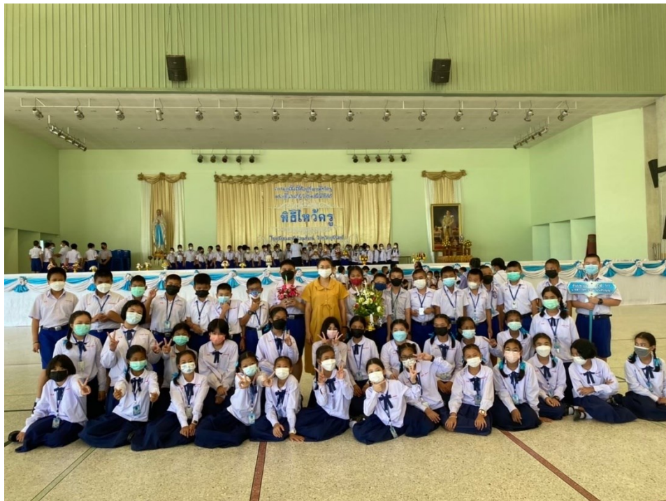
ครูร่วมกิจกรรม พิธีไหว้ครู ปีการศึกษา 2565