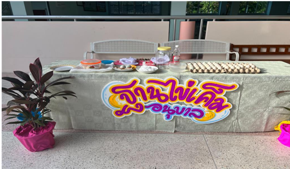
ฐานที่ 3 ไข่เค็มอบนุบาล