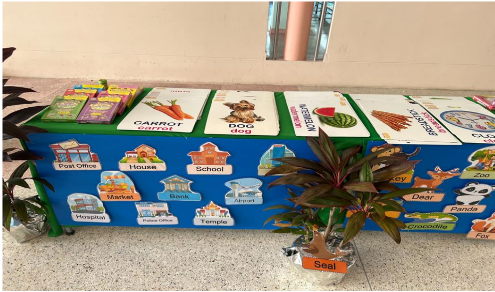
ฐานที่ 1 บัตรคำภาษาอังกฤษ