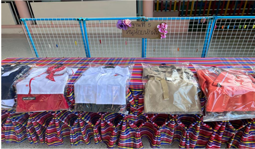
ฐานที่ 5 หนูน้อยมีฝัน