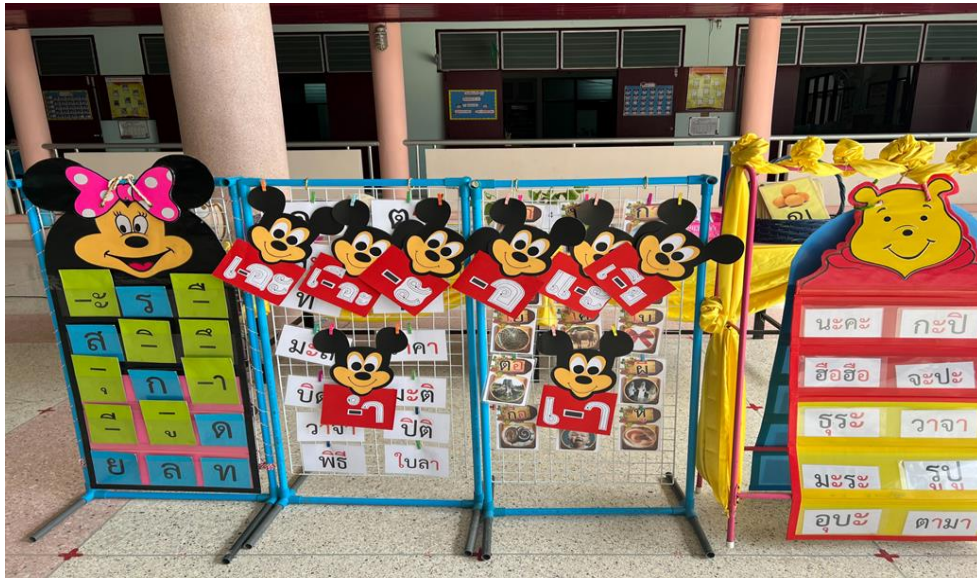
ฐานที่ 4 หนูน้อยนักอ่าน