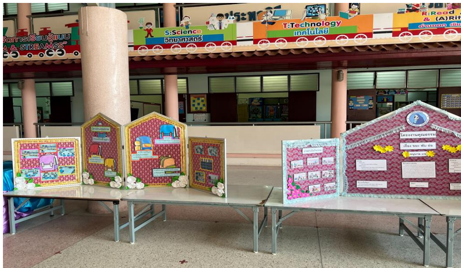
ฐานที่ 7 คุณธรรมหาบเร่