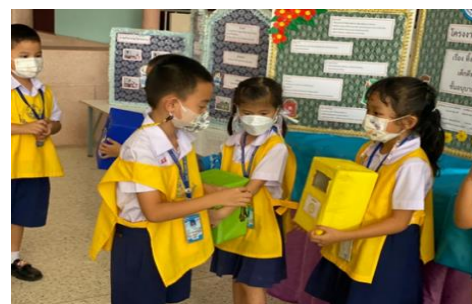
เด็กๆ ได้สัมผัสและลงมือปฏิบัติ เด็กๆ สนใจสนุกสนานที่ได้เข้าร่วมกิจกรรม คุณธรรมหาบเร่