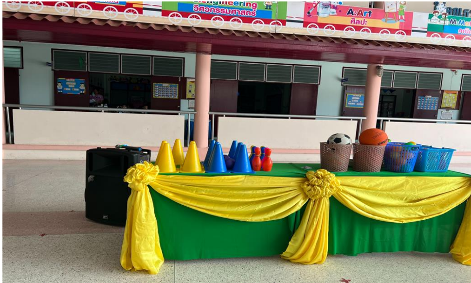
ฐานที่ 6 Exercise dance