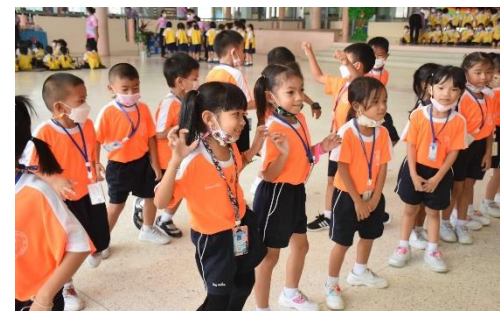
เด็กๆ ได้สัมผัสและลงมือปฏิบัติ เด็กๆ สนใจสนุกสนานที่ได้เข้าร่วมกิจกรรม Exercise dance