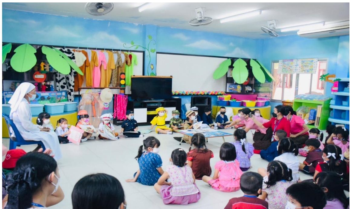
เด็กๆอ่านหนังสือที่ห้องสมุด