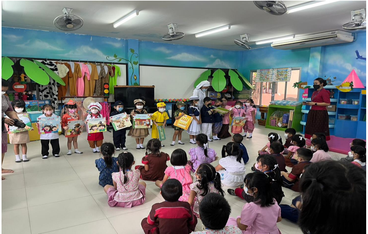
ตัวแทนเด็กๆออกมาอ่านนิทานตามภาพ