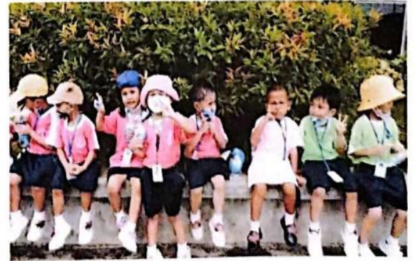
เด็กๆได้ไปทัศนศึกษาที่แหล่งเรียนรู้ ณ สนามช้างอารีนา ได้เรียนรู้จากประสบการณ์ตรงที่ได้พบเห็นสถานที่จริงกับเพื่อนๆอย่างสนุกสนาน