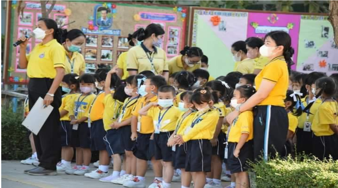
คณะครูและเด็กๆชมการแสดงวงโปงลาง