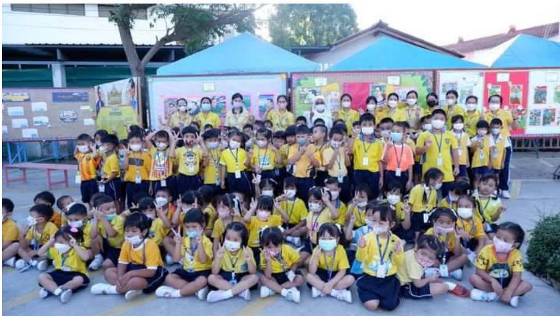
ซิสเตอร์ผู้อำนวยการร่วมถ่ายภาพกับคณะครูและเด็กๆ