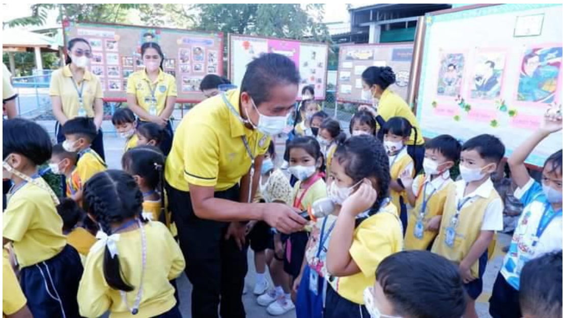
มาสเตอร์สัมภาษณ์ความรู้สึกรของเด็ก