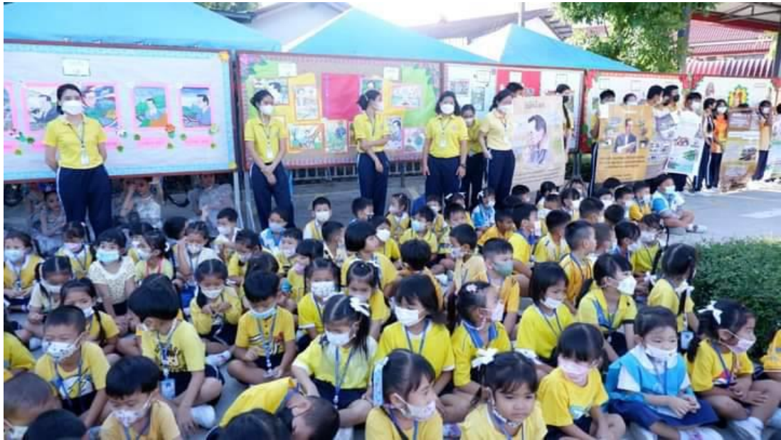
คณะครูและเด็กชมการแสดง