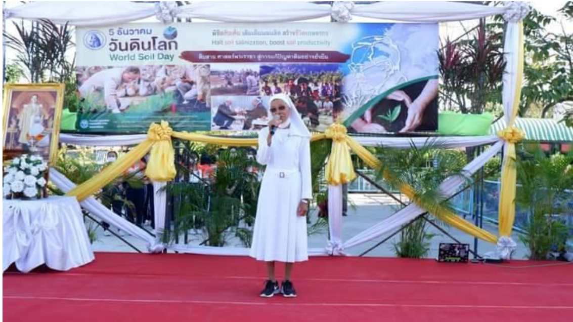
ซิสเตอร์ผู้อำนวยการกล่าวต้อนรับในพระมหากรุณาธิคุณพระบาทสมเด็จพระปรมินทรมหาภูมิพลอดุลยเดช บรมนาถบพิตร ในฐานะทรงเป็นนักวิทยาศาสตร์ดิน