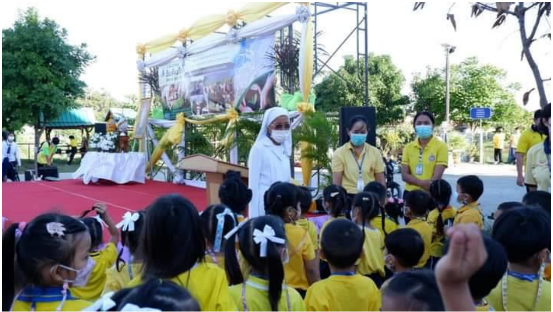
ซิสเตอร์ผู้อำนวยการเยี่ยมชมความเรียบร้อย