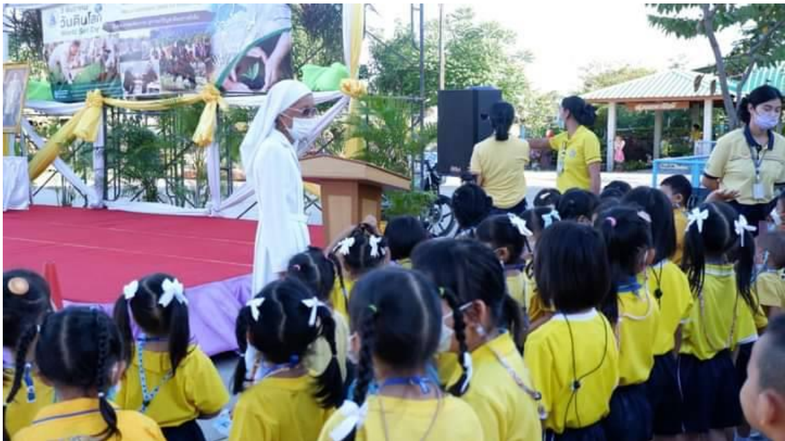
ซิสเตอร์ผู้อำนวยการเยี่ยมชมความเรียบร้อย