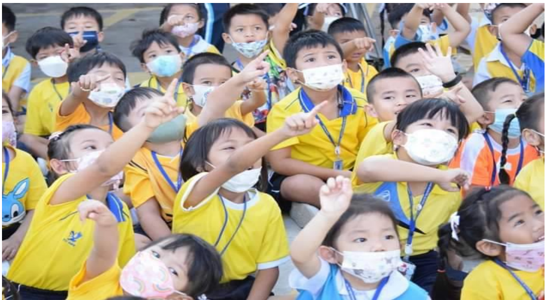
เด็กชมการแสดงโปงลางอย่างมีความสุข