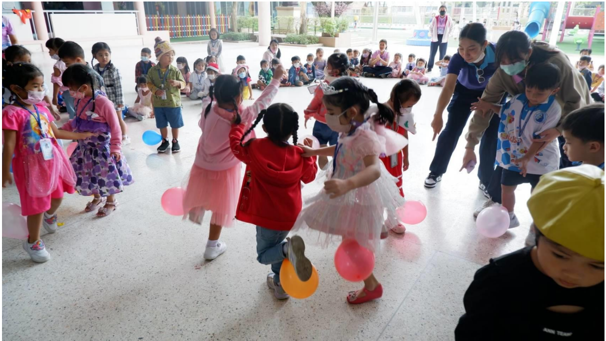
เด็กนักเรียนร่วมกิจกรรมเกมเหยียบลูกโป่ง