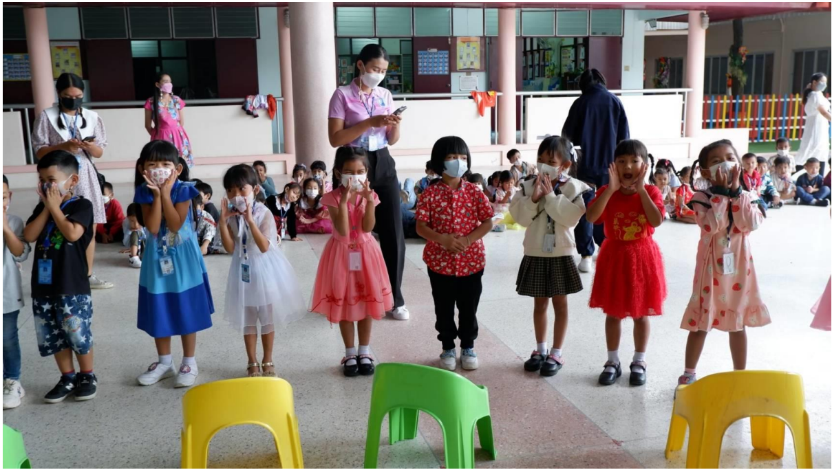
เด็กนักเรียนร่วมกิจกรรมเกมเก้าอี้ดนตรี