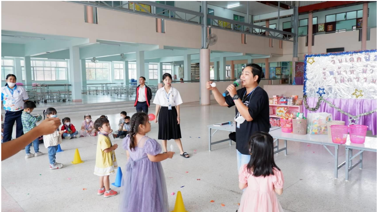
เด็กนักเรียนร่วมกิจกรรมเกมส่งลูกโป่งปอง