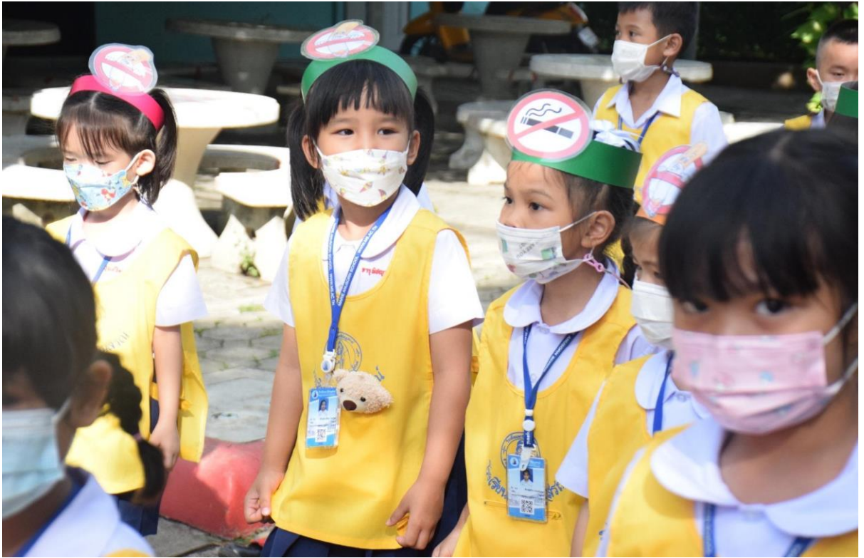
นักเรียนระดับชั้นอนุบาลปีที่ 3 ร่วมเดินรณรงค์ต่อต้านยาเสพติดเนื่องในวันต่อต้านยาเสพติด เพื่อรณรงค์และประชาสัมพันธ์ให้เด็กๆ รู้ถึงโทษของยาเสพติด