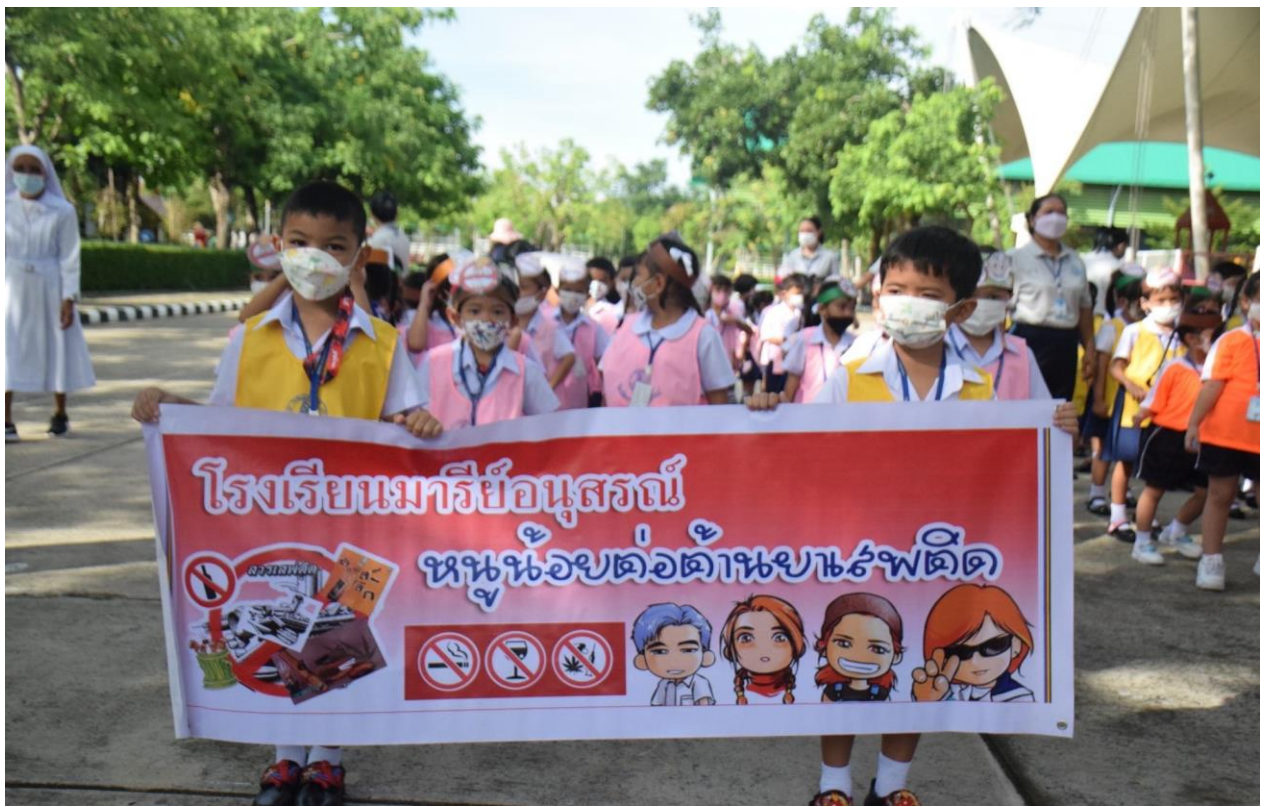
ขบวนรณรงค์ต่อต้านยาเสพติดของคณะครูและนักเรียนระดับชั้นอนุบาล โรงเรียนมารีย์อนุสรณ์