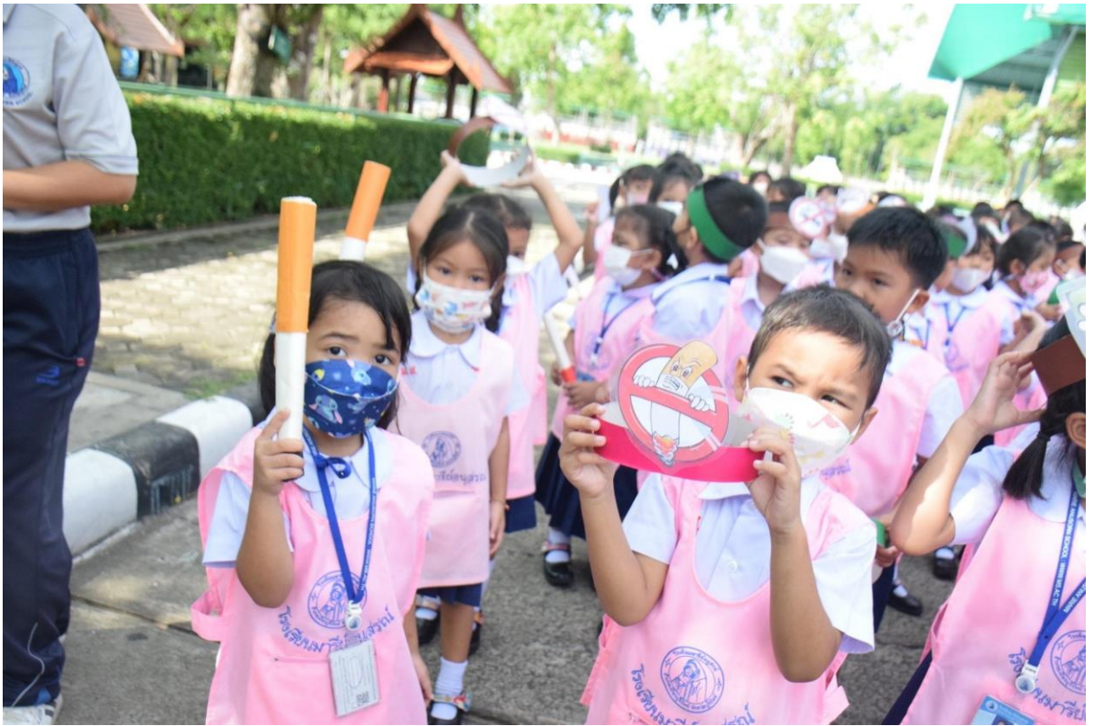
นักเรียนระดับชั้นอนุบาลปีที่ 2 โรงเรียนมารีย์อนุสรณ์ ร่วมเดินรณรงค์กิจกรรมวันต่อต้านยาเสพติดรอบบริเวณโรงเรียน เพื่อให้นักเรียนตระหนักถึงพิษภัยของยาเสพติด