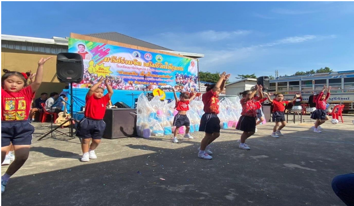
พิธีเปิดการแสดงออกกำลังกายเต้นประกอบเพลงของน้องอนุบาล