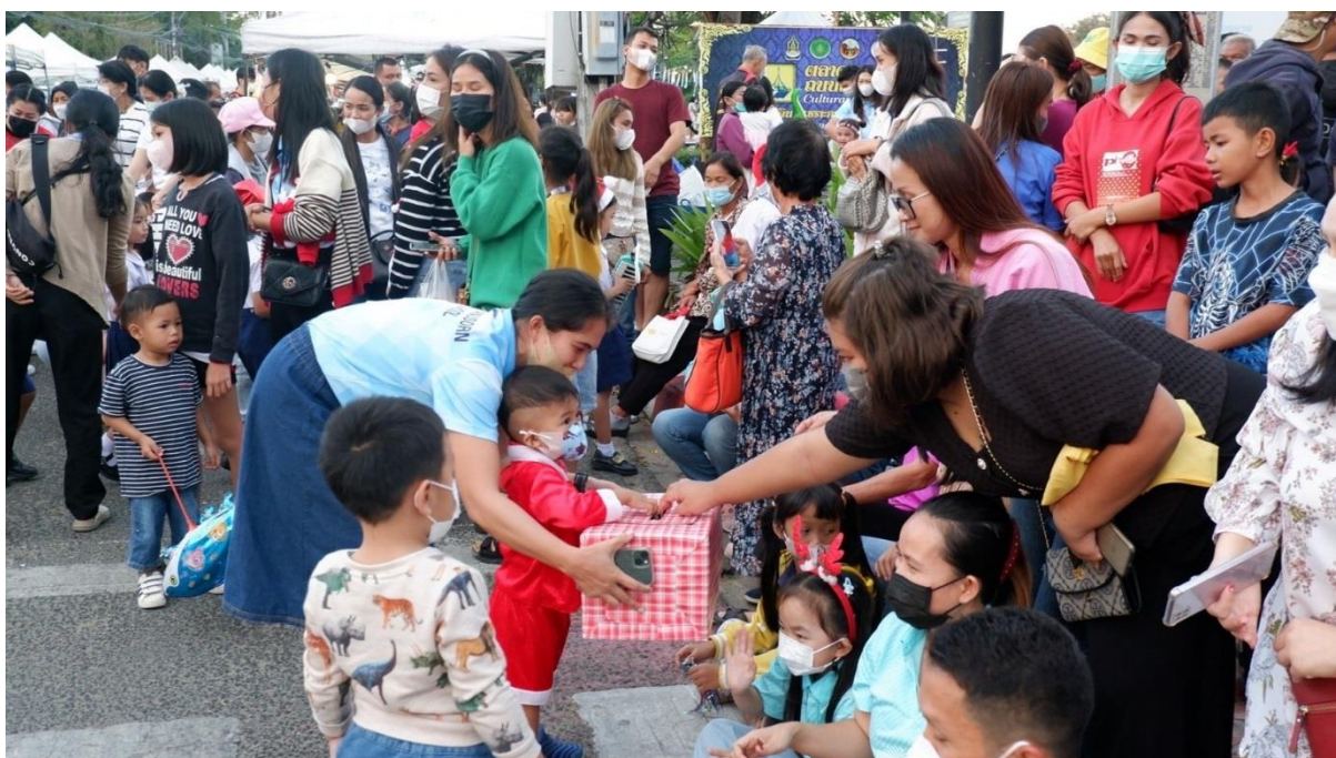
คนที่มาดูการแสดงร่วมบริจาคในกิจกรรมมารีย์ร่วมจิต เสริมชีวิตให้ชุมชน ณ ถนนคนเดิน เซราะกราว