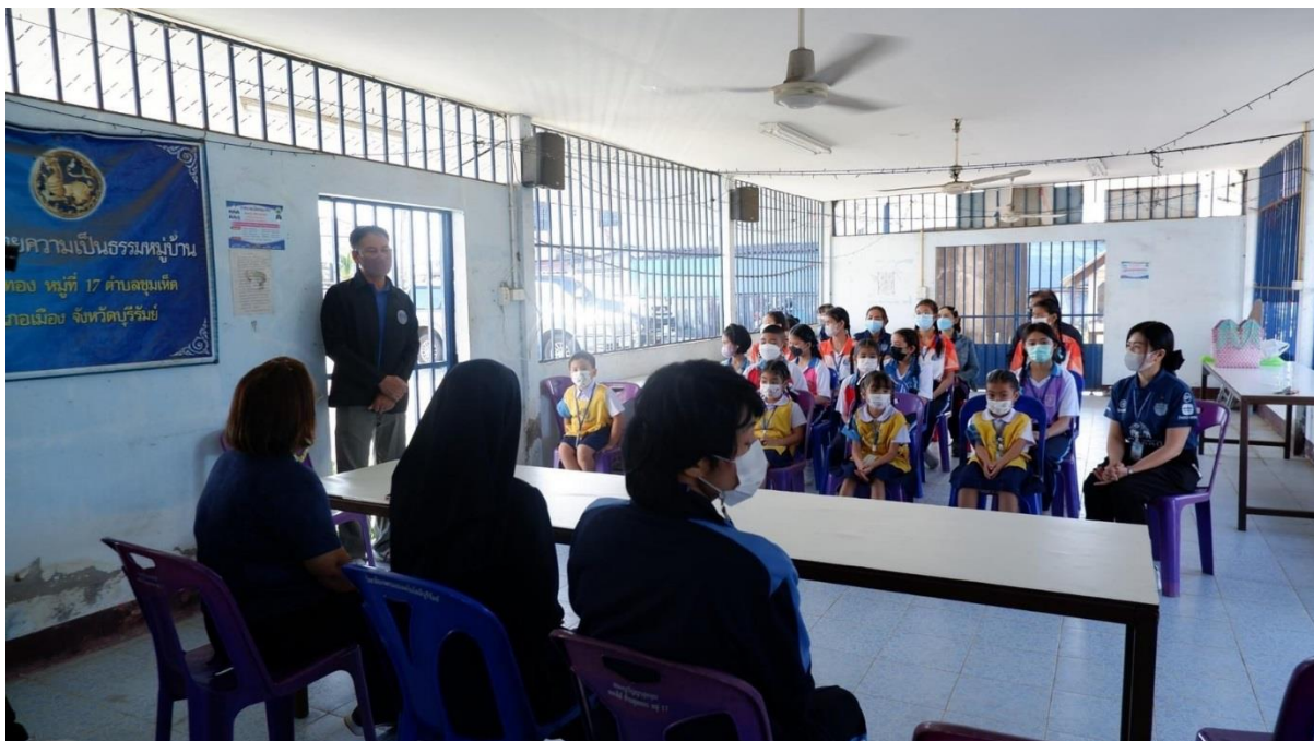
ประชุมวางแผนปรึกษาหารือเกี่ยวกับการระดมทุนให้กับคนยากไร้และคนชรา