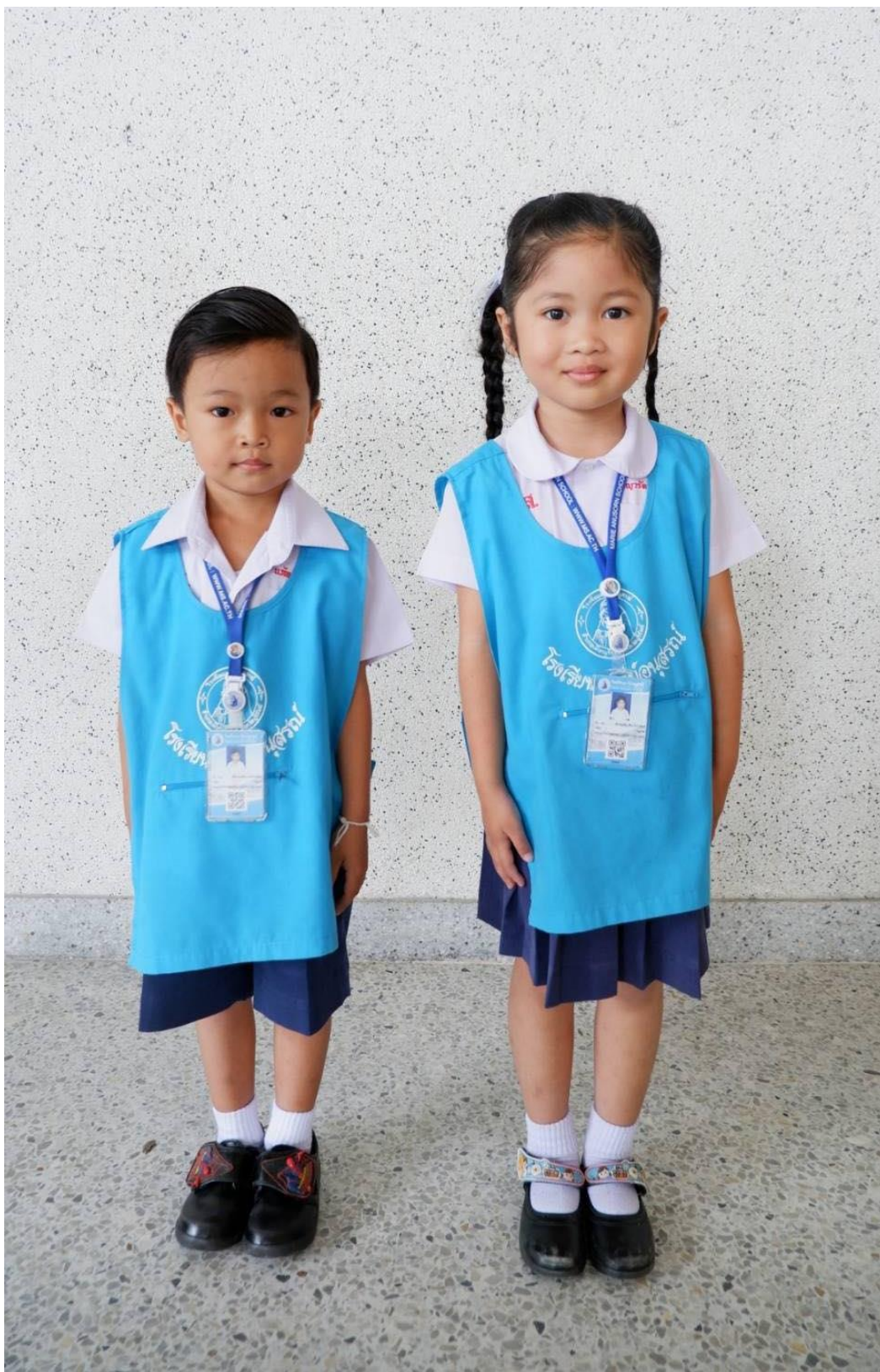
การแต่งกายชุดนักเรียน ระดับชั้นอนุบาล 1