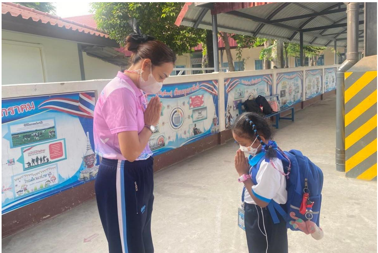
เด็กนักเรียนรู้จักไหว้และกล่าวสวัสดิ์ดีที่ทักทายคุณครู