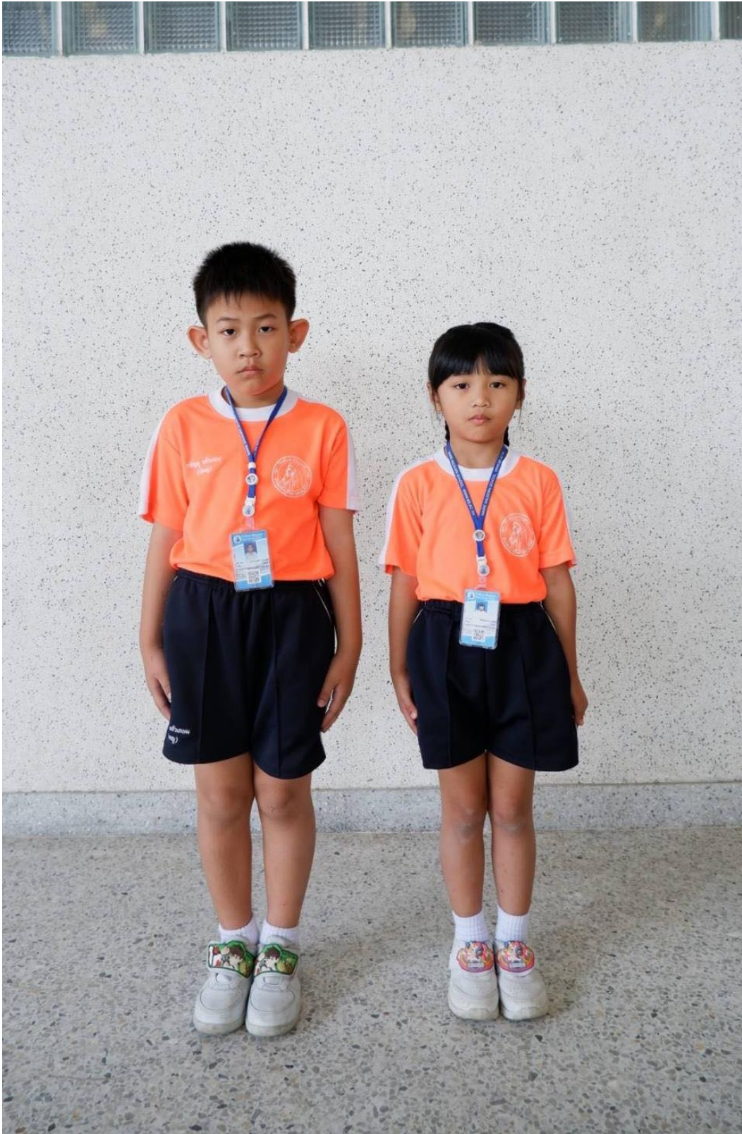
การแต่งกายชุดพลະ ระดับชั้นอนุบาล 3