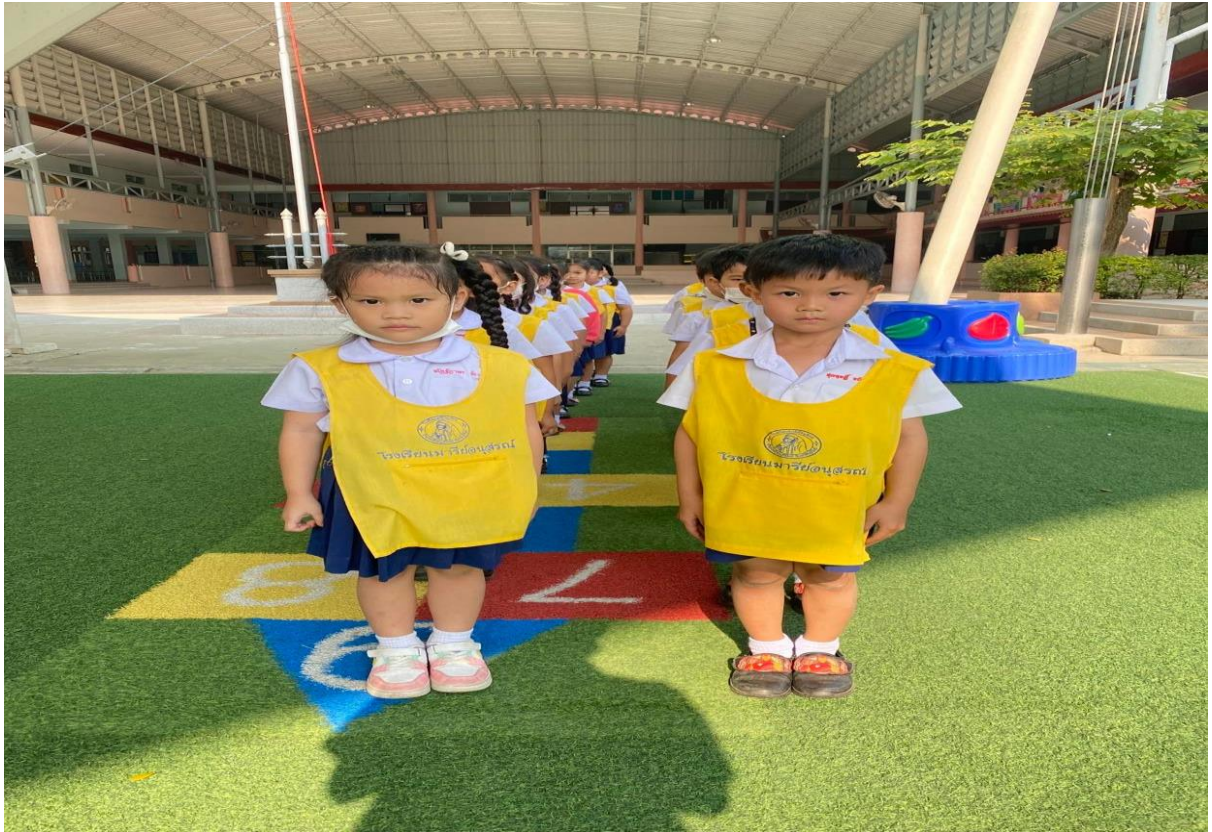
จัดระเบียบแถวฝึกความมีวินัยในตนเอง