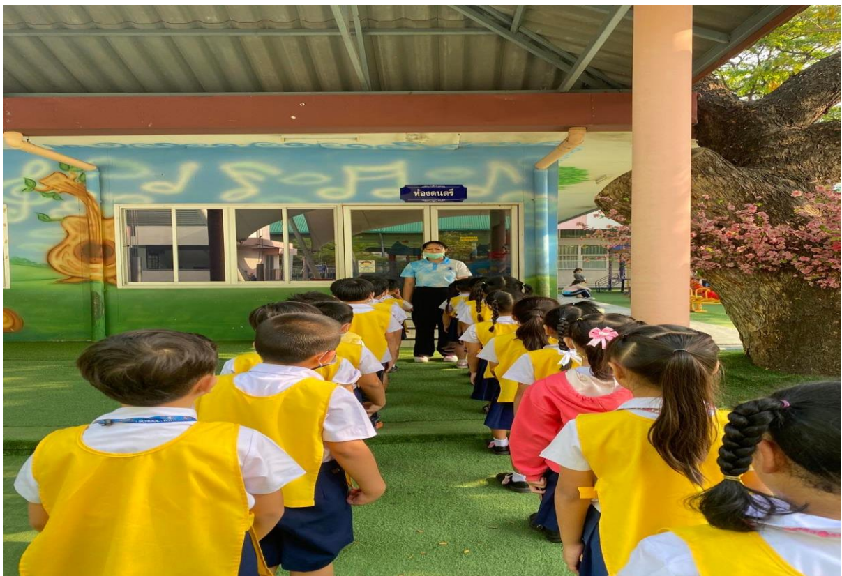
ระเบียบแถวก่อนเข้า - ออก ห้องเรียน