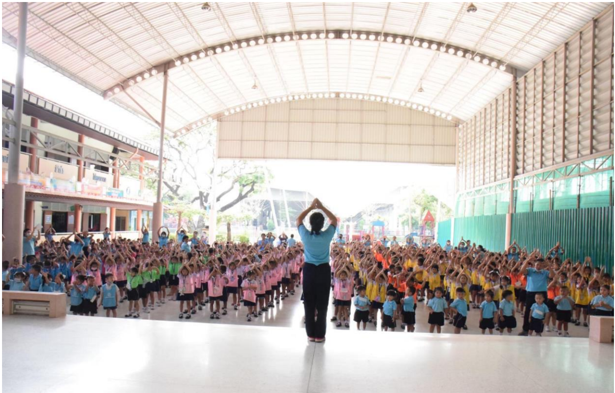
ฝึกระเบียบวินัยการอดทนทำกิจกรรมหน้าเสาธง