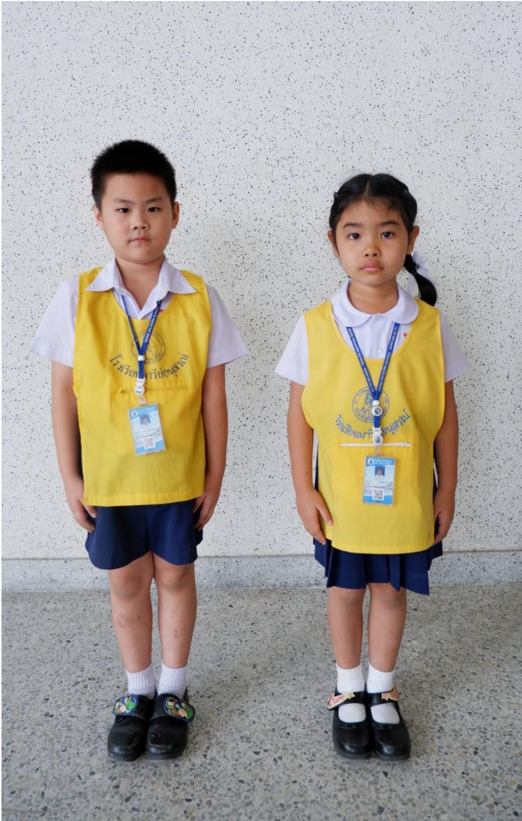
การแต่งกายชุดนักเรียน ระดับชั้นอนุบาล 3