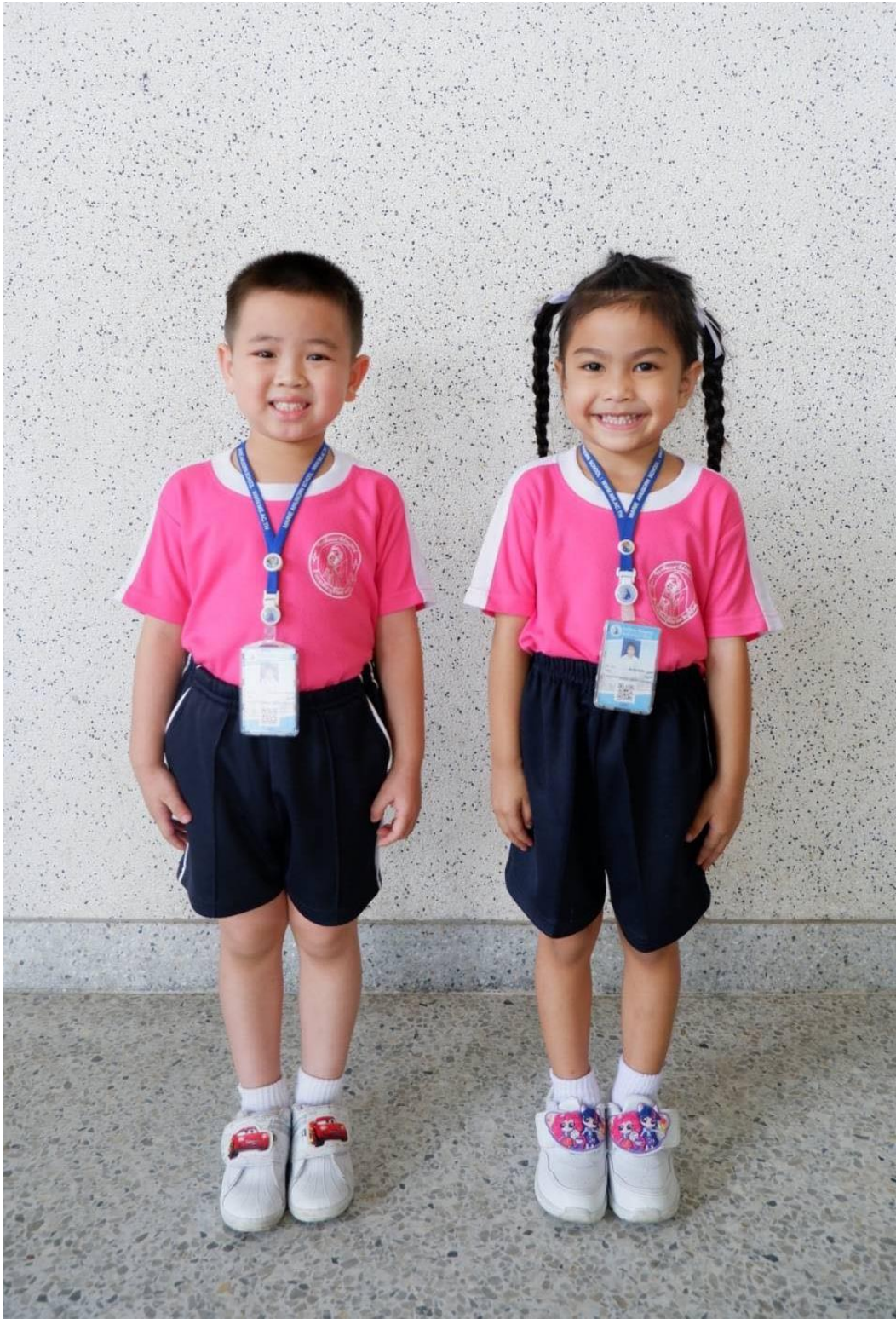
การแต่งกายชุดพลละ ระดับชั้นอนุบาล 1