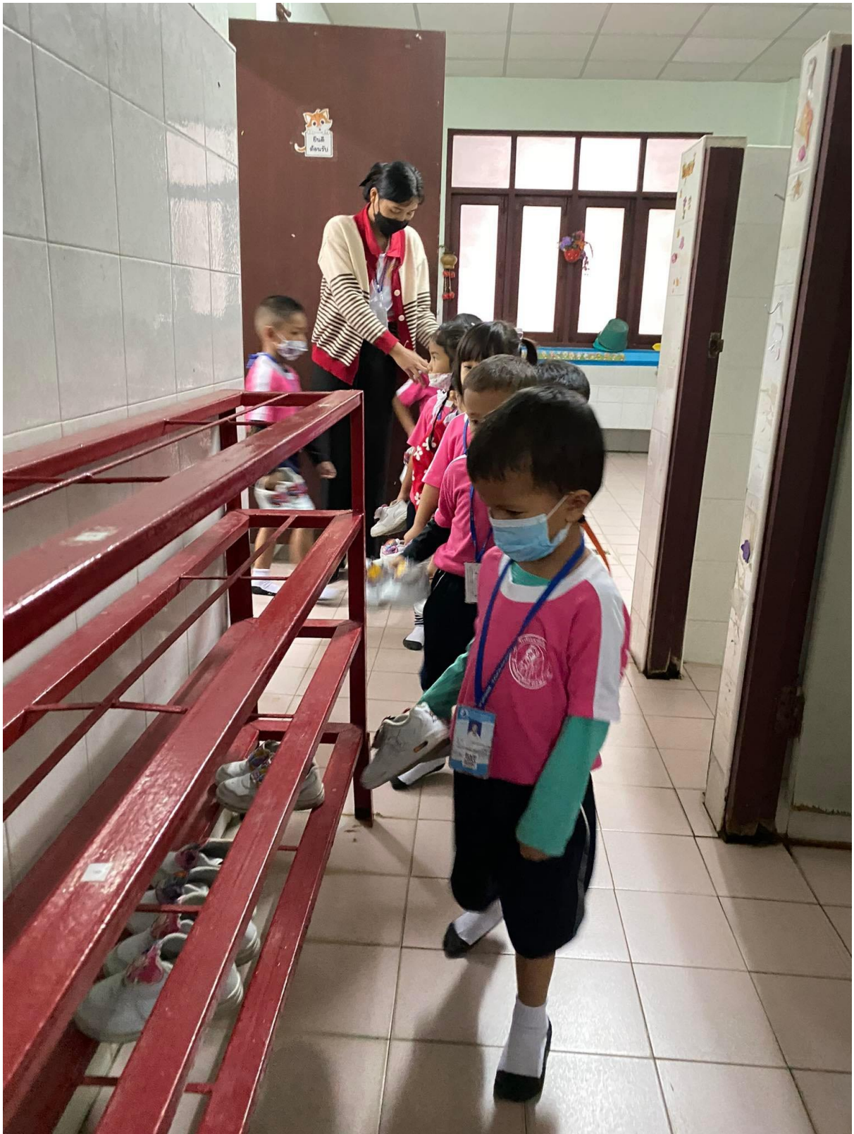
เด็กๆเข้าแถววางรองเท้าอย่างเป็นระเบียบ