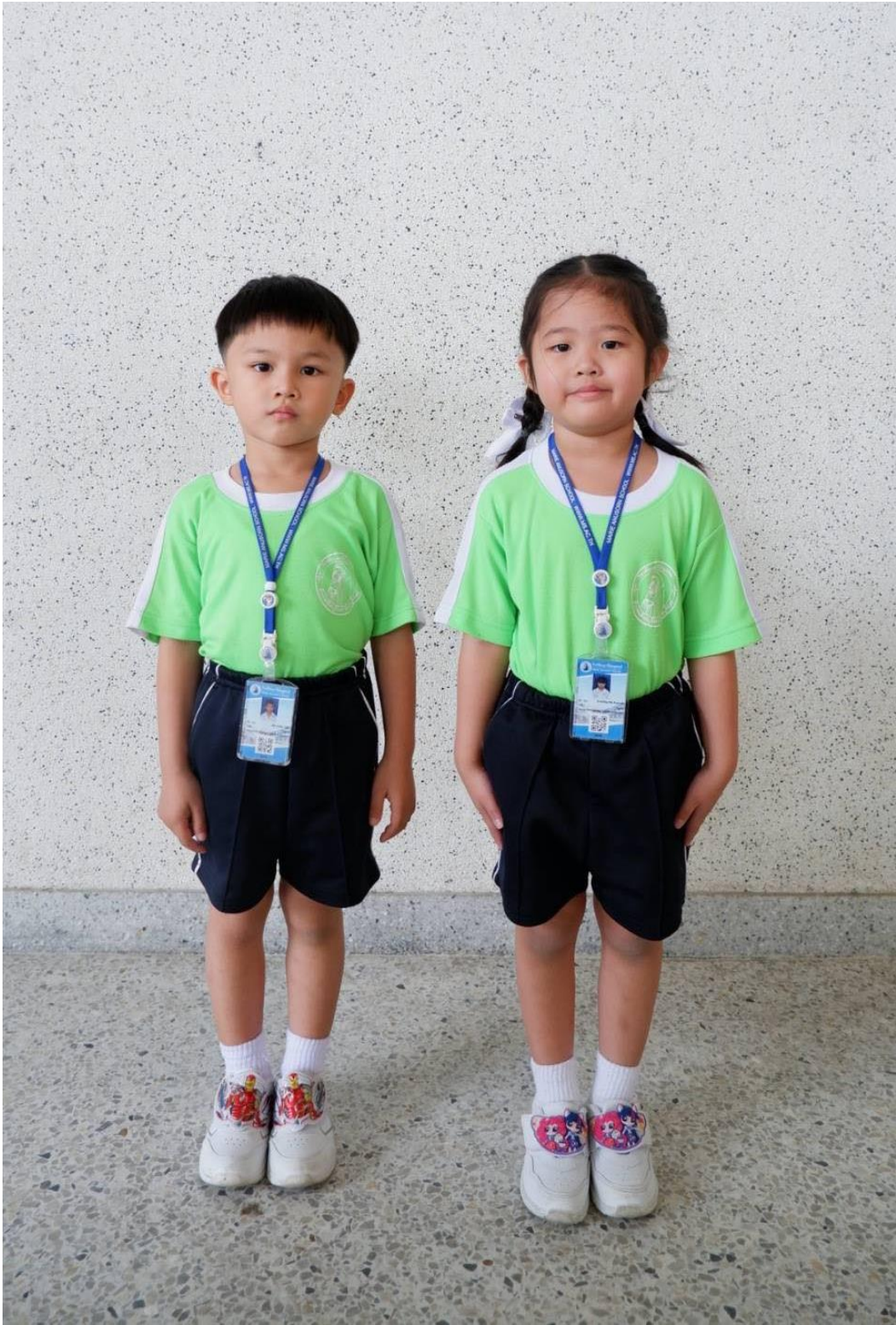
การแต่งกายชุดพลະ ระดับชั้นอนุบาล 2