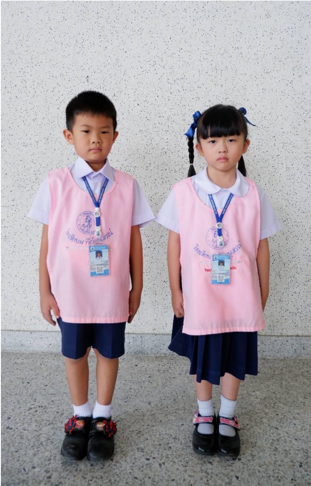
การแต่งกายชุดนักเรียน ระดับชั้นอนุบาล 2