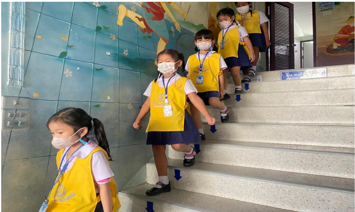
นักเรียนเดินขึ้นบันไดอย่างเป็นระเบียบ (เดินขึ้นชิดขวา)