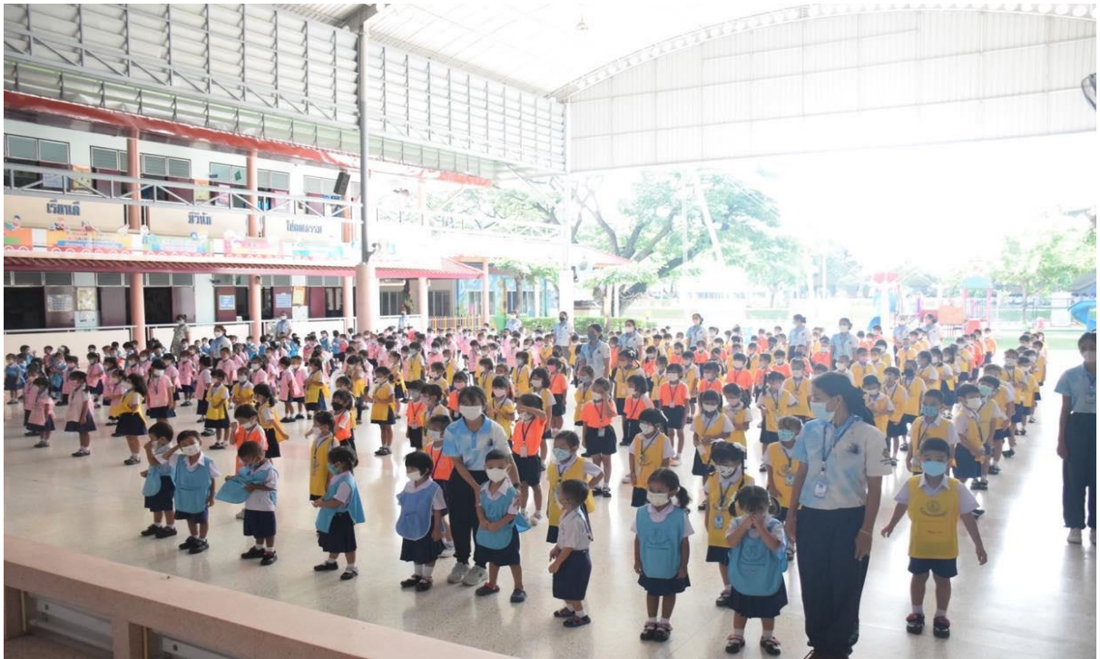
การเข้าแถวก่อนทำกิจกรรมเคารพธงชาติ