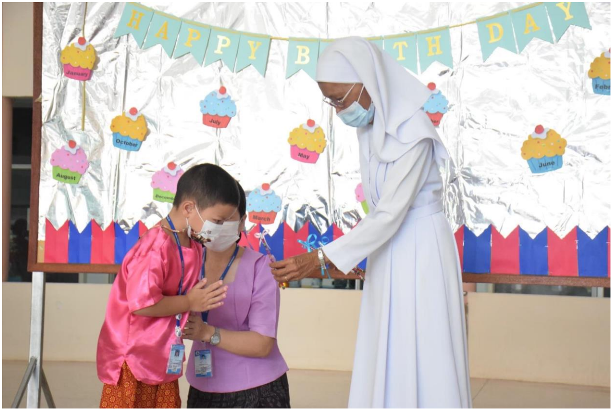
เด็กนักเรียนรู้จักการไหว้ขอบคุณเมื่อได้รับสิ่งของจากผู้ใหญ่