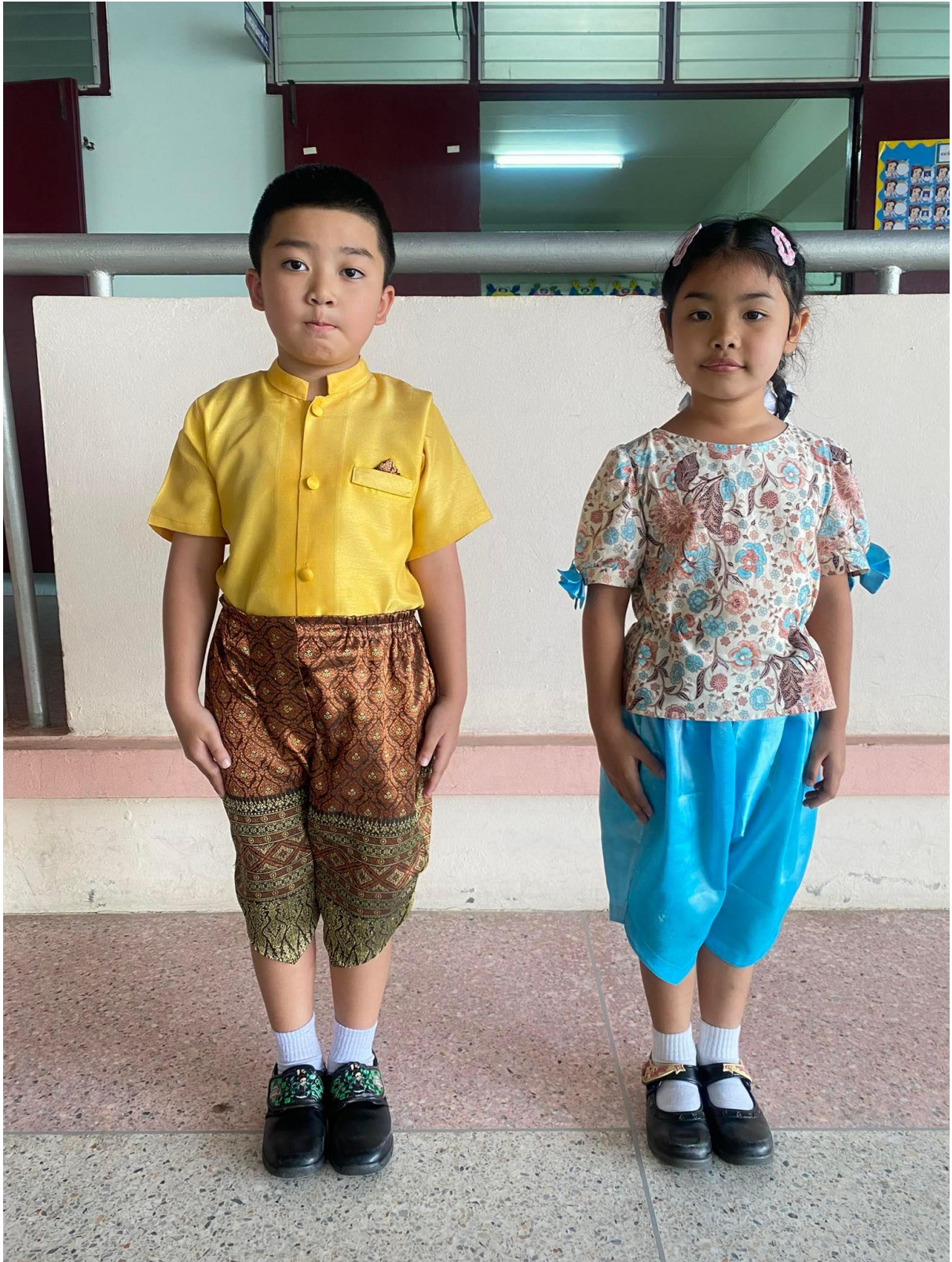
การแต่งกายด้วยชุดผ้าไทยสวยงาม