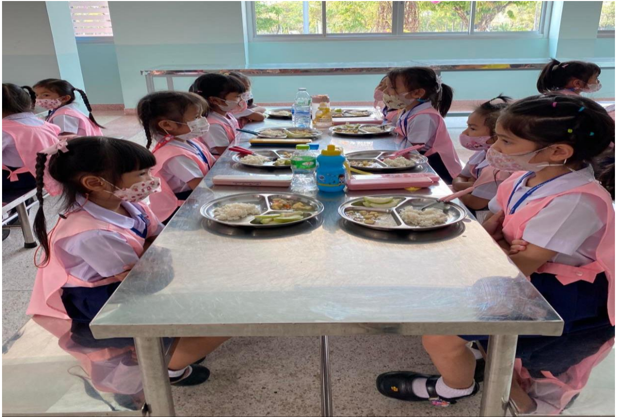
เด็ก ๆ รู้จักรับประทานอาหารด้วยตนเองอย่างเป็นระเบียบ