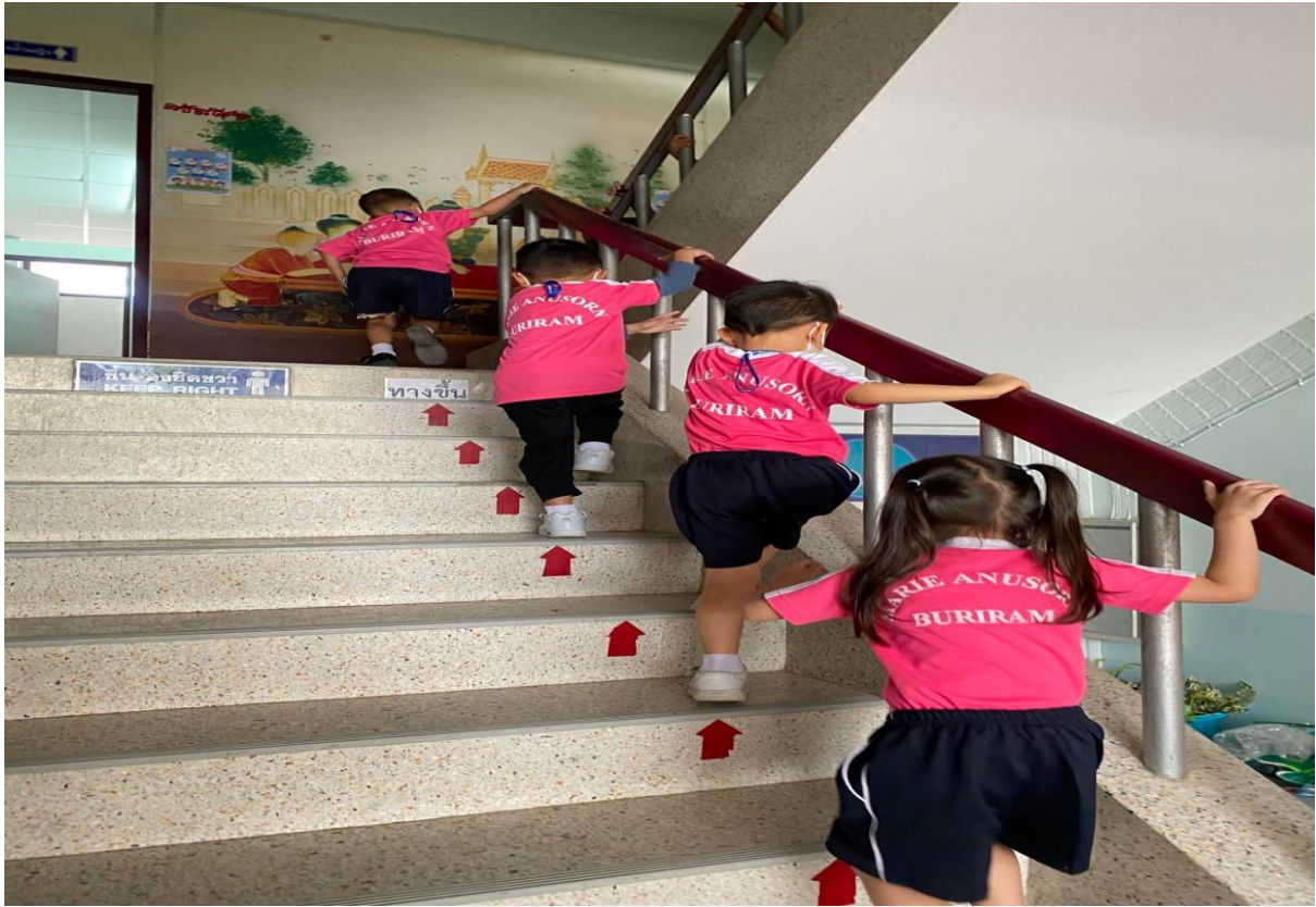
นักเรียนเดินขึ้นบันไดอย่างเป็นระเบียบ (เดินขึ้นชิดขวา)