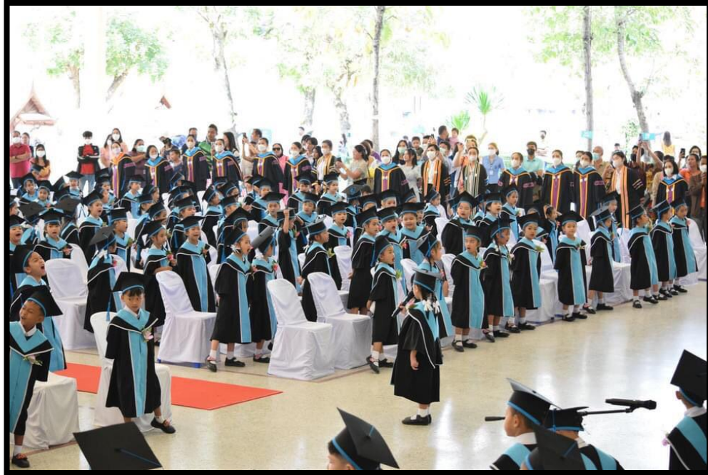
ยุวบัณฑิตร้องเพลงอนุบาลรำลึก