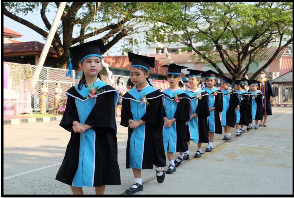
ยุวบัณฑิตเดินแถวเข้าหอประชุมเมรี่โดม