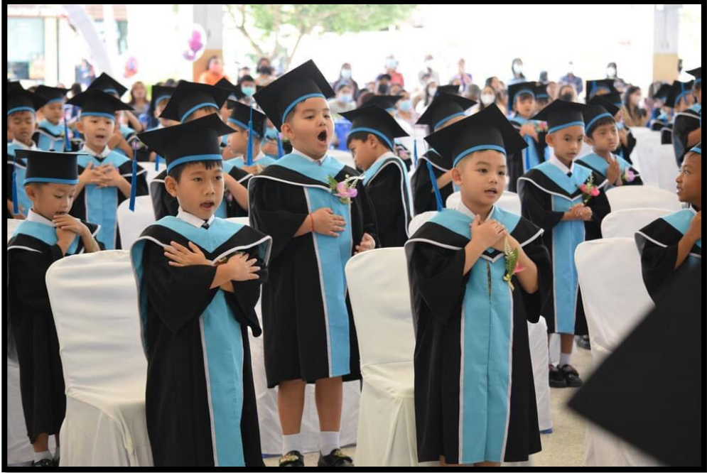
ยวบัณฑิตทำท่าทางประกอบเพลงอัตลักษณ์ 4