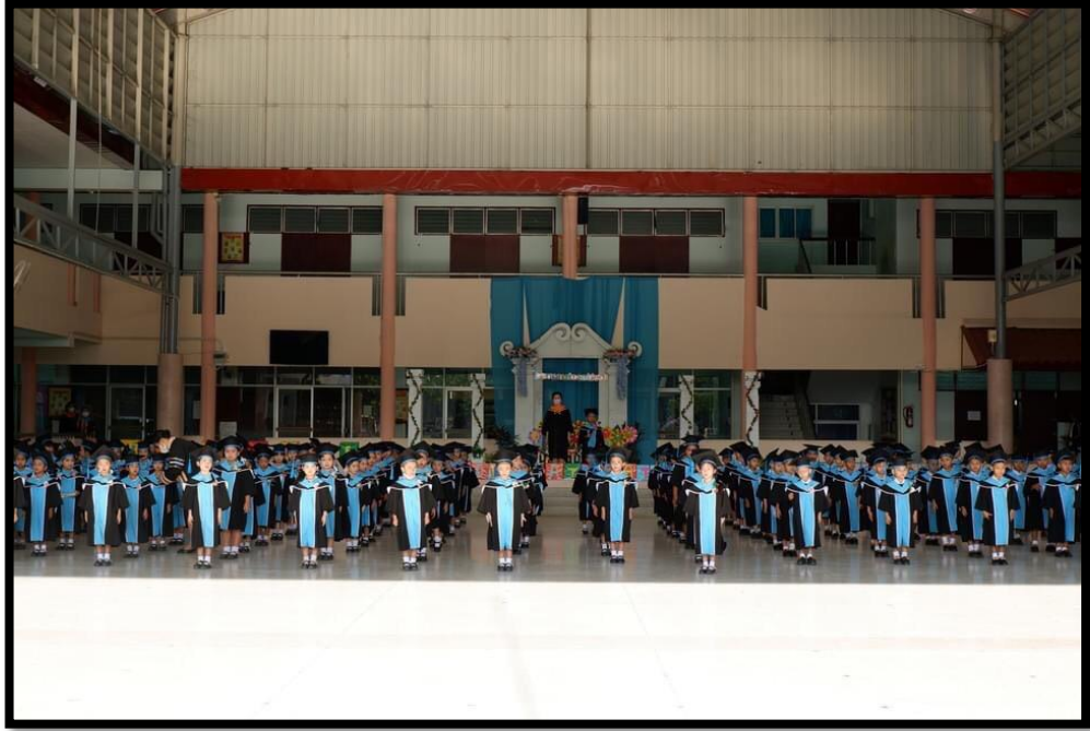
บัณฑิตน้อยเข้าแถวรายงานตัวเตรียมเดินแถวเข้าเมรุโดม