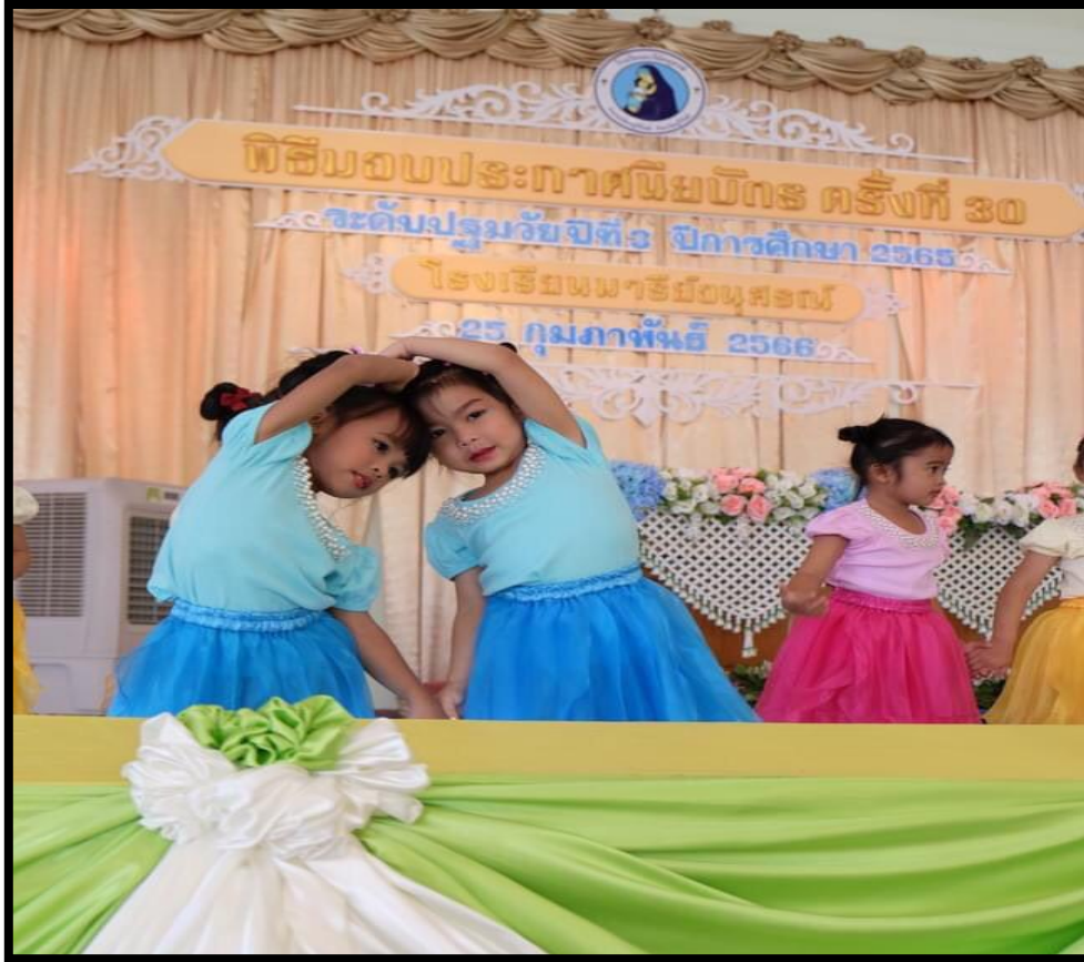
การแสดงอนุบาล 1 (เพลงรักวันละนิด)