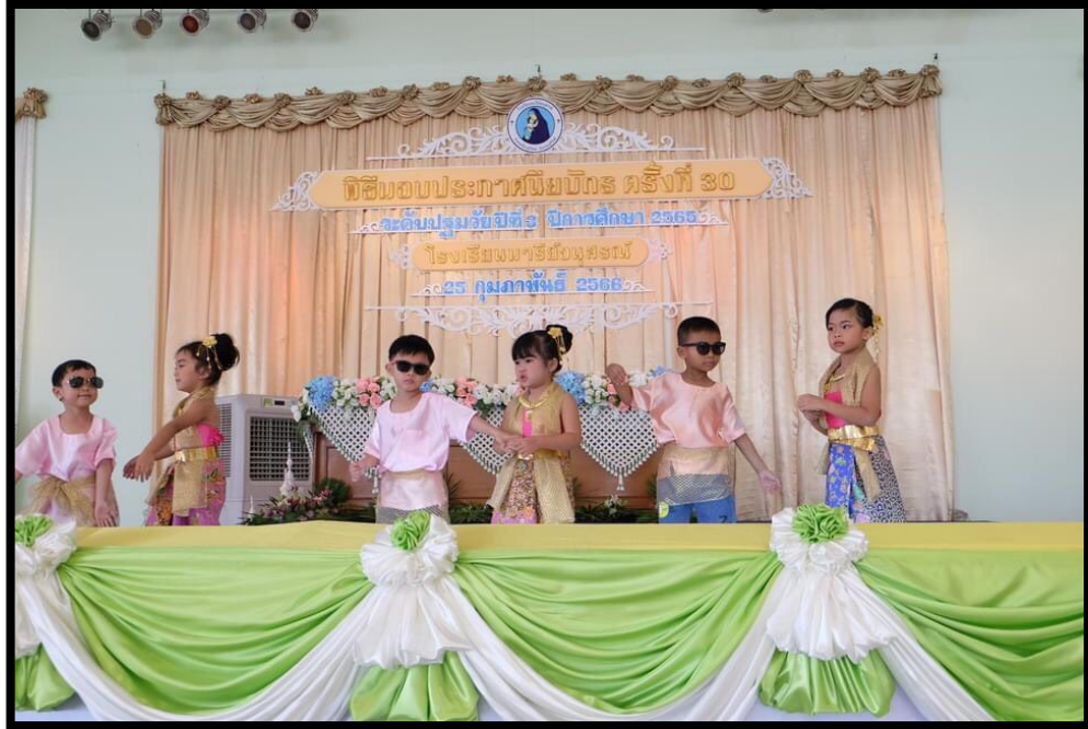
การแสดงอนุบาล 2 (เพลงขวนน้องท่องได้)