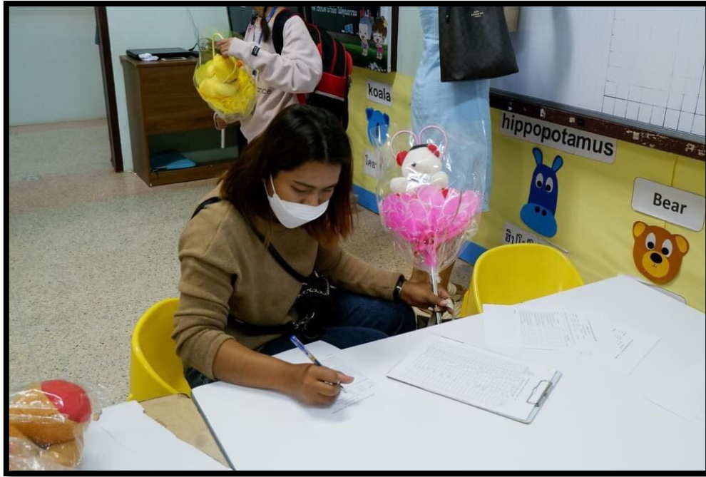
ผู้ปกครองลงทะเบียนบัณฑิต