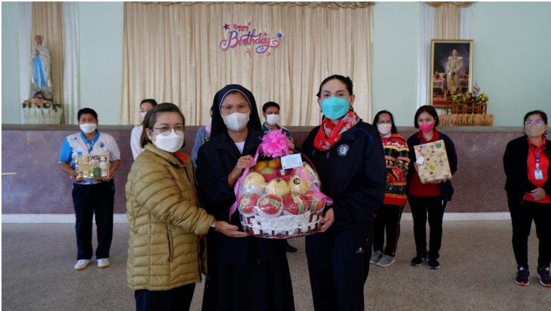
คณะครู บุคลากร เข้าร่วมอวยพรวันเกิดซิสเตอร์นงลักษณ์ ประทุมปี