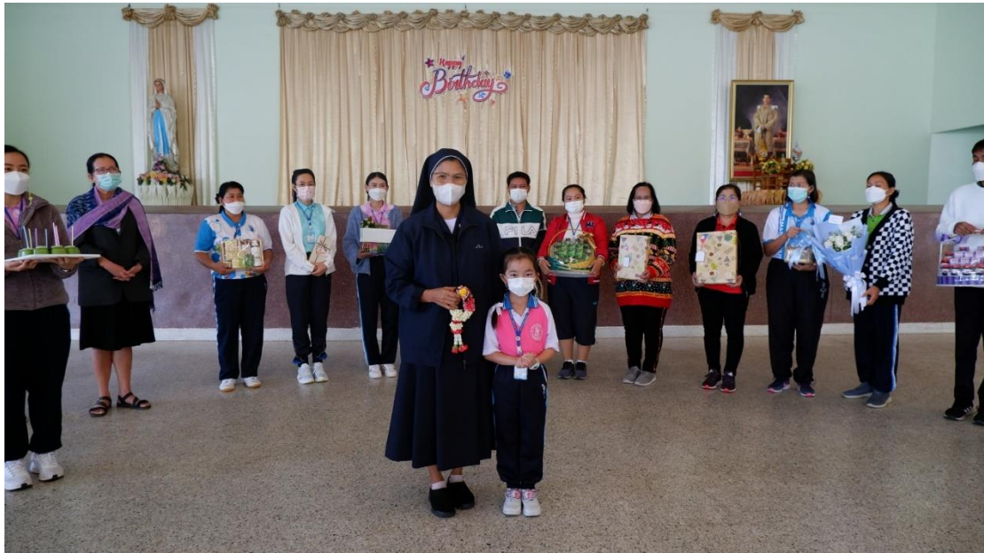
คณะครู บุคลากร เข้าร่วมอวยพรวันเกิดซิสเตอร์นงลักษณ์ ประทุมปี