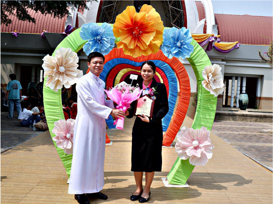
ผู้บริหาร ร่วมแสดงความยินดีแก่คณะครูที่ได้รับรางวัลครูผู้สอนดีเด่น ประจำปี 2566