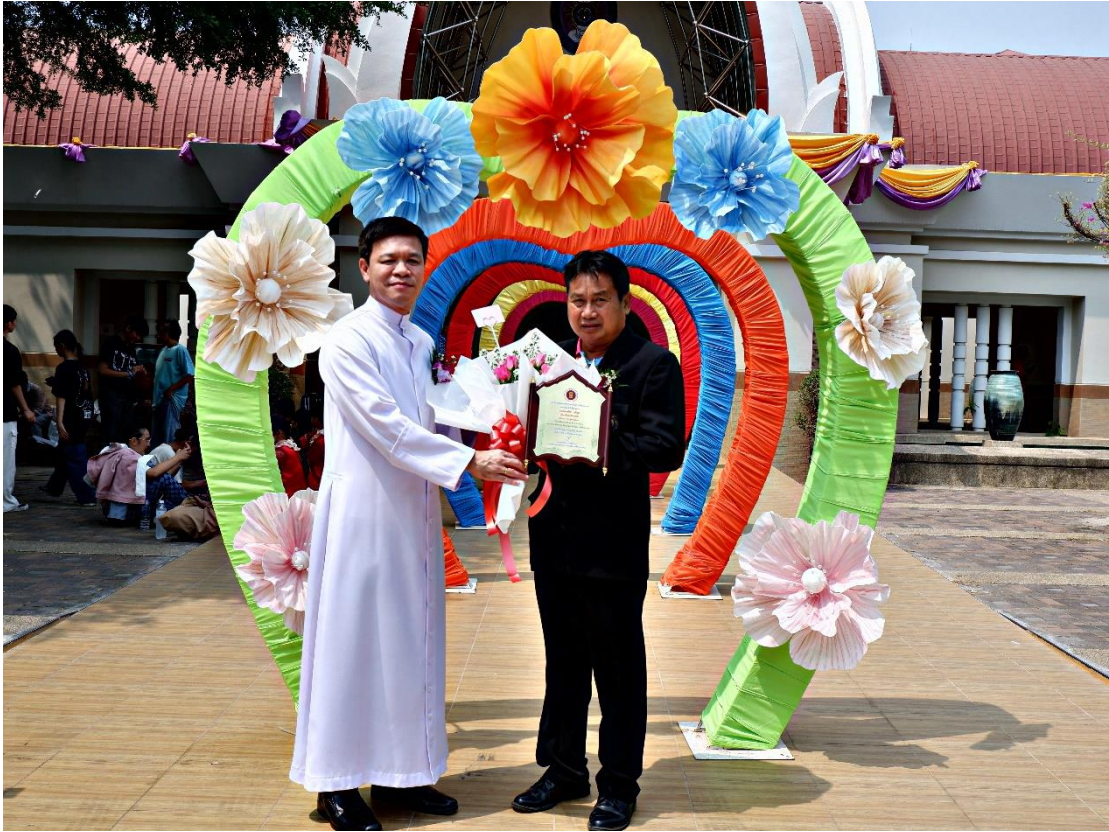
ผู้บริหาร ร่วมแสดงความยินดีแก่คณะครูที่ได้รับรางวัลครูผู้สอนดีเด่น ประจำปี 2566