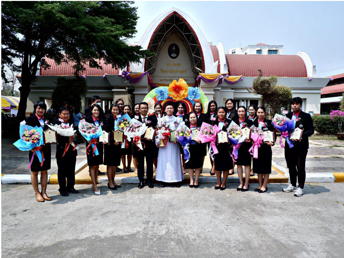
ผู้บริหาร ร่วมแสดงความยินดีแก่คณะครูที่ได้รับรางวัลครูผู้สอนดีเด่น ประจำปี 2566