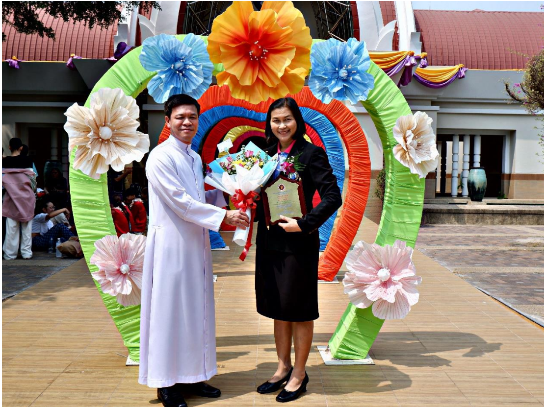
ผู้บริหาร ร่วมแสดงความยินดีแก่คณะครูที่ได้รับรางวัลครูผู้สอนดีเด่น ประจำปี 2566