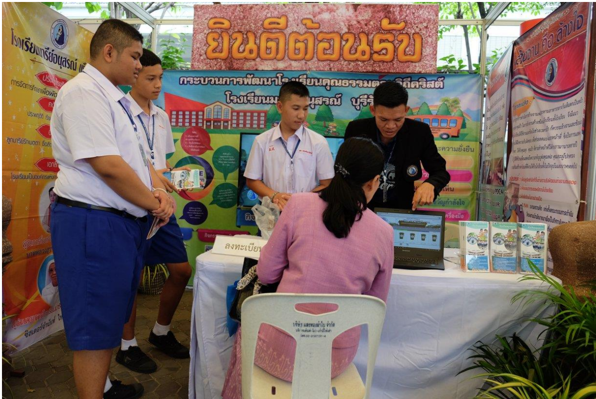
การนำเสนอกระบวนการจัดการขยะ “งานสัปดาห์คุณธรรมระดับชาติ”