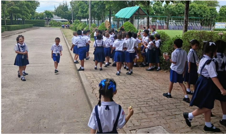
นักเรียนคัดแยกขยะจำพวกใบไม้ ถุงพลาสติก แก้วน้ำ ไปทิ้งลงถังขยะ