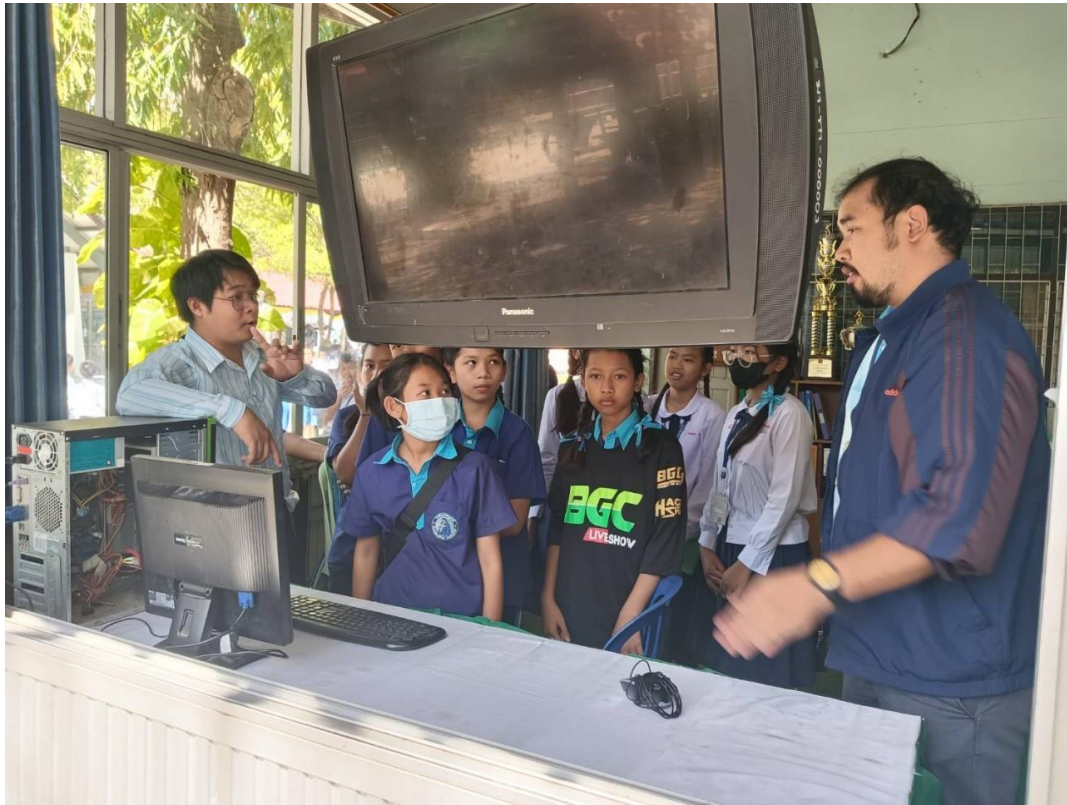
ครูและนักเรียนจิตอาสาเตรียมพร้อมเปิดธนาคารเพื่อรับฝากขยะ