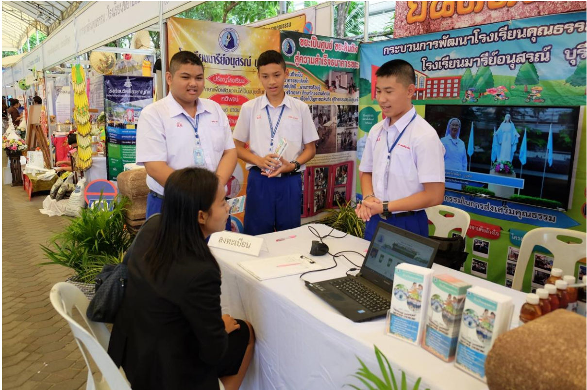
การนำเสนอกระบวนการจัดการขยะ “งานสัปดาห์คุณธรรมระดับชาติ”