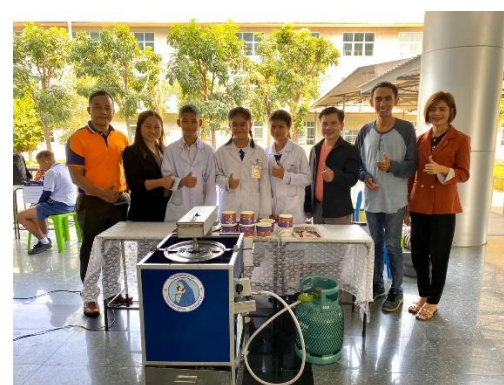
กิจกรรมการแข่งขันงานศิลปะเทคโนโลยีนักเรียนและการแข่งขันทักษะนักเรียนโรงเรียนเอกชน