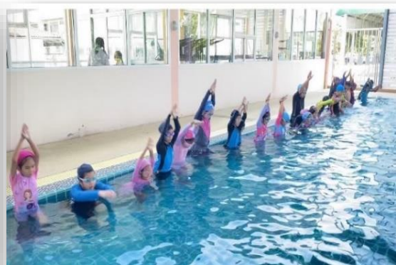
กิจกรรมการเรียนการสอนว่ายน้ำนักเรียนโรงเรียนมารีย์อนุสรณ์