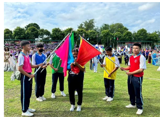
กิจกรรมการแข่งขันกีฬาโรงเรียนมารีย์อนุสรณ์