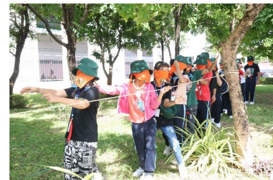
กิจกรรมเข้าค่ายลูกเสือ - เนตรนารี ณ โรงเรียนมารีย์อนุสรณ์