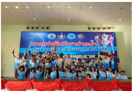
กิจกรรมการเรียนการสอนว่ายน้ำโรงเรียนมารีย์อนุสรณ์