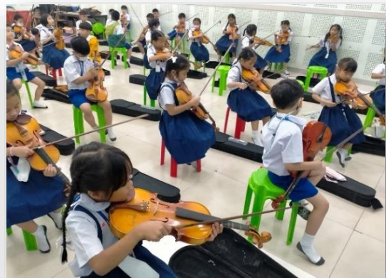
กิจกรรมชมรมดนตรีนักเรียนโรงเรียนมารีย์อนุสรณ์