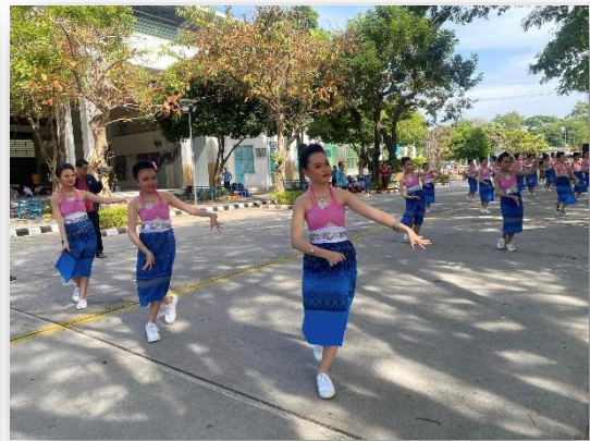
กิจกรรมชมรมนาฏศิลป์นักเรียนโรงเรียนมารีย์อนุสรณ์