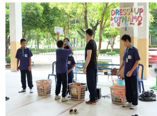
กิจกรรมเข้าค่ายภาษาอังกฤษ English camp ณ โรงเรียนมารีคอนสตรัคชั่น