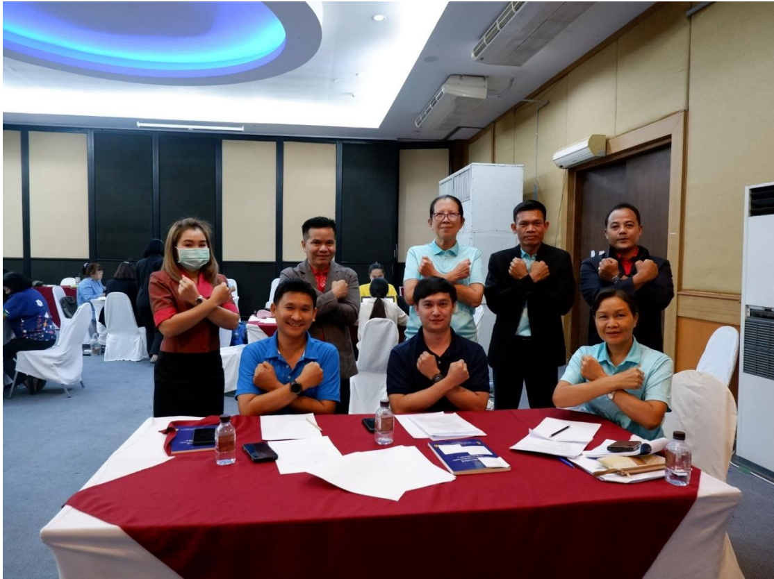
แสดงสัญลักษณ์ การป้องกันการทุจริต