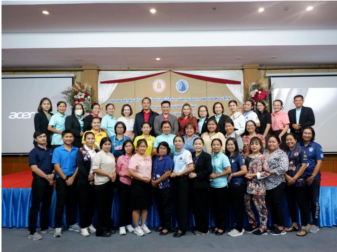
ถ่ายภาพวิทยากรและคุณครูผู้สอนในรายวิชาเพิ่มเติม “การป้องกันการทุจริต” โรงเรียนมารีอานุสรณ์