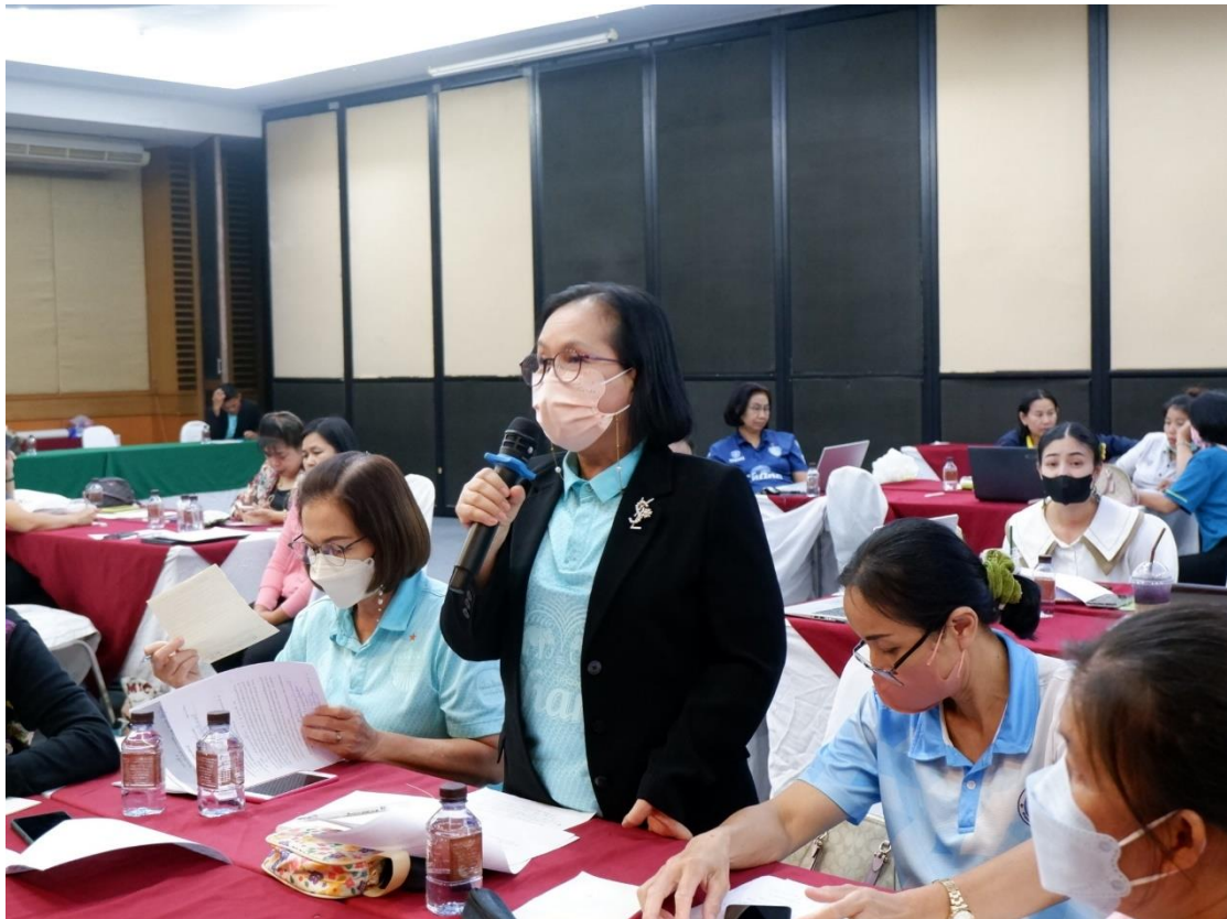
คุณครูร่วมกันเขียนโครงร่างของแผนวิชาเพิ่มเติม “ป้องกันการทุจริต”