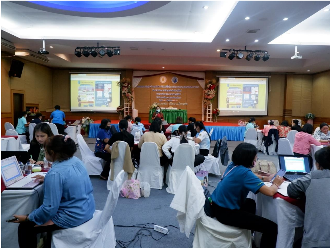
คุณครูทุกท่านมีความตั้งใจในการอบรมหลักสูตรด้านทฤษฎีการศึกษา