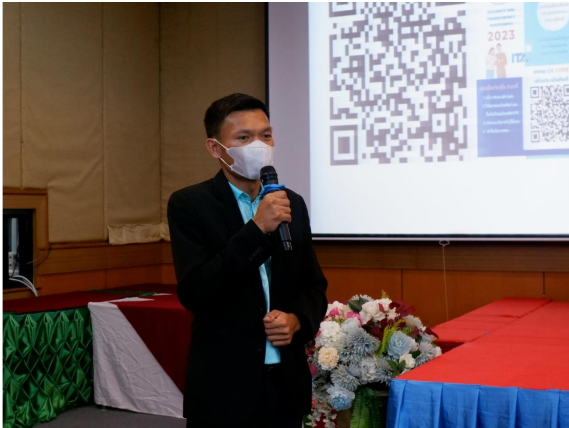
ประธานกล่าวเปิดงาน และเชิญวิทยากรดำเนินรายการการอบรม