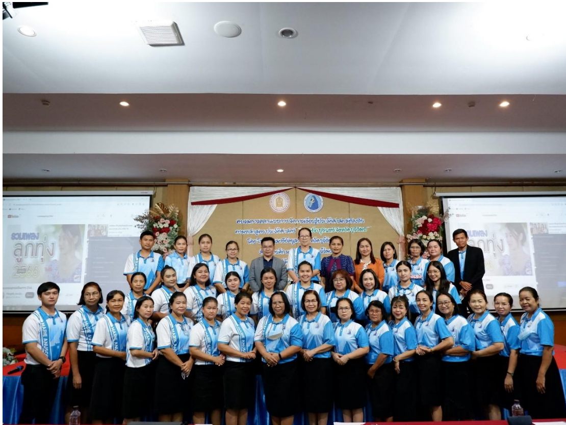
ถ่ายภาพวิทยากรและคุณครูผู้สอนในรายวิชาประวัติศาสตร์ โรงเรียนมารีย์อนุสรณ์