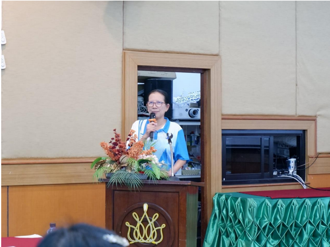
ประธานกล่าวเปิดงาน และเชิญวิทยากรดำเนินรายการการอบรม