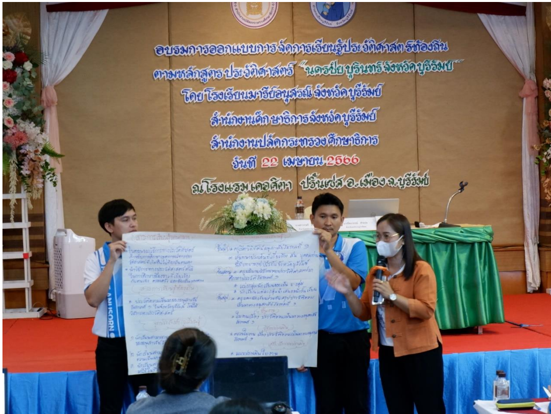
นำเสนองแผนท้องถิ่นของแต่ละสายชั้น เพื่อให้คุณครูท่านอื่นได้เพิ่มเติมให้แผนสมบูรณ์ยิ่งขึ้น