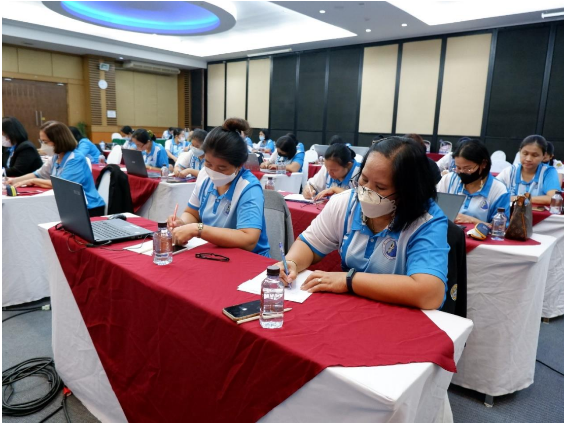
คุณครูทุกท่านมีความตั้งใจในการอบรมหลักสูตรประวัติศาสตร์นครชัยบุรีนทร์