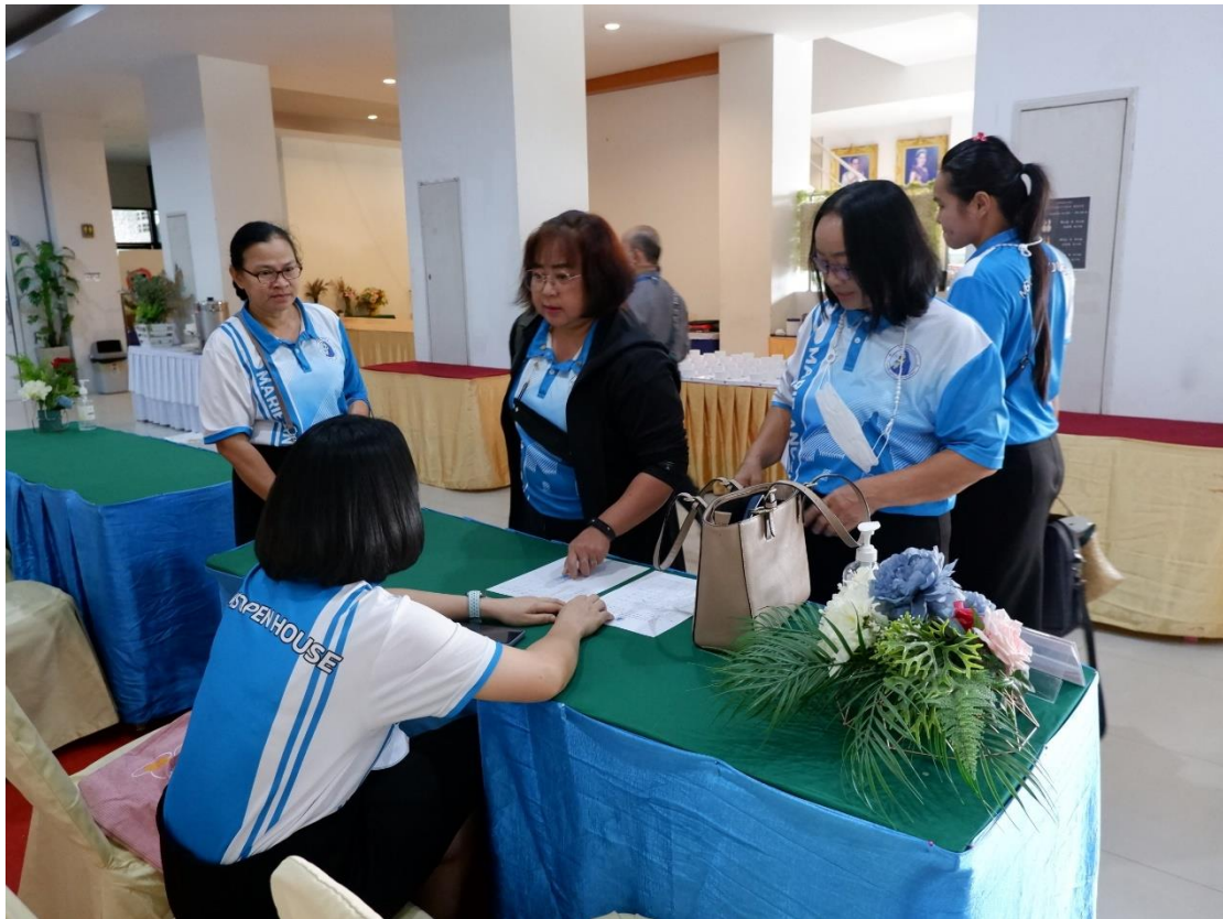
รับลงทะเบียน คุณครูที่เข้ารับการอบรม