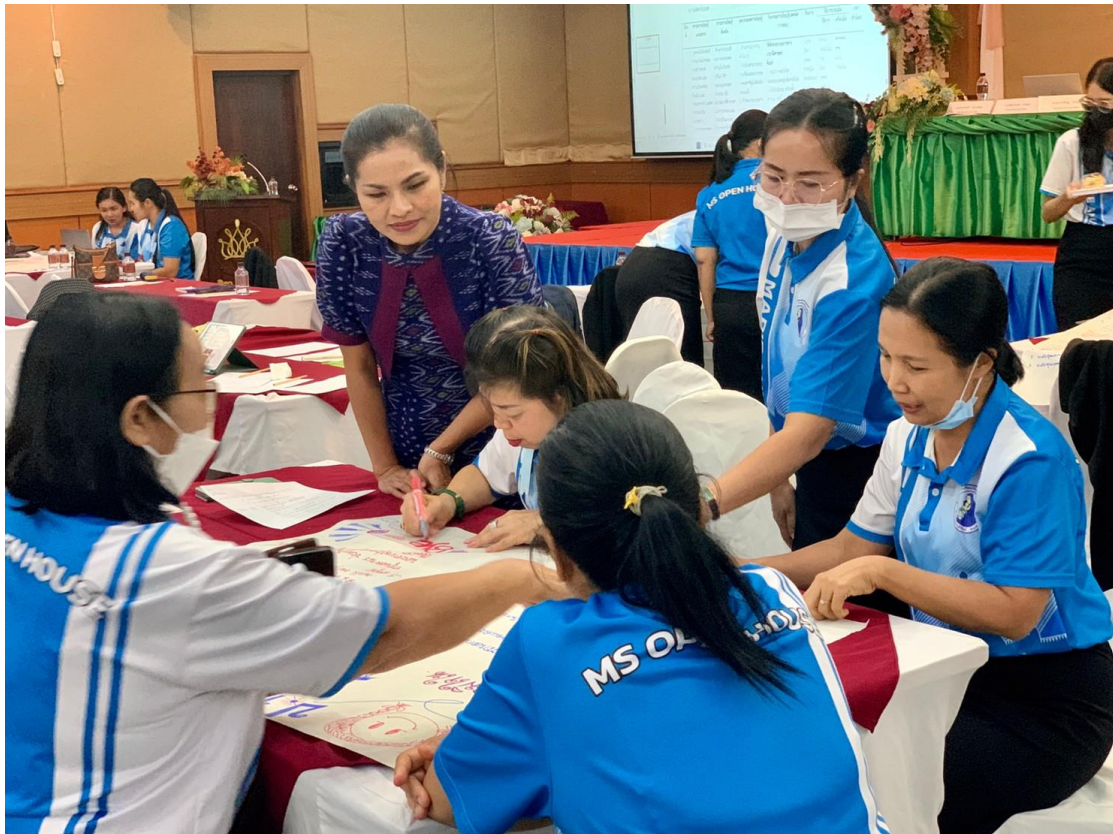
คุณครูร่วมกันเขียนโครงร่างของแผนท้องถิ่นในสายชั้นของตนเอง