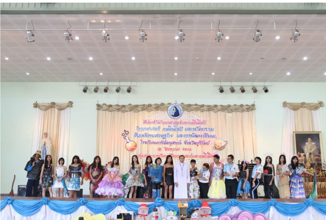
การแสดงทางวิทยาศาสตร์ ของนักเรียน