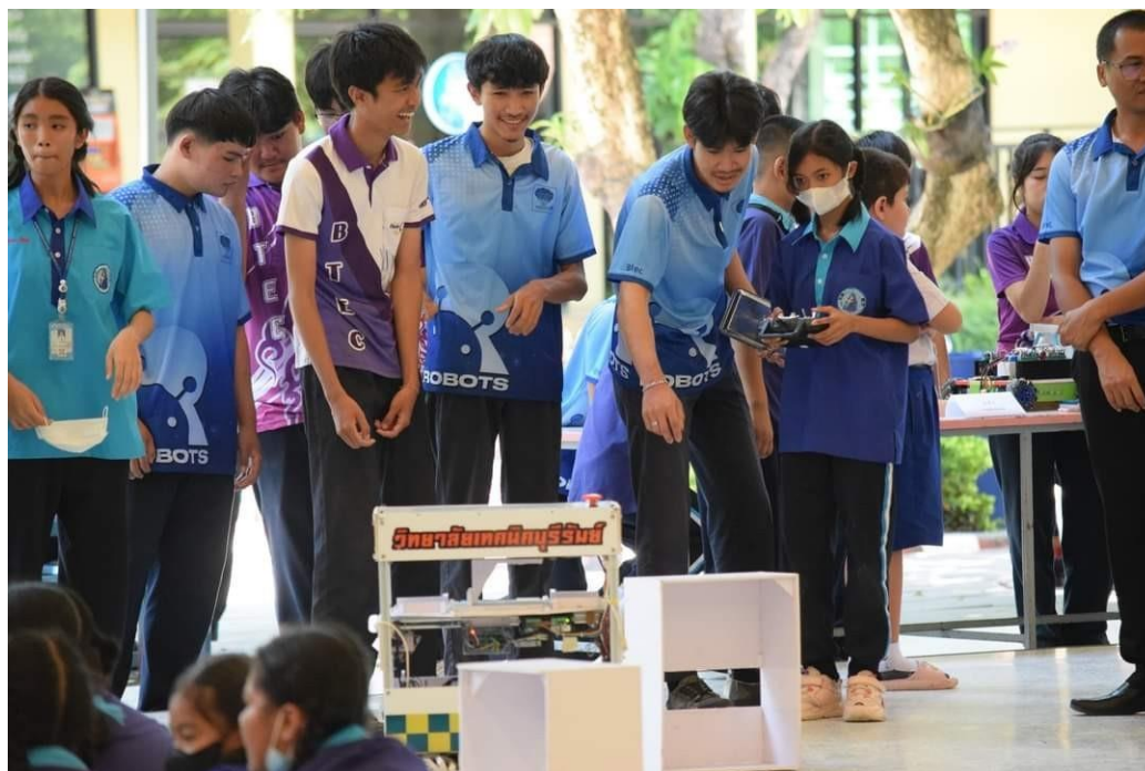
นักเรียนร่วมฐานกิจกรรมหุ่นยนต์