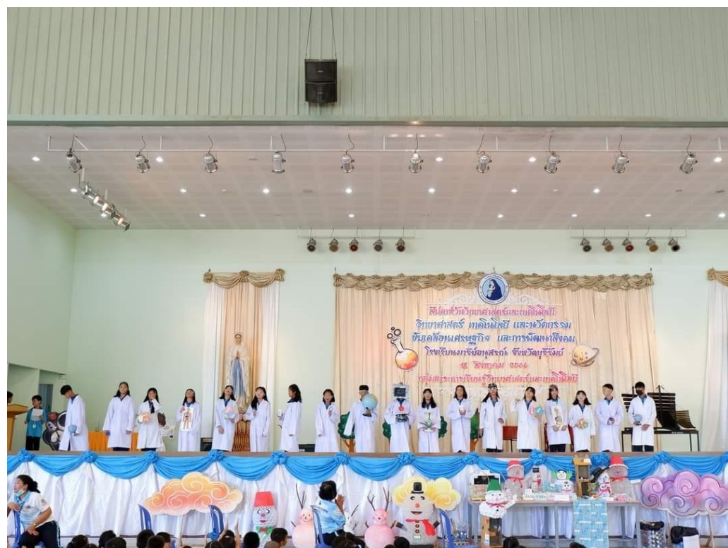
การแสดงในพิธีเปิด สัปดาห์วันวิทยาศาสตร์