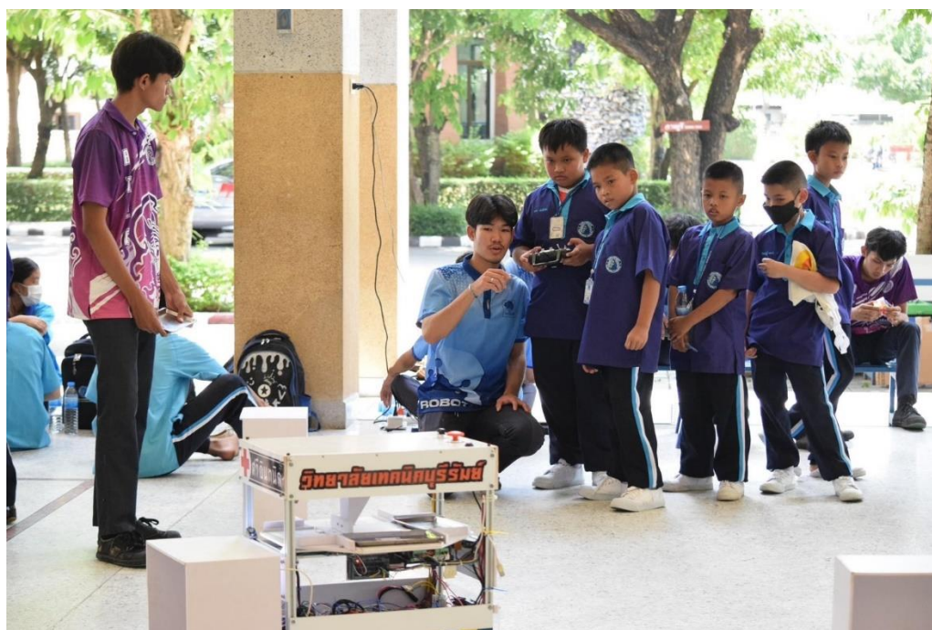
นักเรียนร่วมฐานกิจกรรมหุ่นยนต์