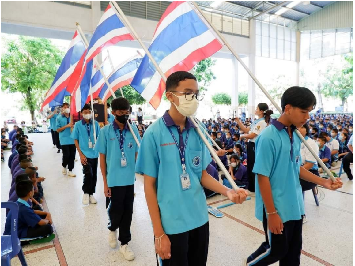
พิธีเปิด สัปดาห์วันวิทยาศาสตร์