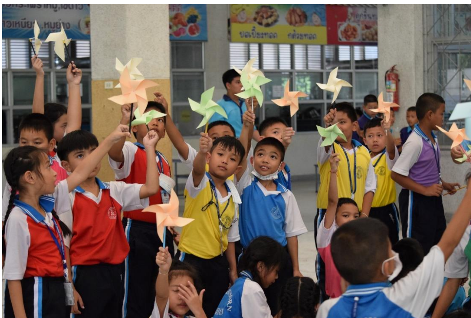
นักเรียนร่วมฐานกิจกรรมสัปดาห์วันวิทยาศาสตร์ อย่างมีความสุข