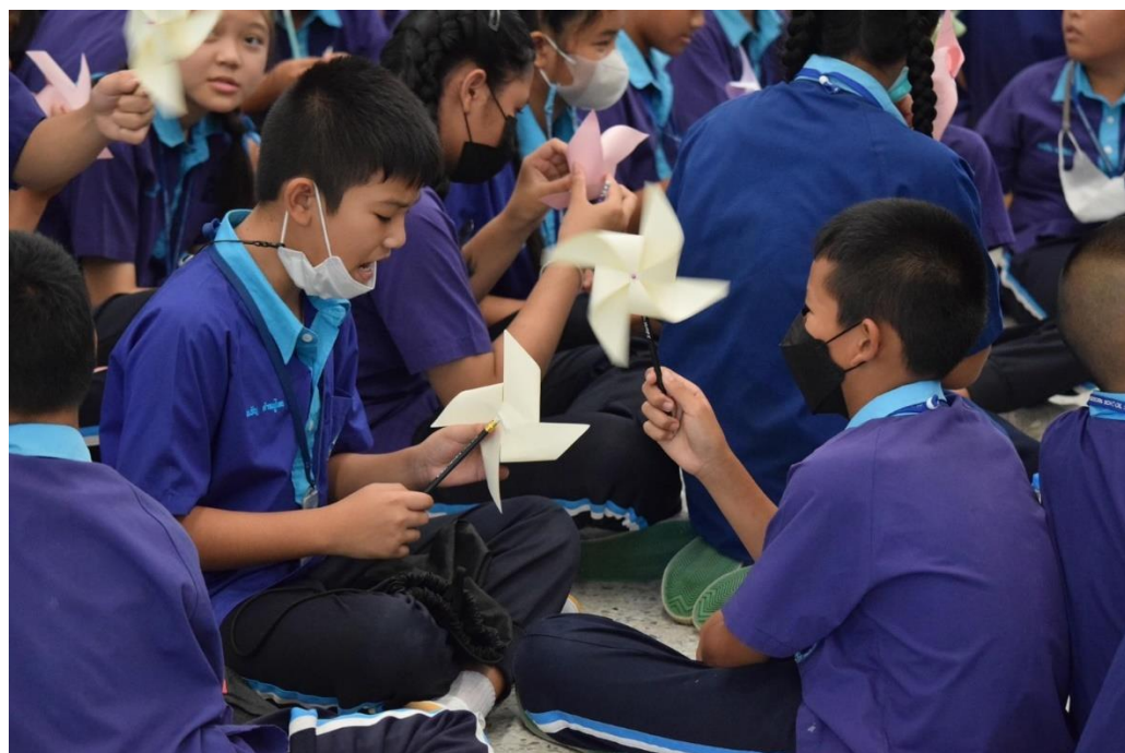
นักเรียนร่วมฐานกิจกรรมกล้อ่งจุลทรรศน์