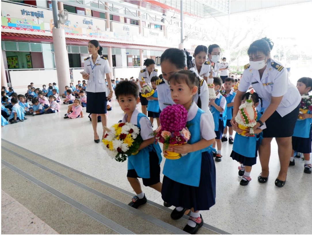
กิจกรรมวันไหว้ครู ตัวแทนถือพานไหว้ครูนักเรียนชั้นอนุบาล 1