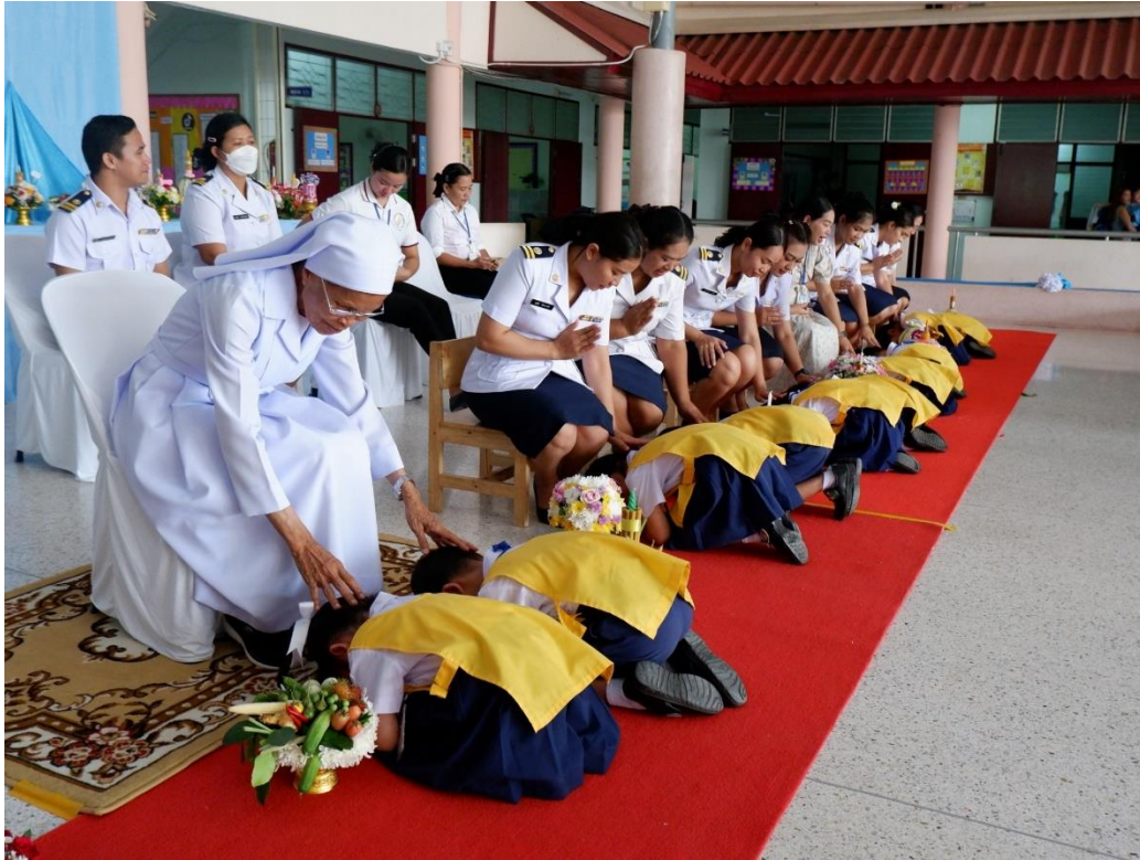
กิจกรรมวันไหว้ครู ตัวแทนถือพานไหว้ครูนักเรียนชั้นอนุบาล 3