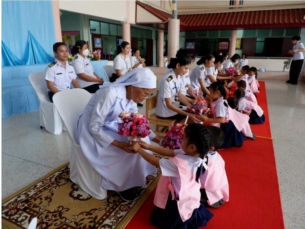
กิจกรรมวันไหว้ครู ตัวแทนถือพานไหว้ครูนักเรียนชั้นอนุบาล 2