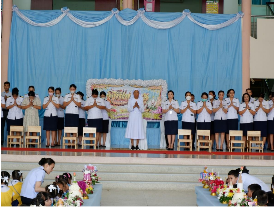
กิจกรรมวันไหว้ครู ท่านประธานกล่าวและคณะครูเปิดงานวันไหว้ครู