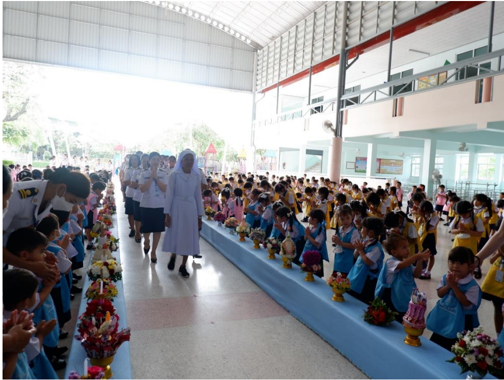
กิจกรรมวันไหว้ครู ท่านประธานและคณะครูเดินเข้าสู่โถงเพื่อเปิดงานวันไหว้ครู