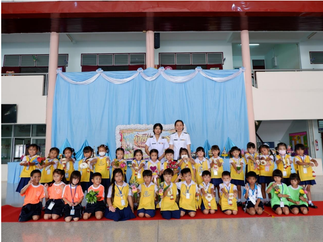
กิจกรรมวันไหว้ครู ครูและนักเรียนถ่ายภาพร่วมกัน