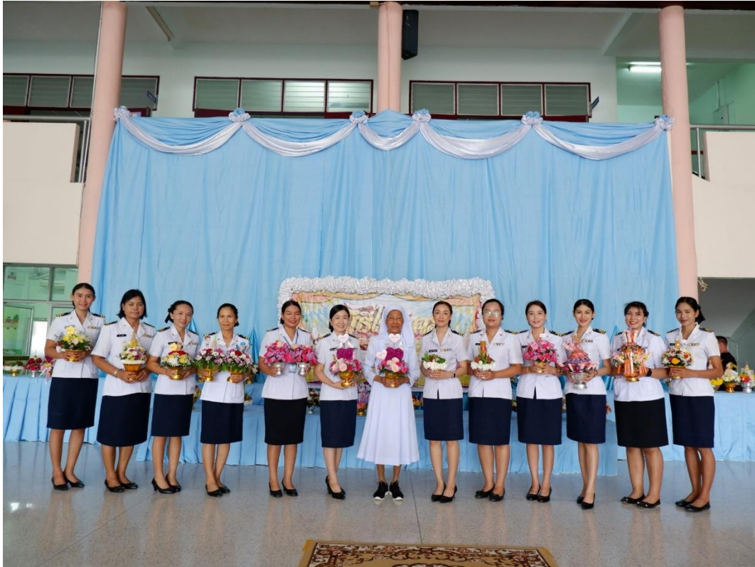
กิจกรรมวันไหว้ครู ท่านประธานและคณะครูถ่ายภาพร่วมกัน