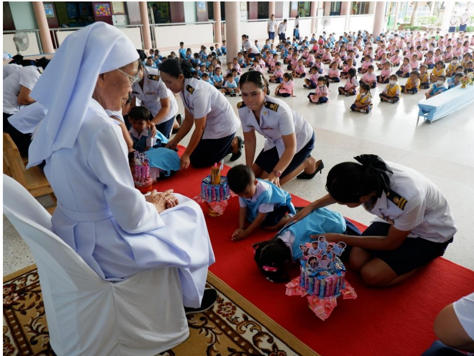
กิจกรรมวันไหว้ครู ตัวแทนถือพานไหว้ครูนักเรียนชั้นเตรียมอนุบาล