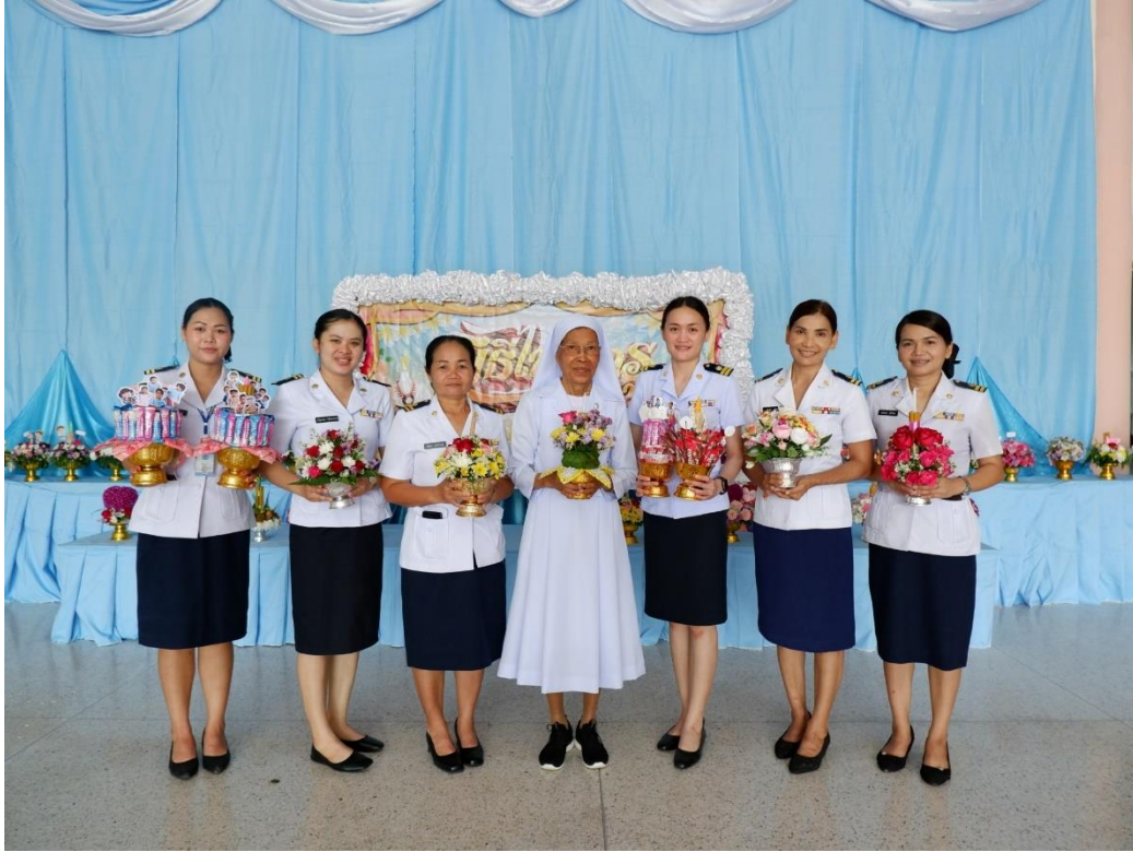
กิจกรรมวันไหว้ครู ท่านประธานและคณะครูถ่ายภาพร่วมกัน