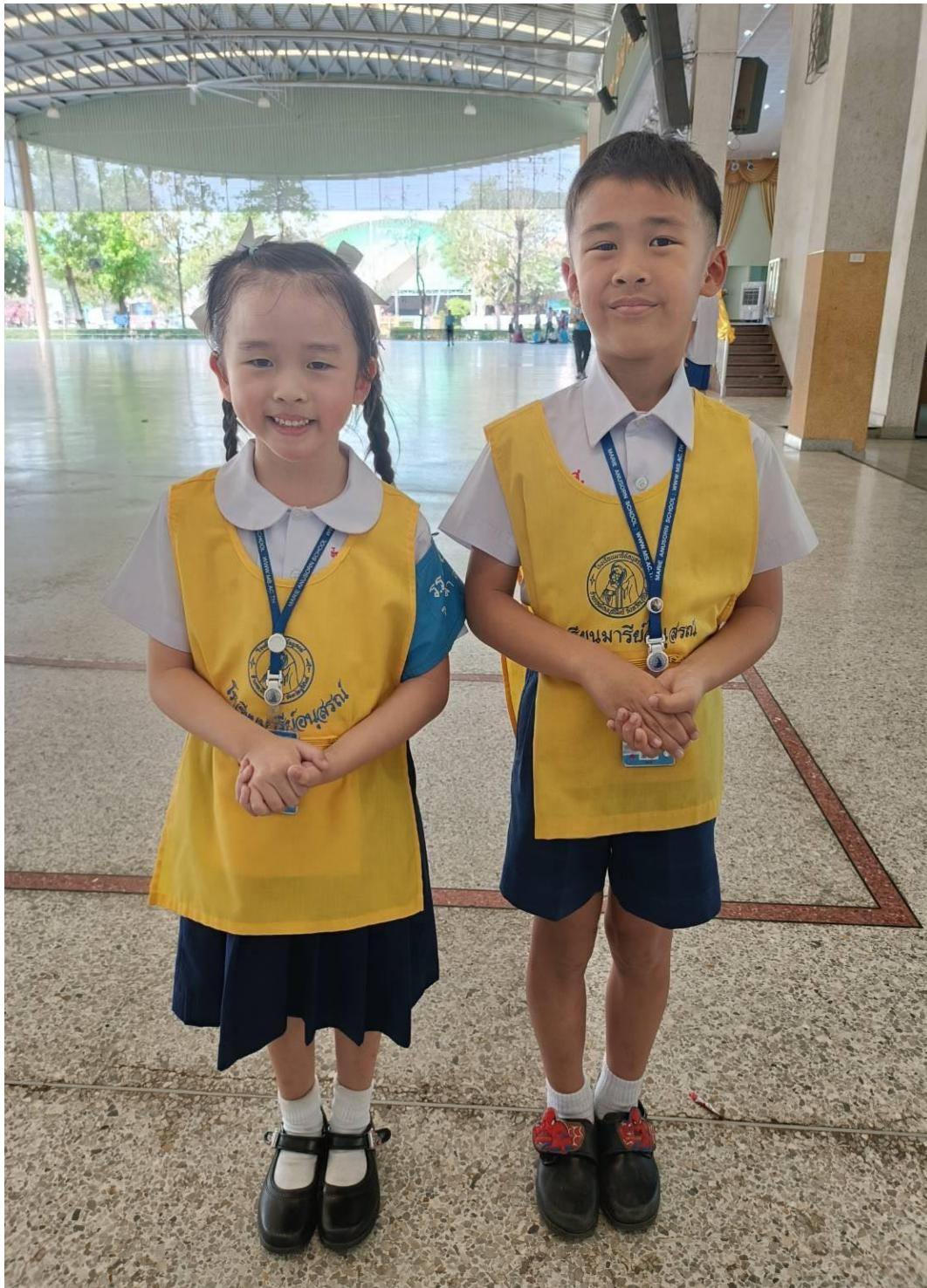
การแต่งกายชุดนักเรียน ระดับชั้นอนุบาล 3