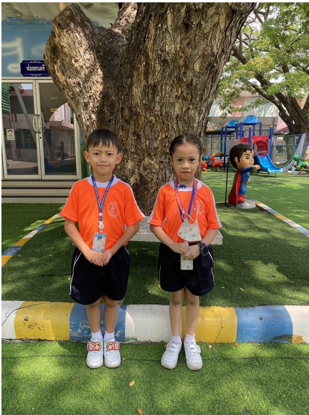
การแต่งกายชุดพลະ ระดับชั้นอนุบาล 3