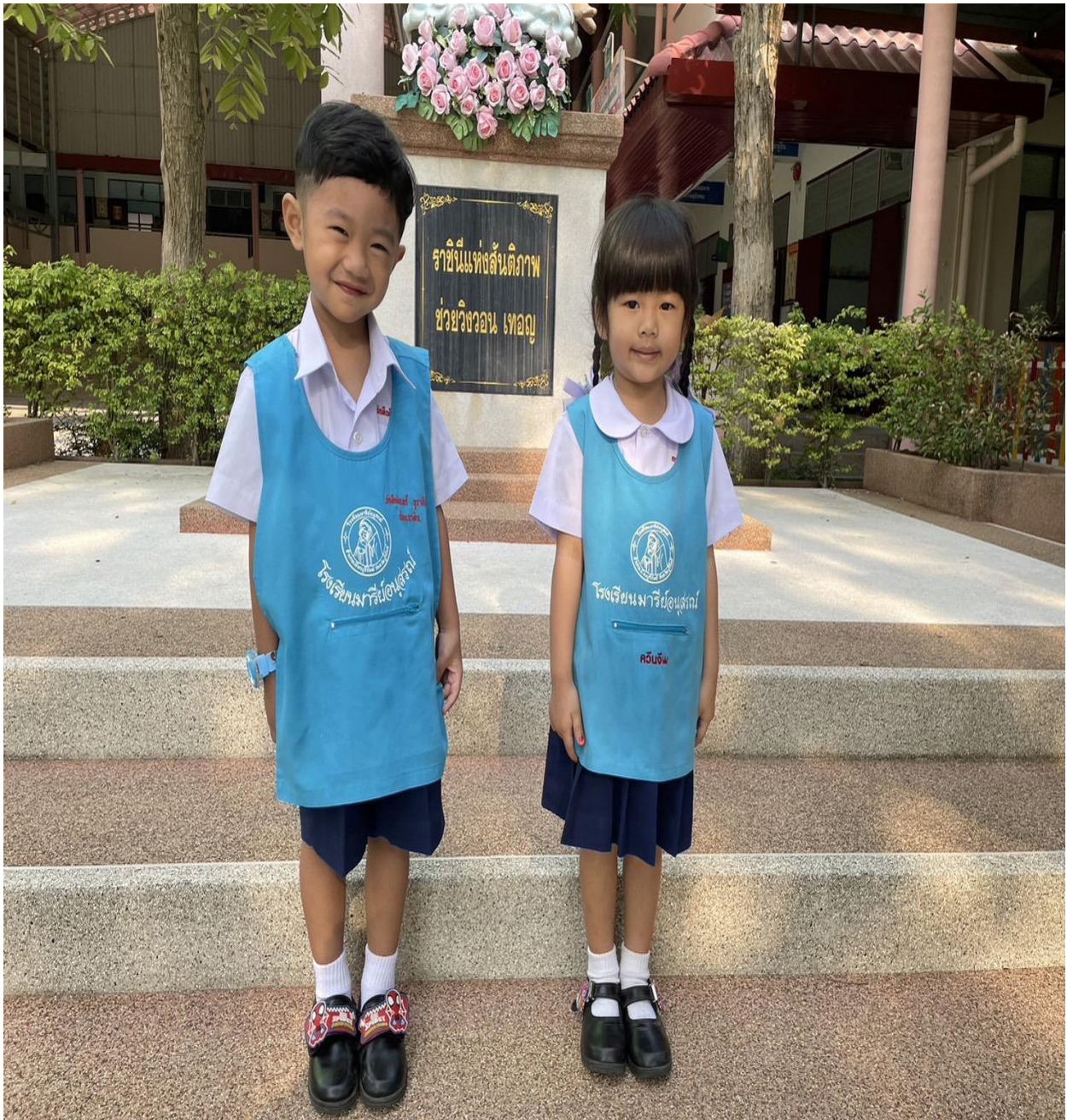
การแต่งกายชุดนักเรียน ระดับชั้นอนุบาล 1