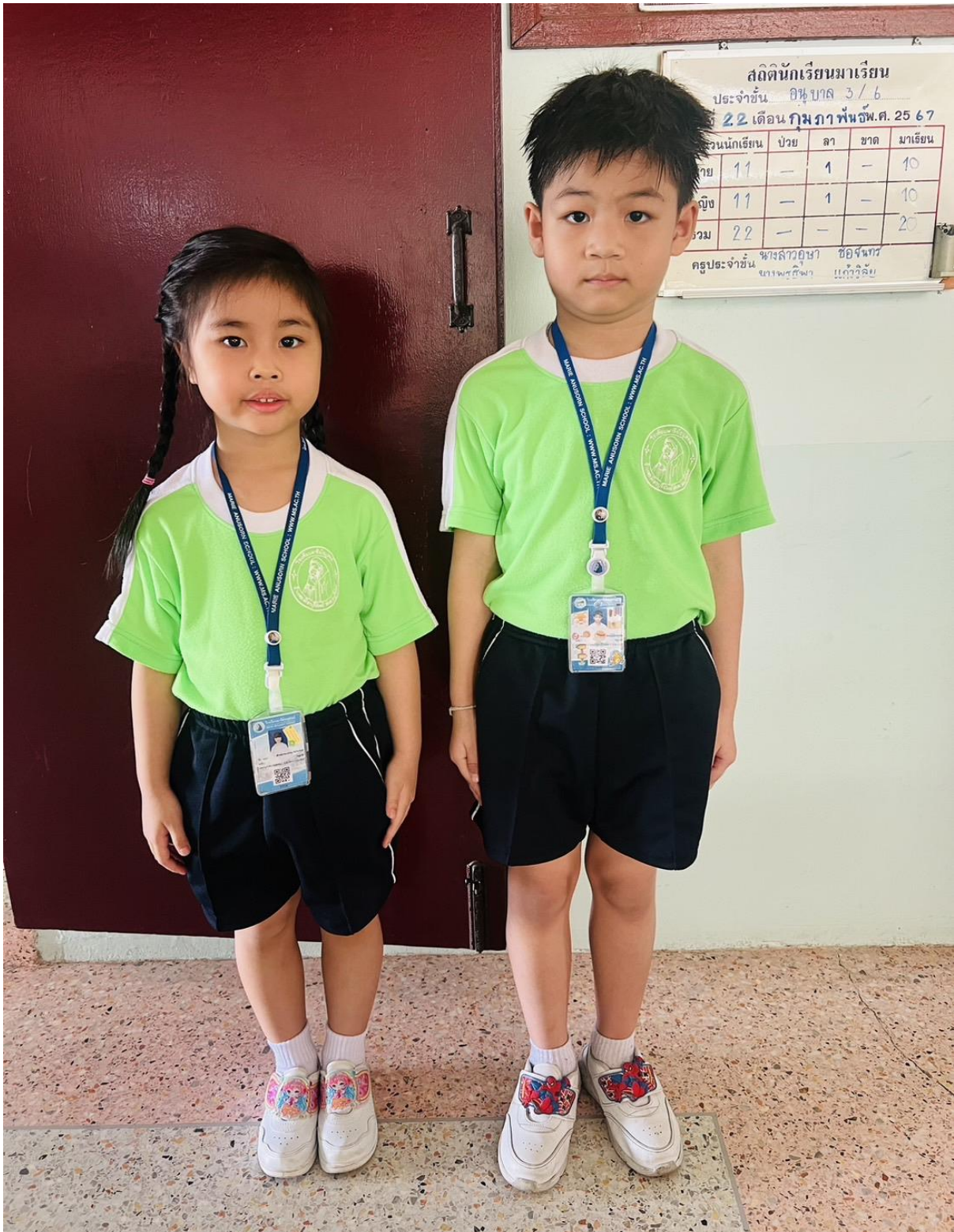
การแต่งกายชุดพลະ ระดับชั้นอนุบาล 2