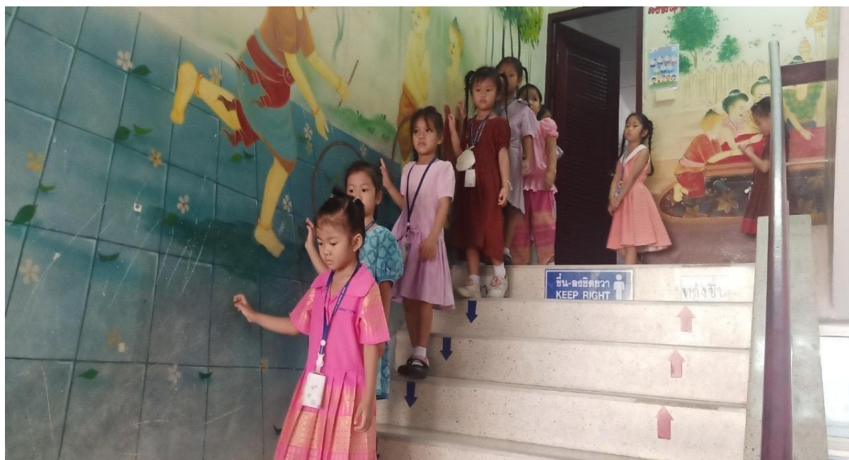
นักเรียนเดินลงบันไดอย่างเป็นระเบียบ (เดินลงชิดขวา)