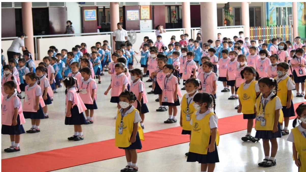
ฝึกระเบียบวินัยการอดทนหน้าเสาธง