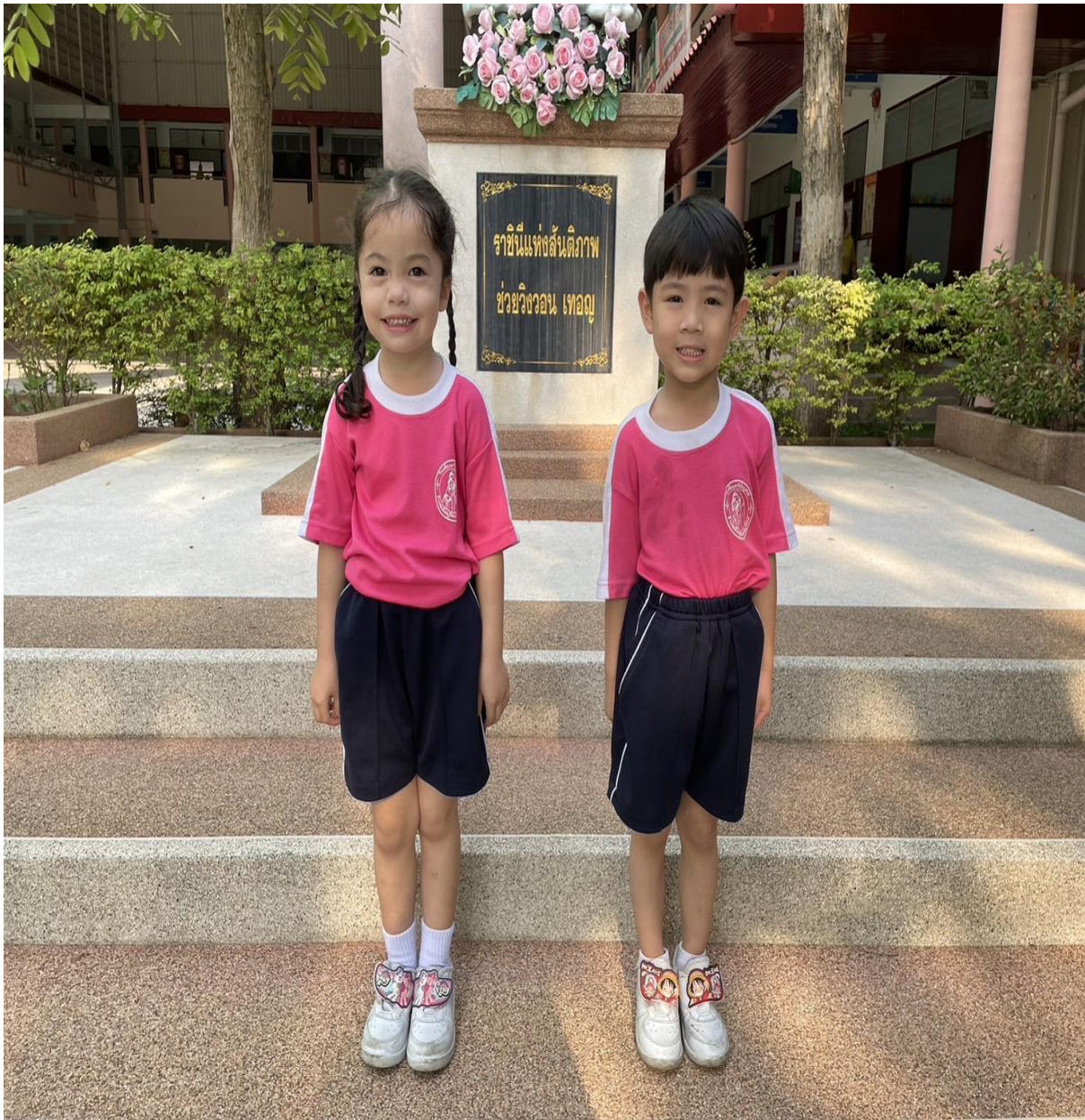
การแต่งกายชุดพลະ ระดับชั้นอนุบาล 1