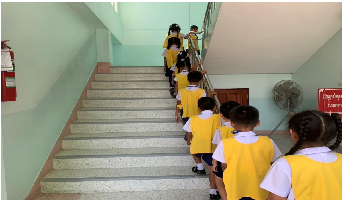
นักเรียนเดินขึ้นบันไดอย่างเป็นระเบียบ (เดินขึ้นชิดขวา)