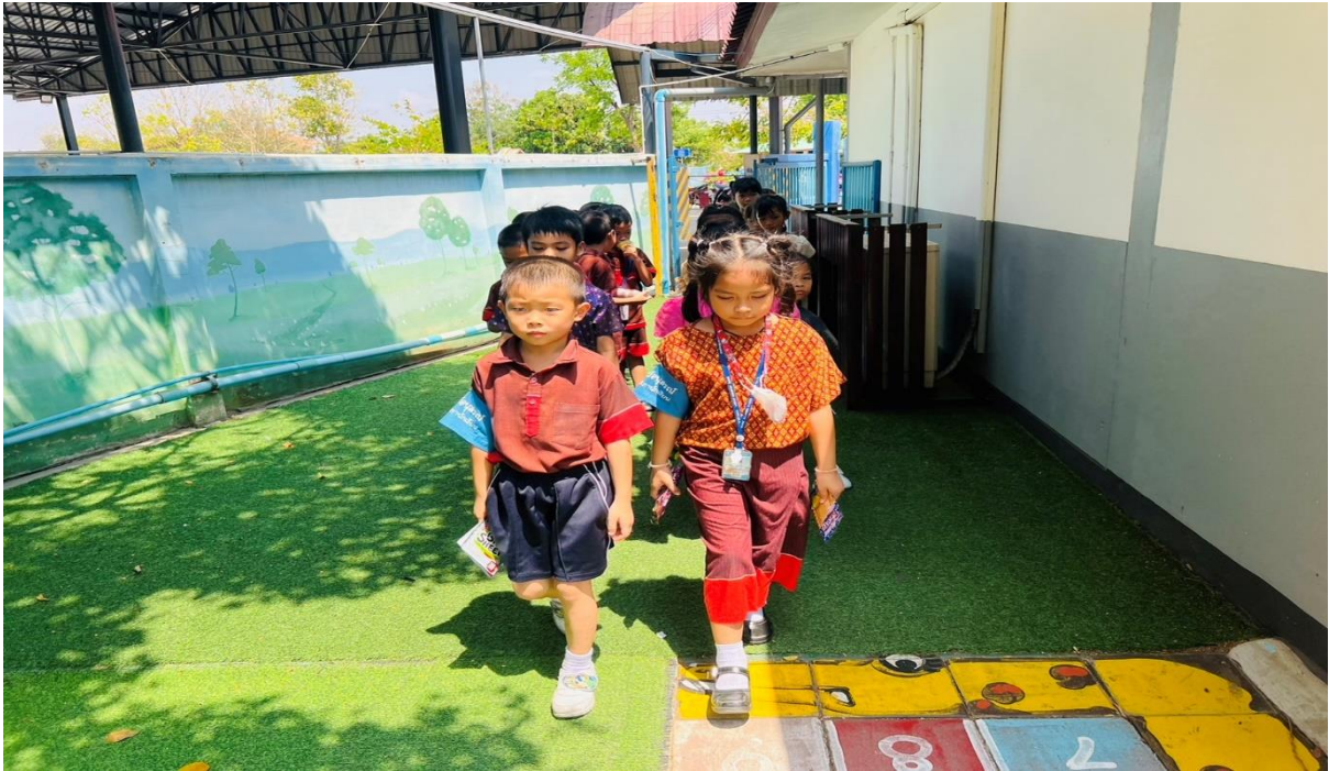
จัดระเบียบแถวฝึกความมีวินัย