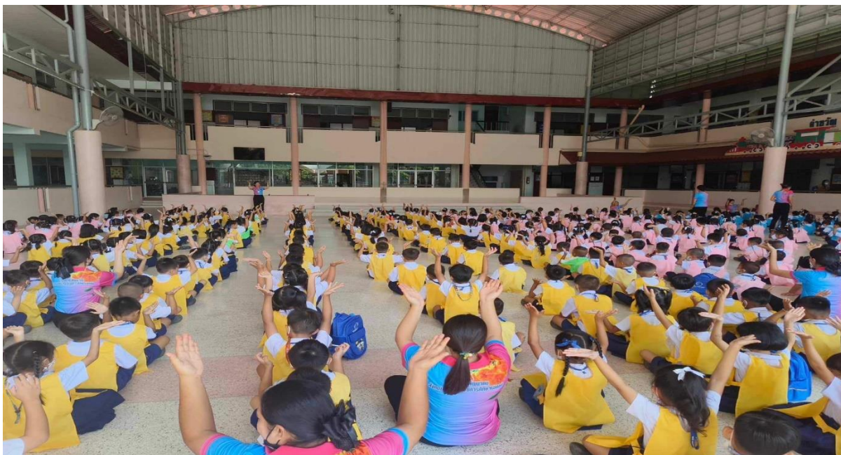
ฝึกระเบียบวินัยการอดทนหน้าเสาธง