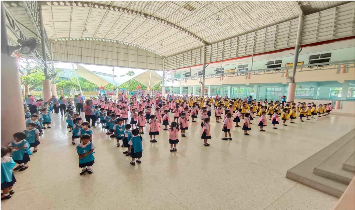
การเข้าแถวก่อนทำกิจกรรมหน้าเสาธง