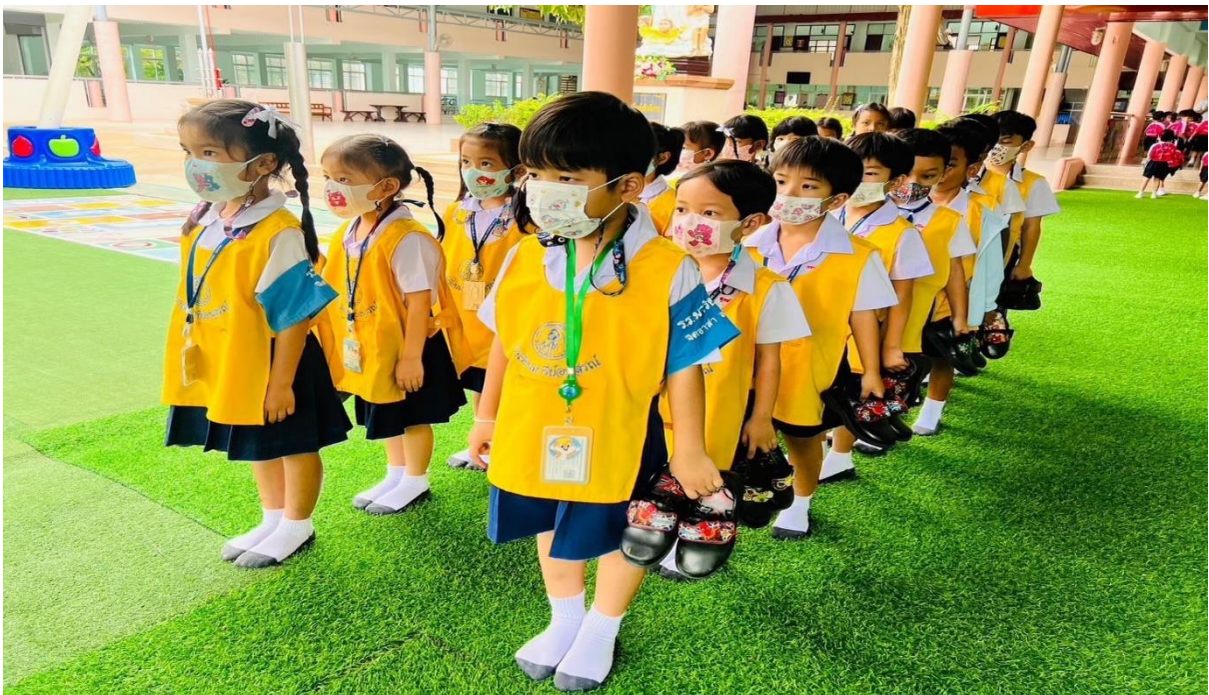
จัดระเบียบแถวฝึกความมีวินัย