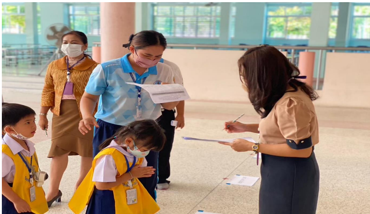
เด็กๆรู้จักไว้เมื่อพบเจอผู้ใหญ่