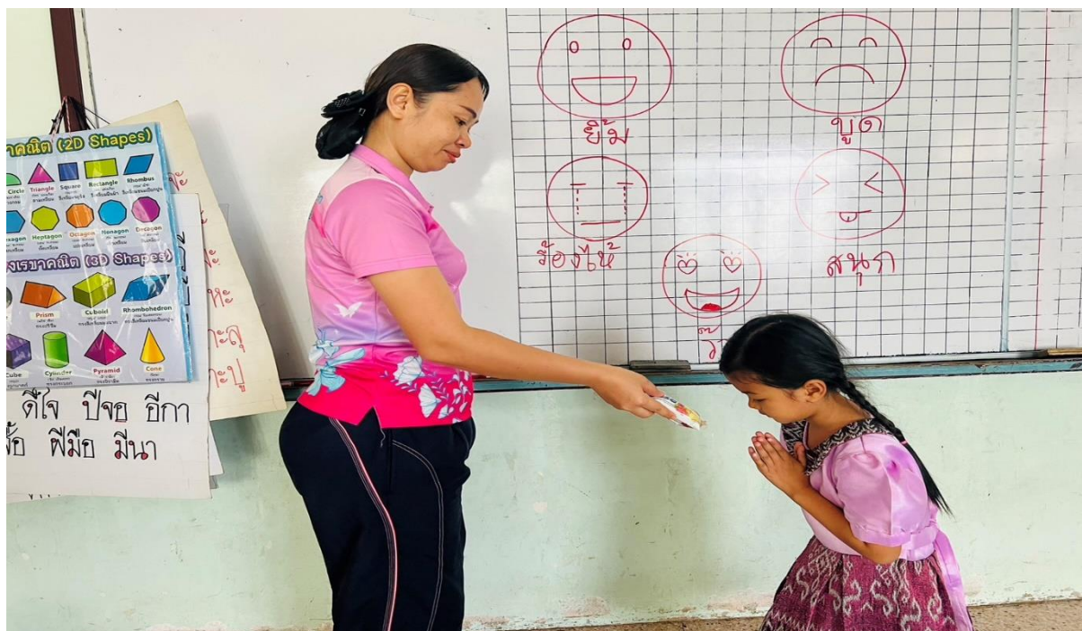
เด็กๆรู้จักไว้ขอบคุณผู้ใหญ่เมื่อผู้ใหญ่ให้ของ