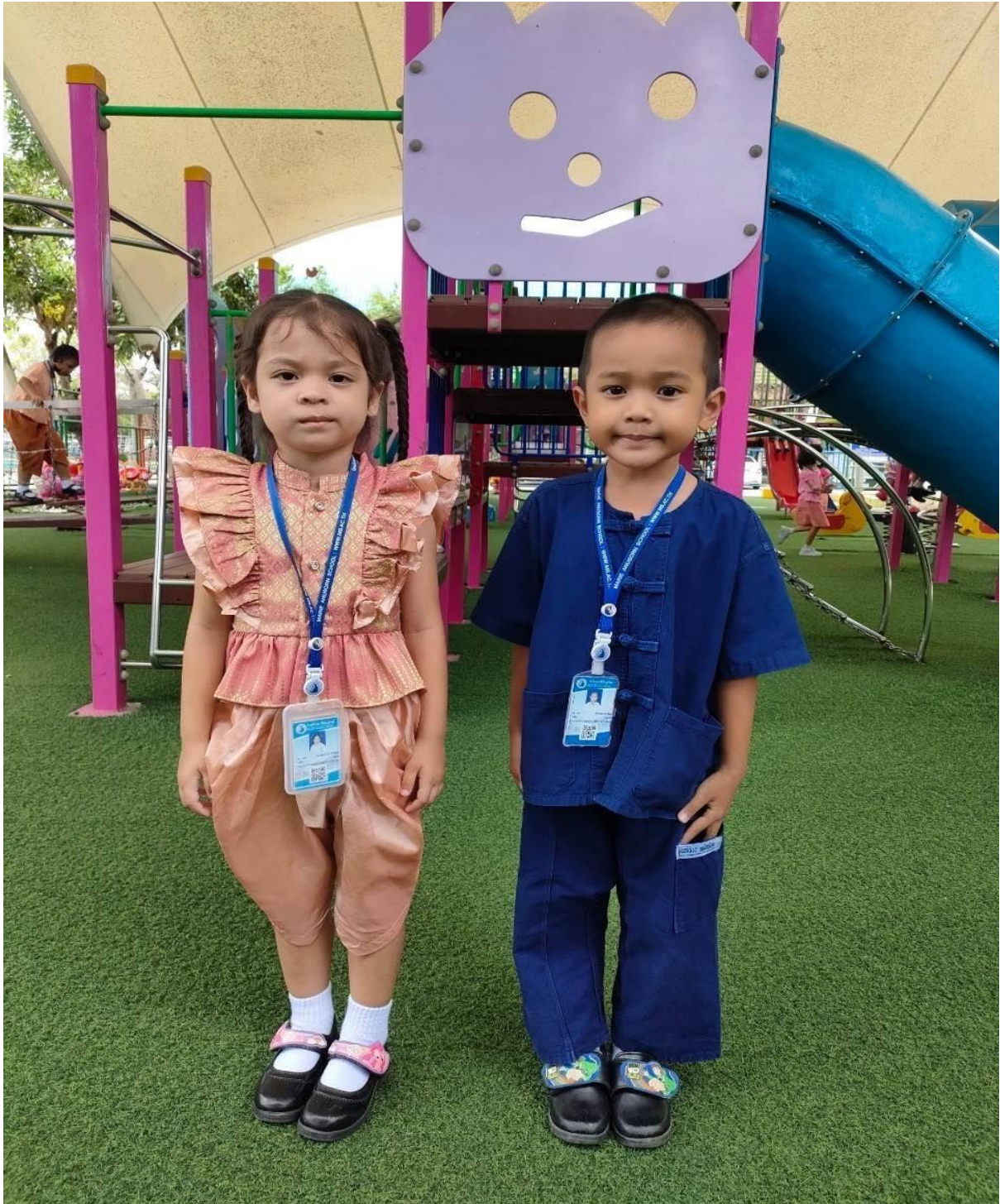
การแต่งกายชุดผ้าไทย(ทุกวันอังคาร) ของนักเรียนระดับชั้นอนุบาล 1-3