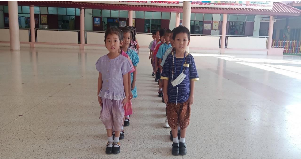
ระเบียบการเข้าแถวเข้าออกห้องเรียน