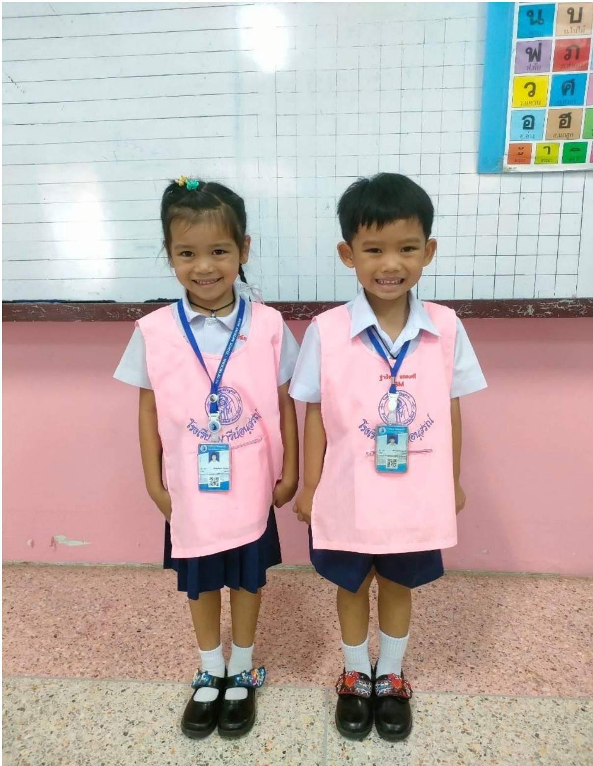
การแต่งกายชุดนักเรียน ระดับชั้นอนุบาล 2