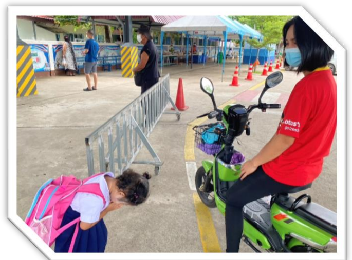
ไหว้เมื่อผู้ปกครองมาส่ง