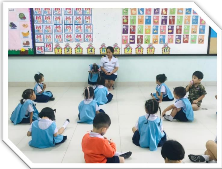
เด็กๆฝึกไหว้หน้าห้อง โครงการ วัยใส ไหว้สวย