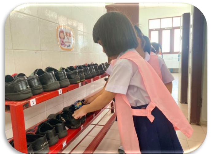
โครงการ รองเท้าเข้าที่ดูดีสวยงาม