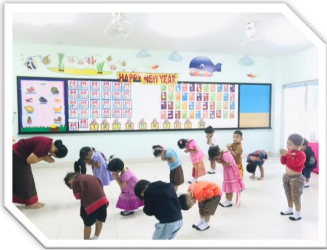
ครูสาธิต และเด็กๆลงมือปฏิบัติ