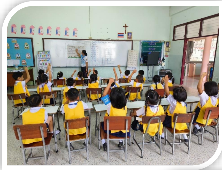
โครงการ กระเป๋าเข้าตู้ หนูหนูทำได้