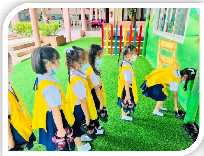
โครงการรองเท้าที่ เด็กดีทำได้