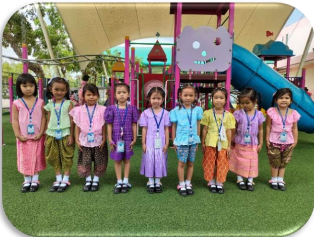
โครงการ แต่งกายดูดี หนูน้อยมารีย์ทำได้