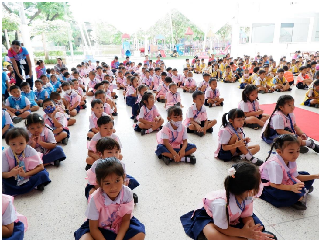
เด็กๆ ตื่นเต้น ตื่นตา และมีความสุขที่ได้รับชมโชว์พิเศษจากคณะครูปฐมวัย