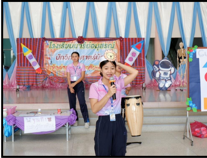
วิทยากรแนะนำกิจกรรม การประดิษฐ์ที่คาดศีรษะ