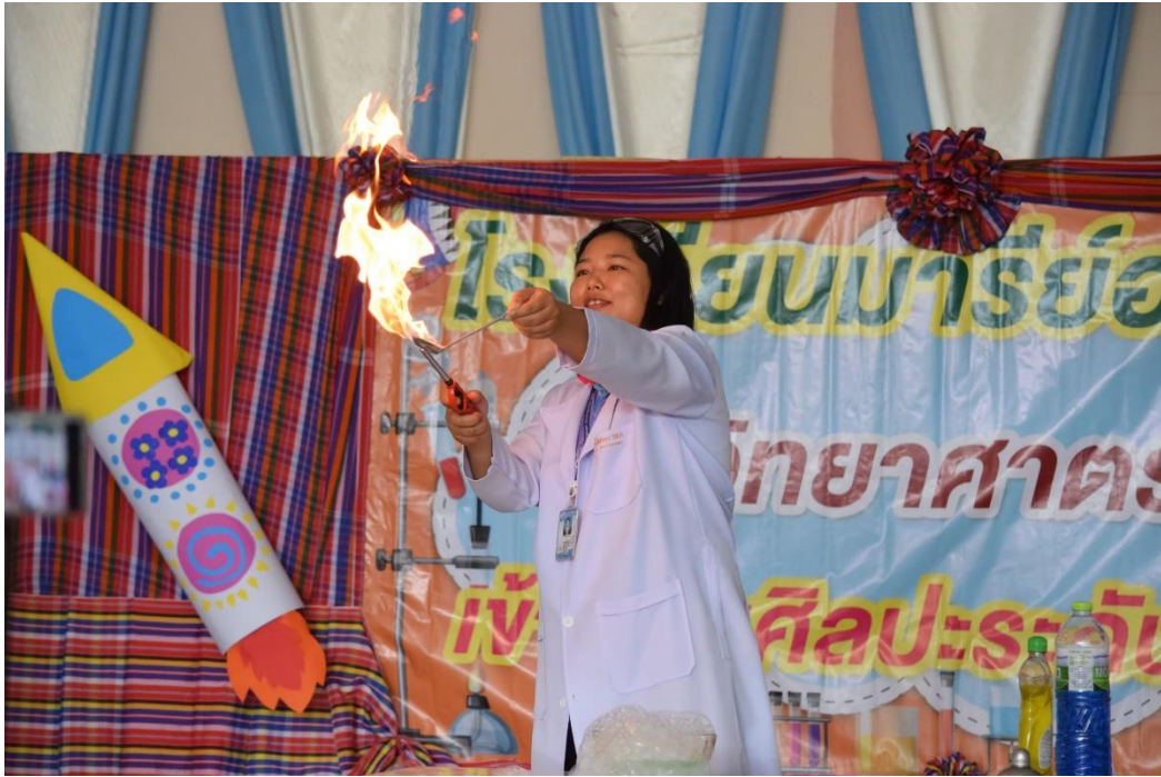
การแสดงโชว์การทดลองวิทยาศาสตร์ จากคณะครูระดับปฐมวัย