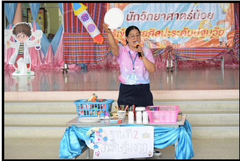
วิทยากรแนะนำกิจกรรม การประดิษฐ์มงกุฎงานกระดาษ