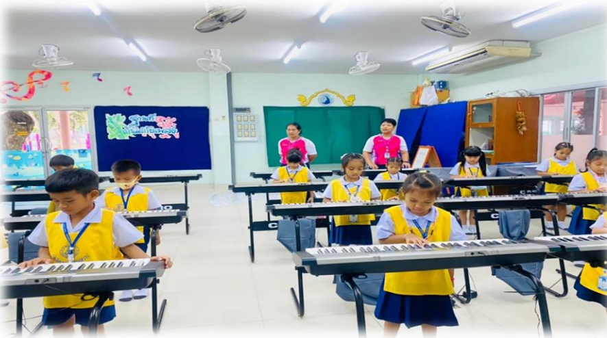
กิจกรรมเสริมหลักสูตร การจัดการเรียน การสอนดนตรีเพื่อให้เด็กมีทักษะพื้นฐาน ทางด้านดนตรี