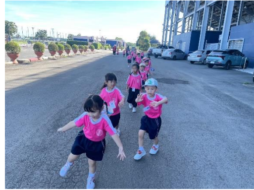
เด็กๆนักเรียนระดับอนุบาล 1 ท่องเที่ยวที่สนามช้างอารีน่า