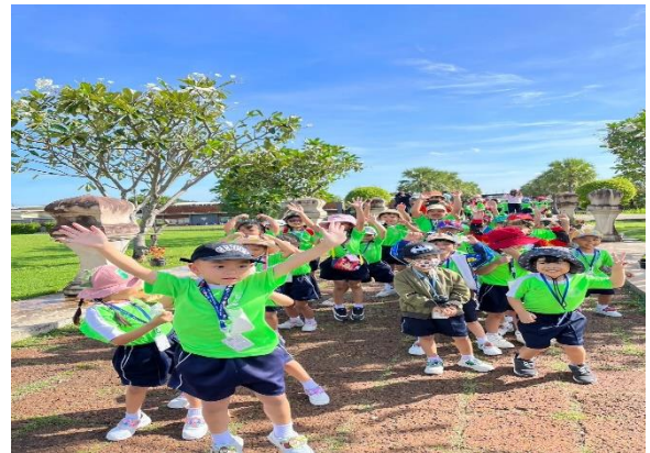
ความน่ารักสดใสของเด็กๆระดับอนุบาล2 ที่ได้มาทำกิจกรรมร่วมกันกับเพื่อนๆ