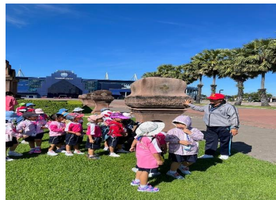
เด็กๆเรียนรู้เกี่ยวกับสถานที่แข่งกีฬา คือสนามฟุตบอล และสนามแข่งรถ