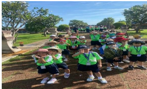
ความสุขที่เด็กๆได้เรียนรู้และความสนุกสนานกับเพื่อนๆในการทัศนศึกษา