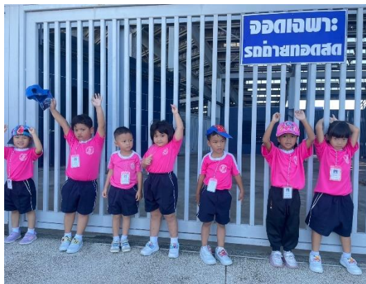
ความรักและความแจ่มใสของเด็กๆที่ได้ทำกิจกรรมร่วมกันกับเพื่อนๆ