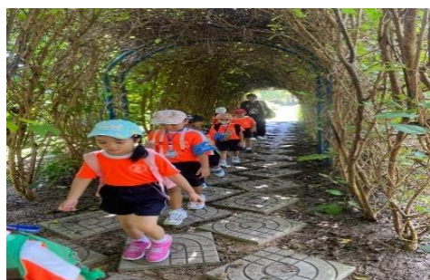
เด็กอนุบาล 3 เด็กๆมาทัศนศึกษาที่สนามช้างอารีนา เพื่อเรียนรู้เกี่ยวกับต้นไม้ พันธุ์ไม้