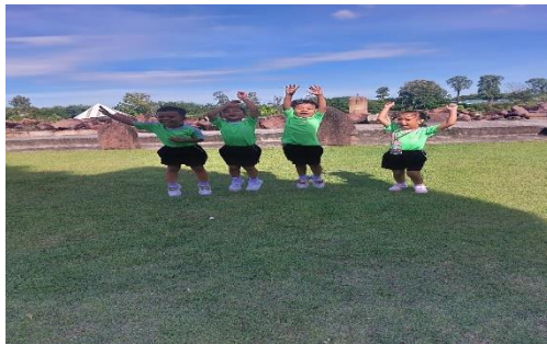
เด็กๆตื่นเต้นและสนใจปราสาทพนมรุ้งจำลองที่สนามช้าง