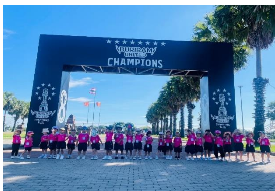
ภาพกิจกรรมทัศนศึกษาระดับอนุบาล2