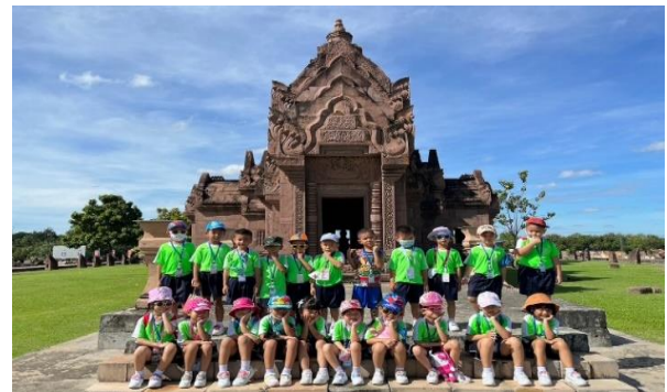
เรียนรู้ชื่อ และความเป็นมาของปราสาทพนมรุ้งแบบง่ายๆที่เด็กๆเข้าใจได้ง่ายสำหรับอนุบาล