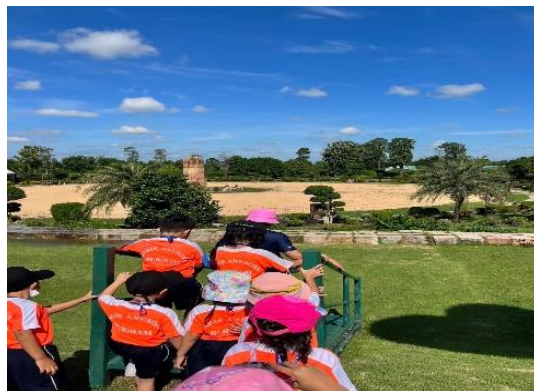
เด็กๆชื่นชอบในการมาทัศนศึกษาในครั้งนี้กันมากเพราะได้รู้จักชื่อดต้นไม้ต่างๆร่วมกันกับเพื่อน