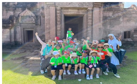
เด็กนักเรียนระดับชั้นอนุบาล2 ไปเรียนรู้นอกห้องเรียนเกี่ยวกับสถานที่ท่องเที่ยวจำลอง