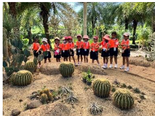
เรียนรู้ชื่อของต้นกระบองเพชรพันธุ์ต่างๆ ซึ่งมีรูปร่างที่แตกต่างกัน