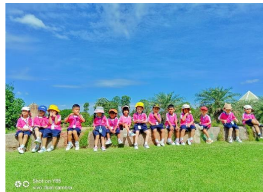
เด็กๆมีความสุข และสนุกสนานกับการท่องเที่ยวและได้เรียนรู้ไปพร้อมกัน