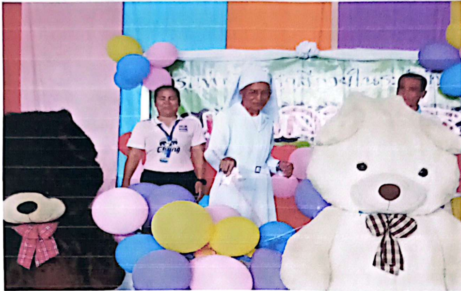
พิธีเปิดกีฬาสี