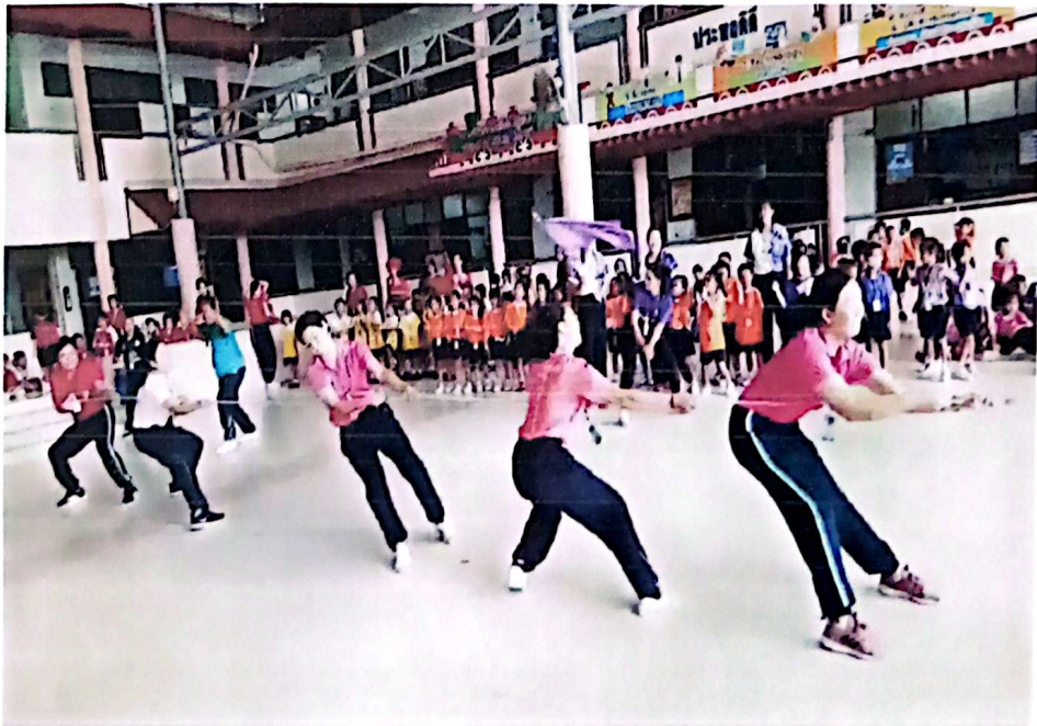
กีฬาชักคะเย่อกู สีชมพู