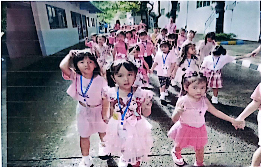
ขบวนตีชมพูนุ้ๆ