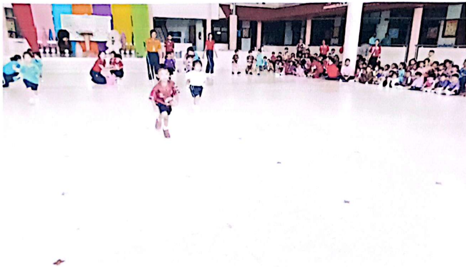
การแข่งขันกีฬาวิ่งเก็บลูกบอล ระดับ เตรียมอนุบาล ( ชาย )