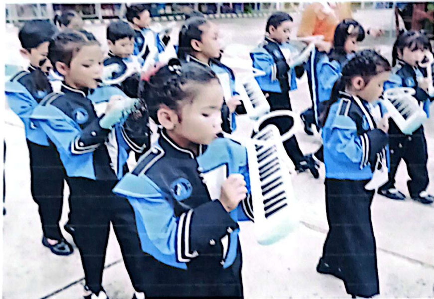
กีฬาเป็นอาชีพ เค้าคนพิเศษเป็นเธอ นะคะ