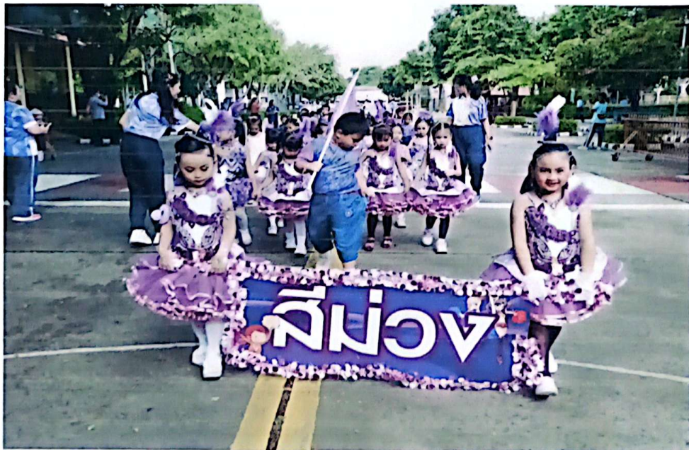
ขบวนพาเหรดสีม่อง