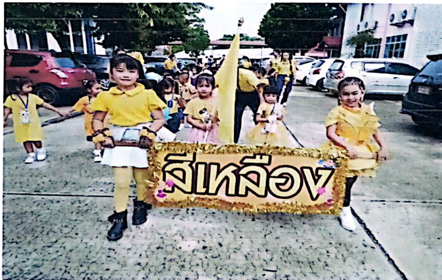
เดินขบวนพาเหรดสีเหลือง