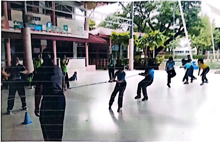
กีฬาชักคะเย่อกู สีฟ้า