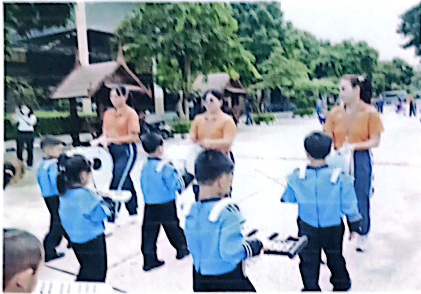
ขบวนลูรียงกลั่วน้อย