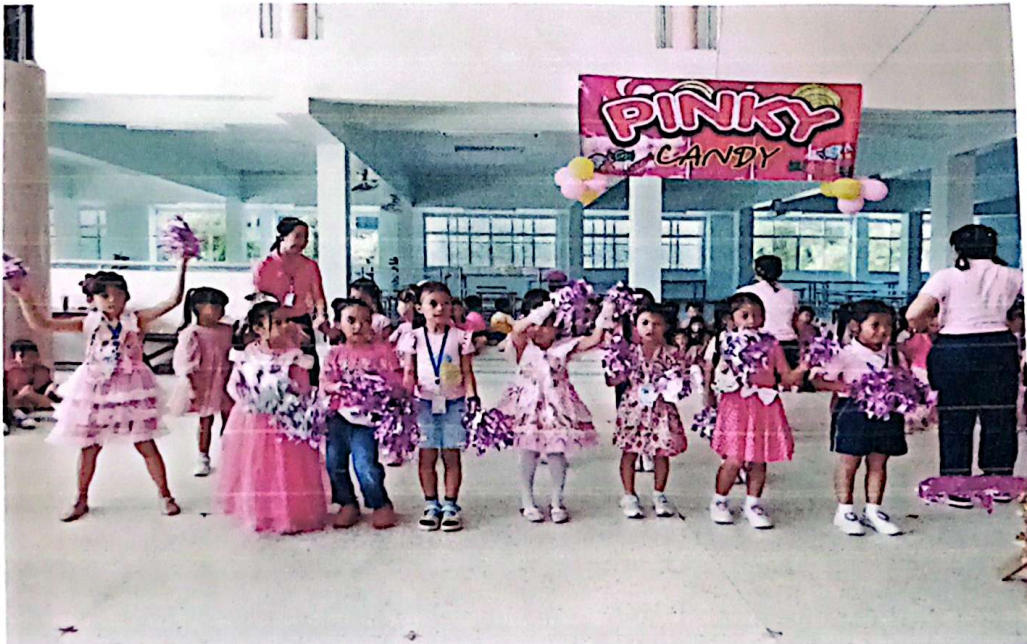
ลีดเดอร์ที่ชมพูสุ้ๆ