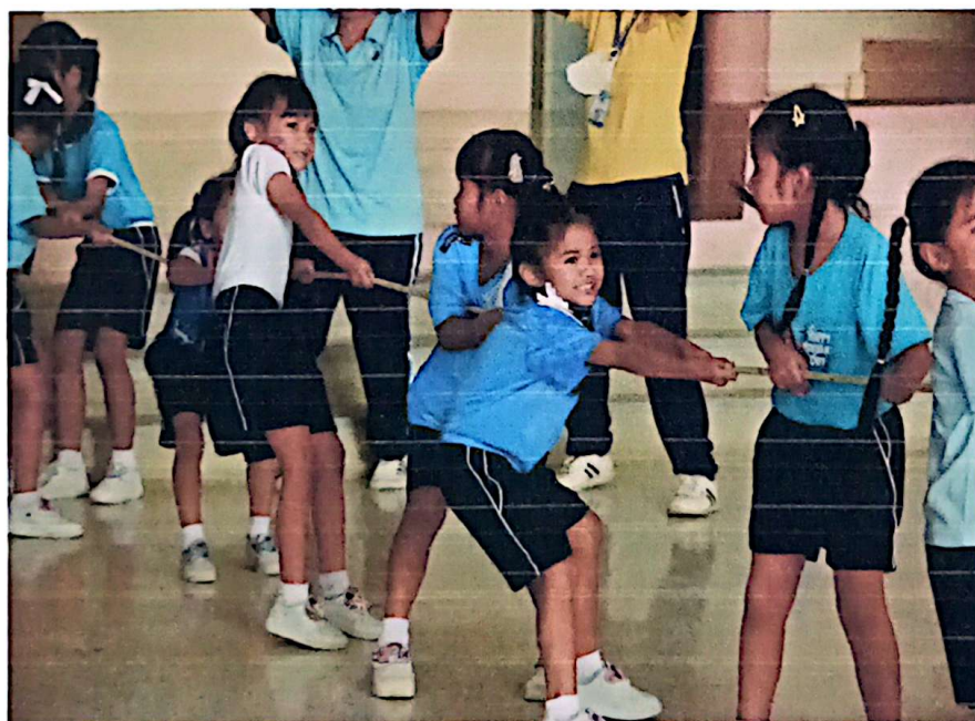
การแข่งขันกีฬาชักกะเย่อ หญิง ระดับอนุบาล 3