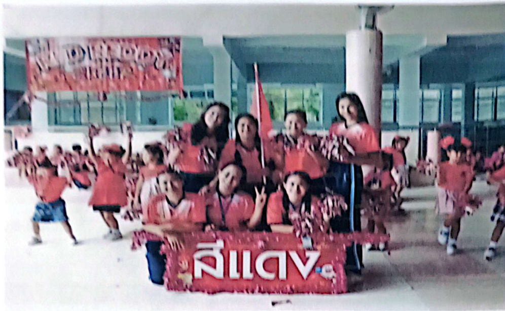
กองเชียร์สีแดงตุ๊กตา