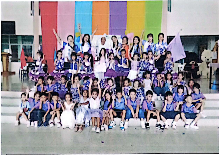
รางวัลชนะเลิศกองเชียร์ตีม่วง