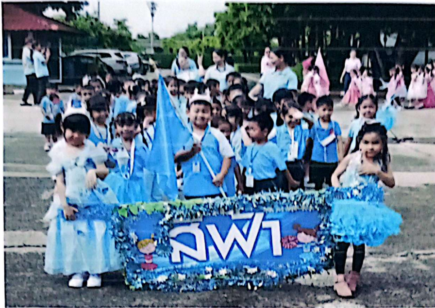
ขบวนพาเหรดกีฬา