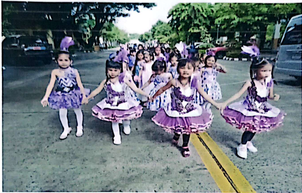
แค่ถือเคอร์ซีมีวงก็เพงแล้วปะ