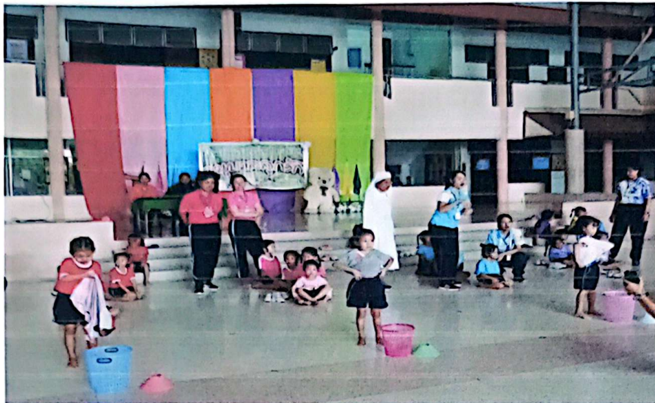
การแข่งขันกีฬาวิ่งเปลี่ยนเสื้อผ้า ระดับอนุบาล 2 (หญิง)