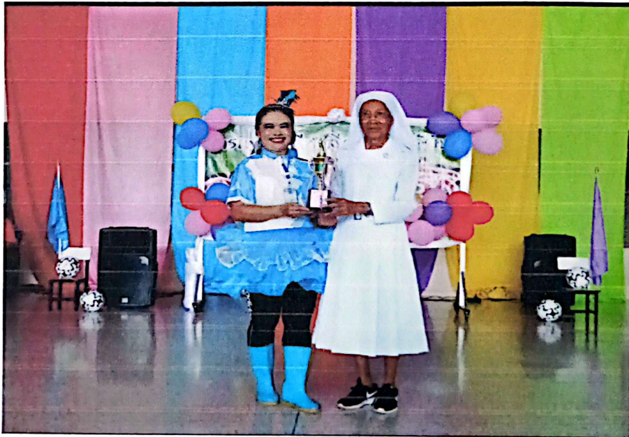
รางวัลการแต่งกายครูยอดเยี่ยม