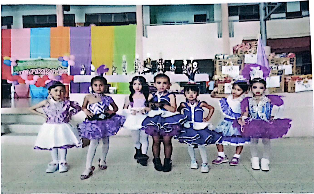
ที่เป็นเชียร์ลีดเดอร์เพราะอยากเชียร์สีม่วงคนเดียวจ้า