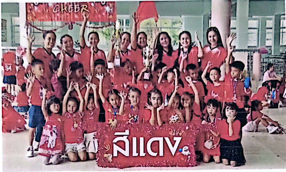
กองเชียร์สีแดงสุดท้ายค่ะ