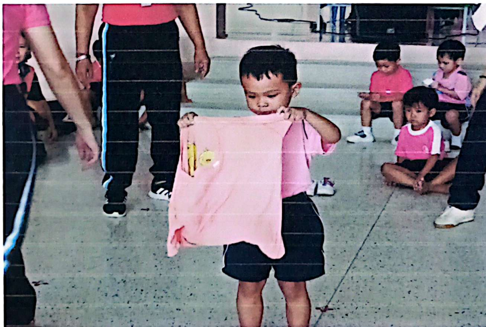
การแข่งขันกีฬาวิ่งเปลี่ยนเสื้อผ้า ระดับอนุบาล 2 (ชาย )