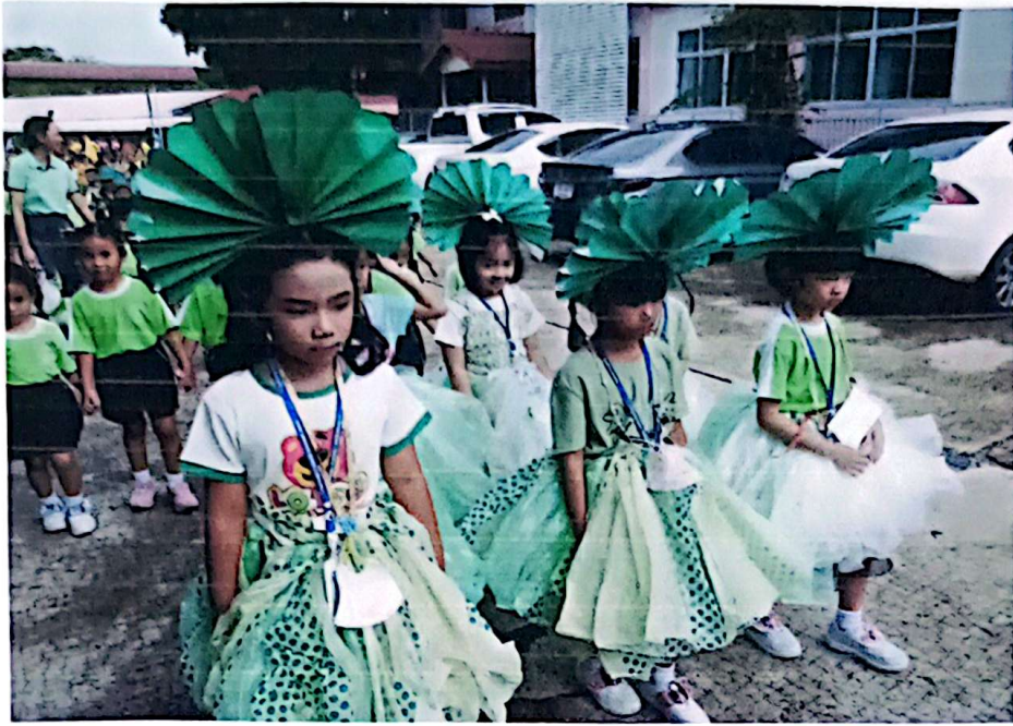
แพ็สไนท์ก็ ไม่แคร์ขอแค่นะ ใจสีเขียวกี่พอ