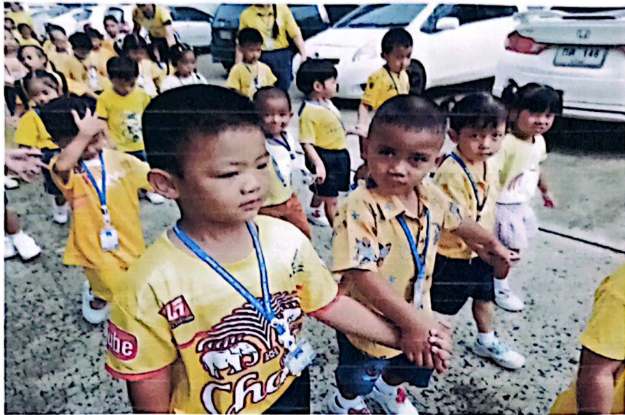
กีฬามีหลายสี แต่คนหน้าตาดีต้องสีเหลือง