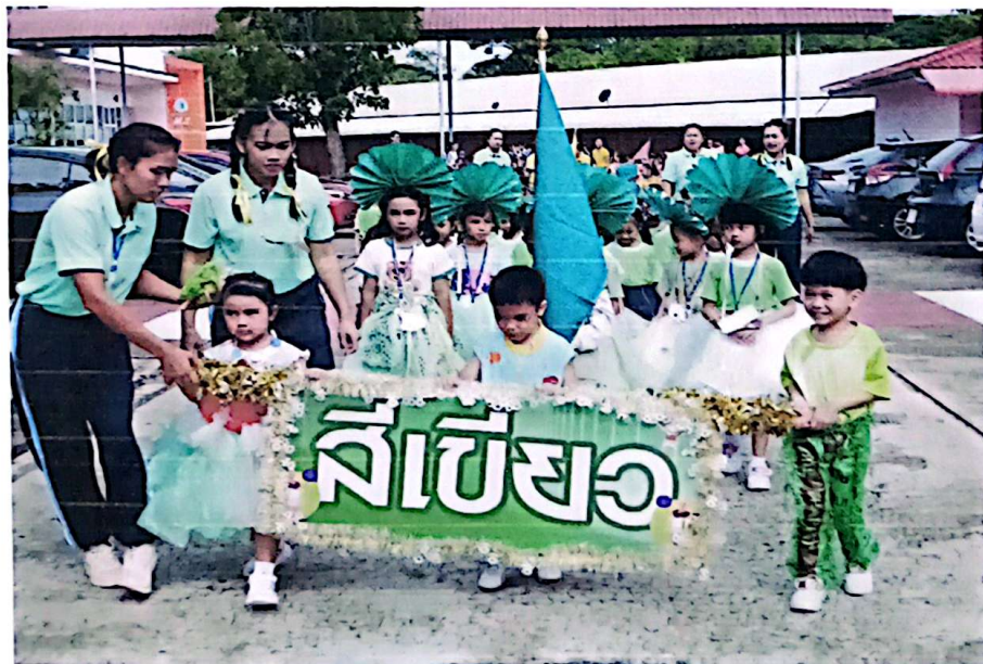
สีเขียวสู้ตายสู้ๆ