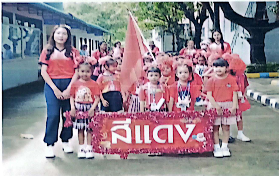
ขบวนพาเหรดสีแดง