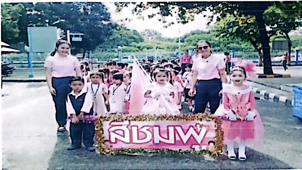
เดินขบวนพาเหรดตีชมพูนุ้ๆ