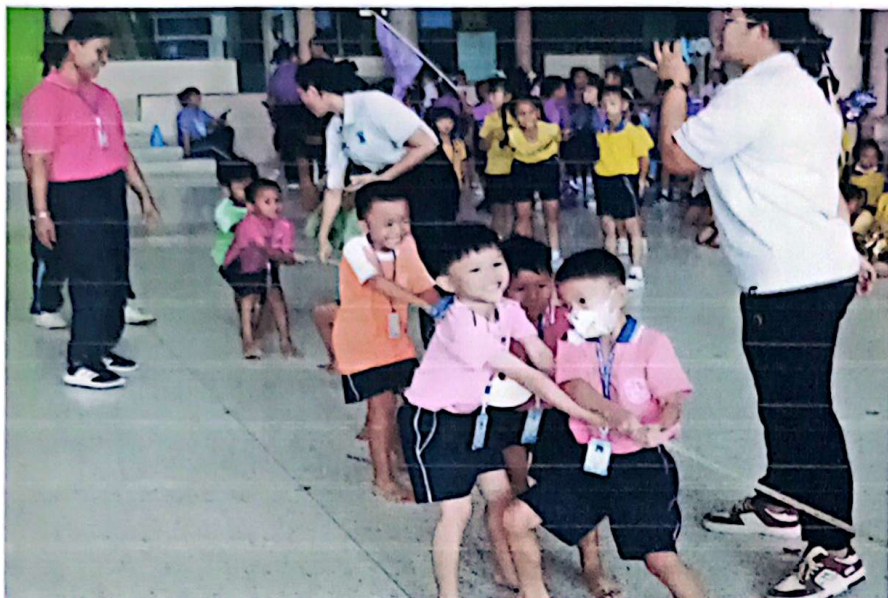
การแข่งขันกีฬาชักกะเย่อ ชาย ระดับอนุบาล 3