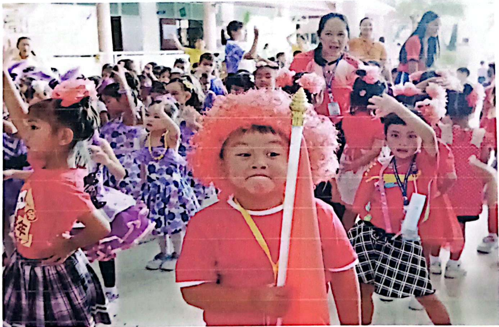
กองเชียร์สีแดงไว้อาลัย