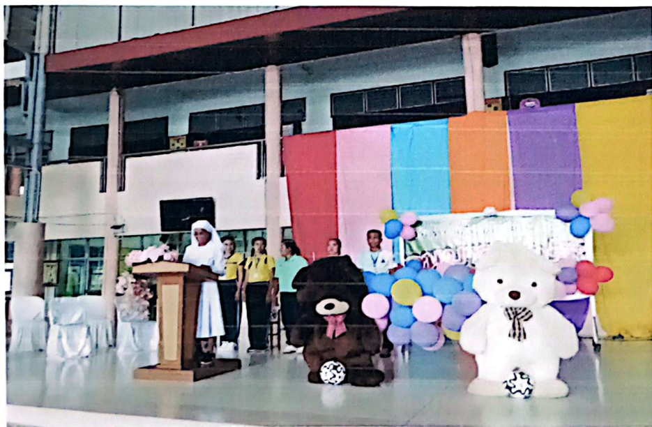
ประธานกล่าวรายงานเปิดการแข่งขันกีฬาสี