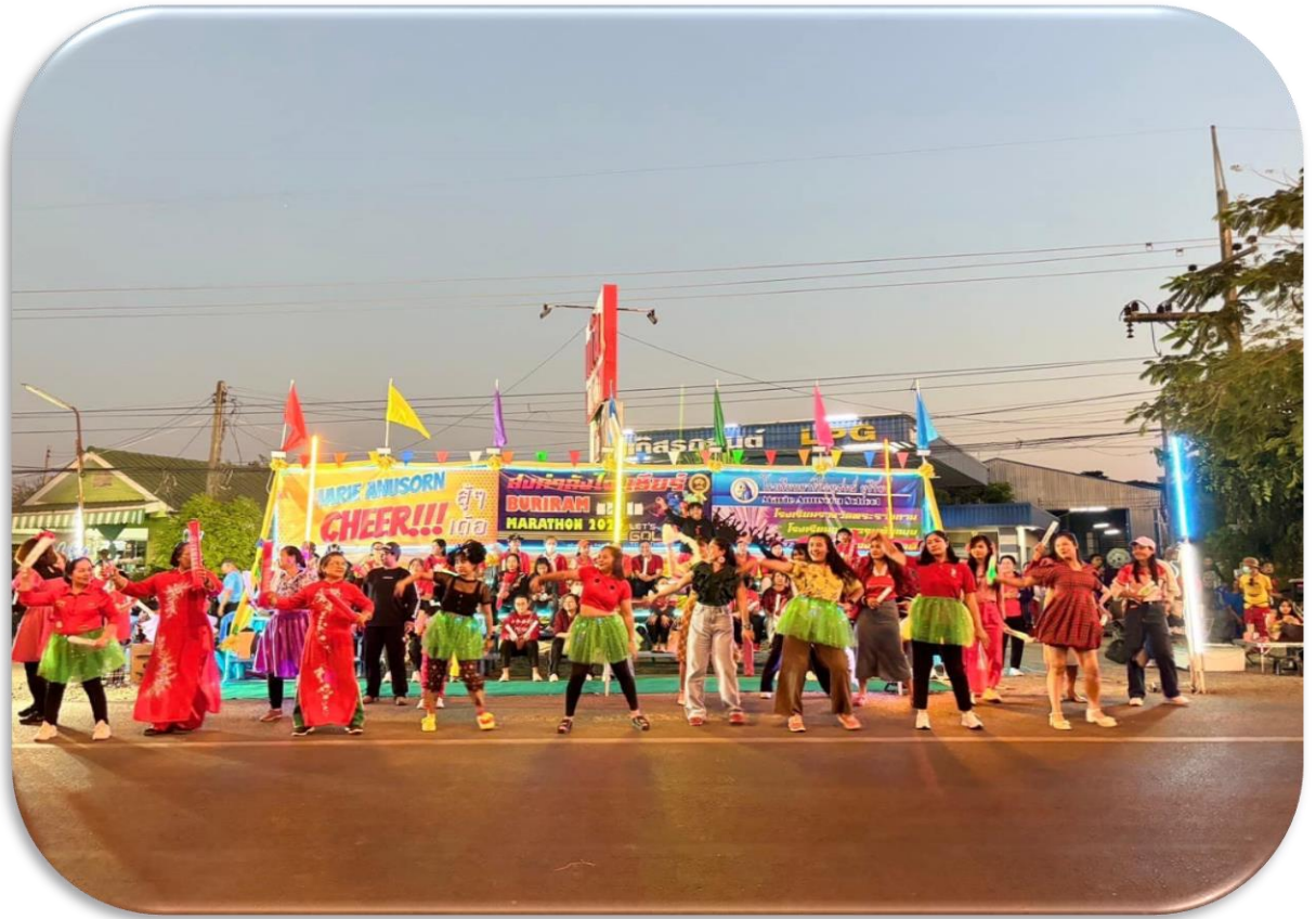
เชียร์ลีดเดอร์ จัดเต็มรูปแบบพร้อมด้วยแสดนเชียร์