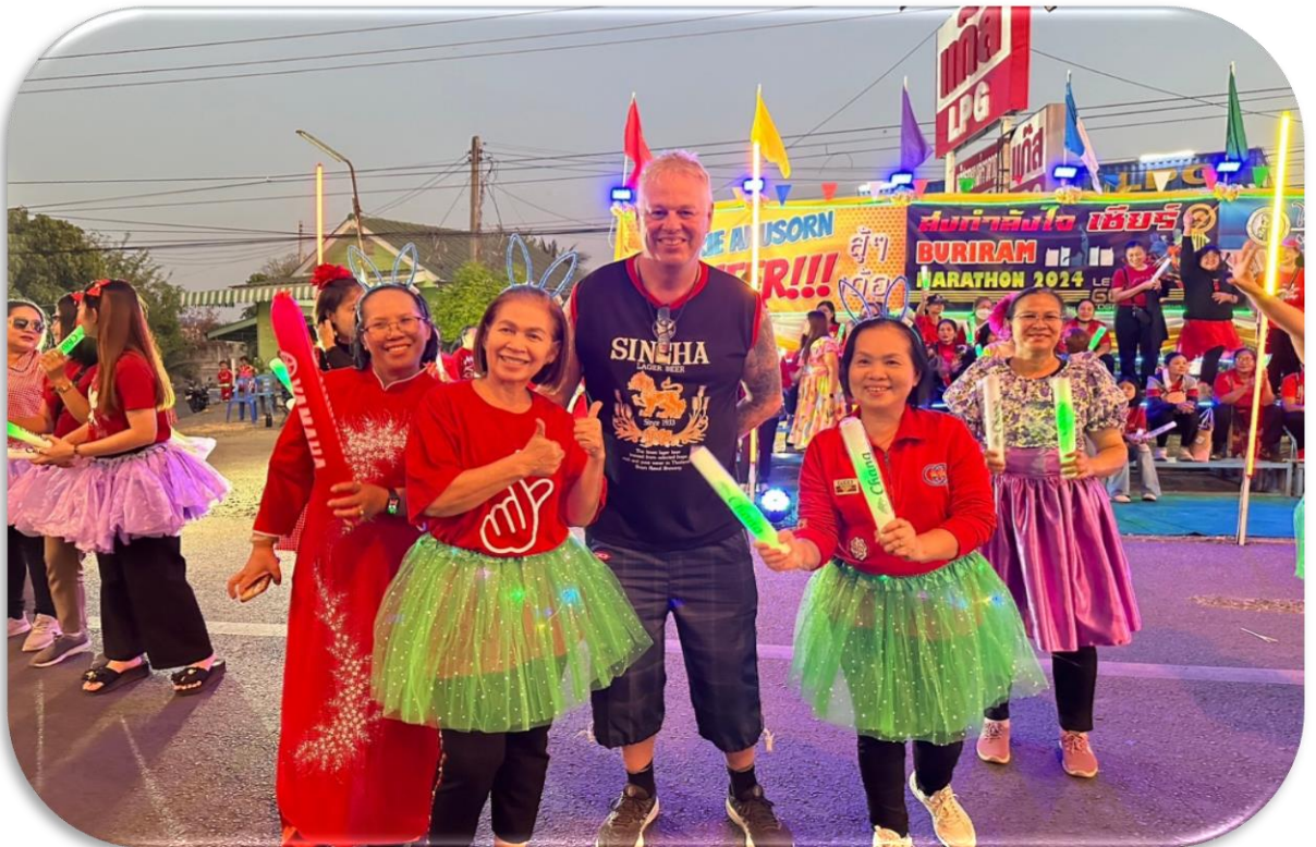
ชาวต่างชาติมาร่วมเชียร์จุดมารีย์อนุสรณ์ด้วยนะครับ