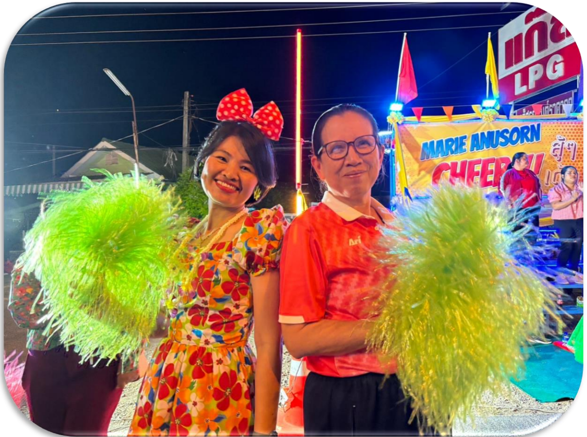
มารีย์เชียร์ บุรีรัมย์มาราธอน เต็มพิกัด เต็มแสนต์เชียร์ตลอดเวลา