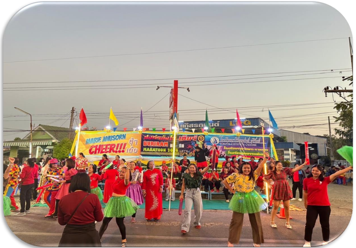
มารีย์เชียร์ บุรีรัมย์มาราธอน เต็มพิกัด เต็มแสดนต์เชียร์ตลอดเวลา