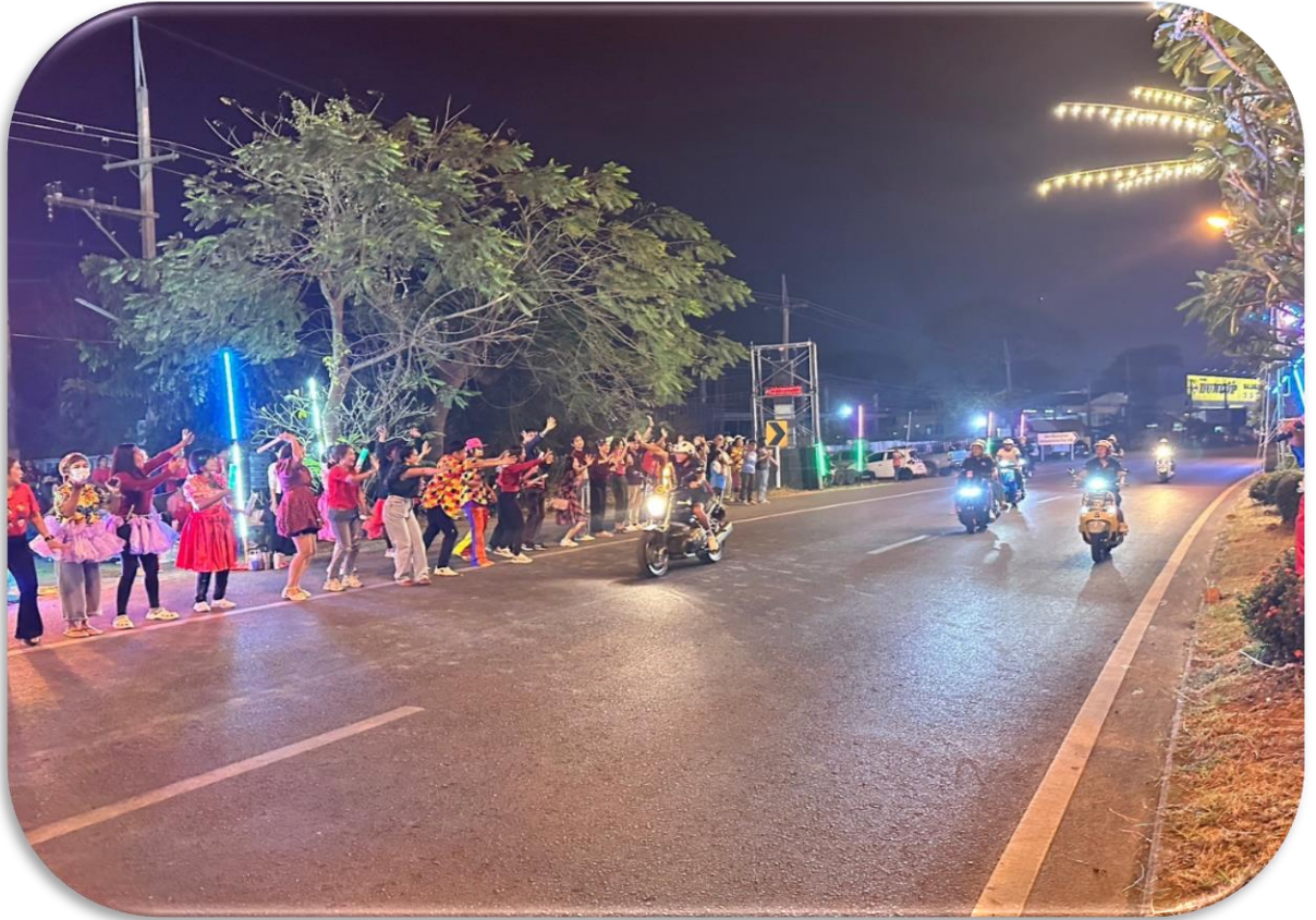
กองเชียร์ต้อนรับ “ลุงเนวิน” เยี่ยมจุดเชียร์มารีย์อนุสรณ์