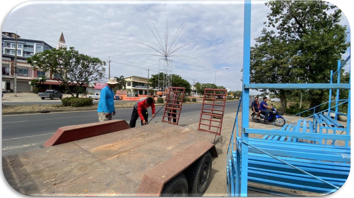
จัดเตรียมสถานที่