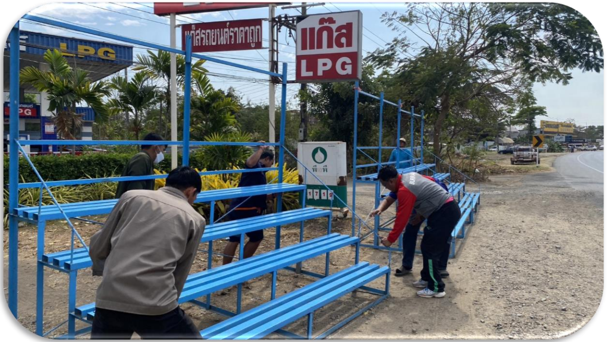
จัดเตรียมสถานที่