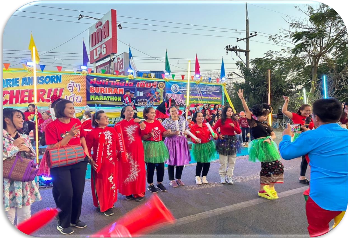
มารีย์เชียร์ บุรีรัมย์มาราธอน เต็มพิกัด เต็มแสดนต์เชียร์ตลอดเวลา