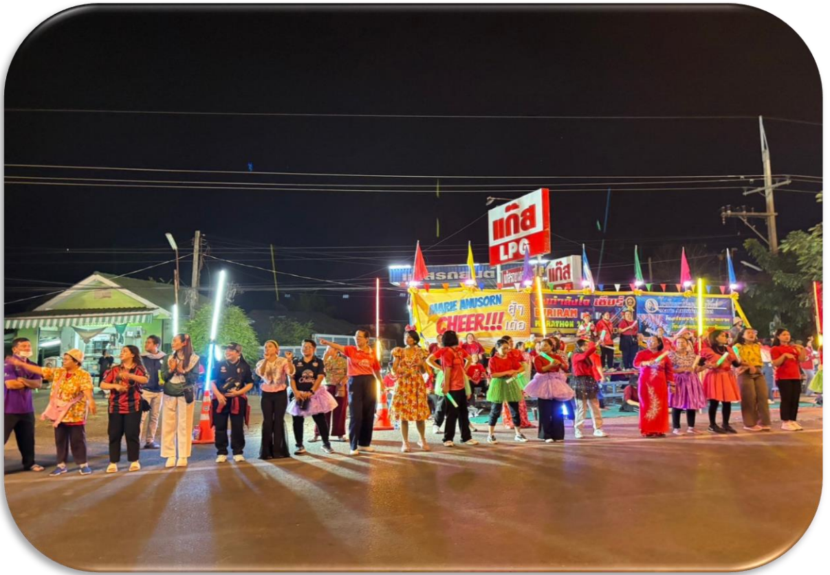
บรรยากาศจุดเชียร์ ความเป็นหนึ่ง รอเชียร์นักวิ่งรุ่นมาราธอน 42 กิโลเมตร