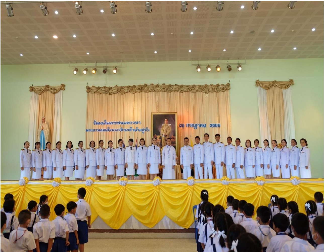
คณะผู้บริหาร คณะครู นักเรียน ร่วมบันทึกภาพในโอกาสร่วมพิธีถวายพระพร แต่พระบาทสมเด็จพระปรเมนทรรามาธิบดีศรีสินทรมหาวชิราลงกรณพระวชิรเกล้าเจ้าอยู่หัว