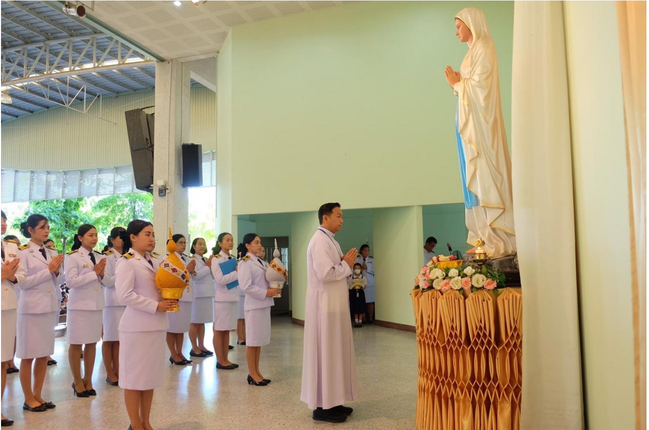
ประธานในพิธีนำคณะผู้แทนครูขึ้นบนเวทีเคารพพระแม่มาเรียย์ จุดเทียน ถวายมาลัยกร