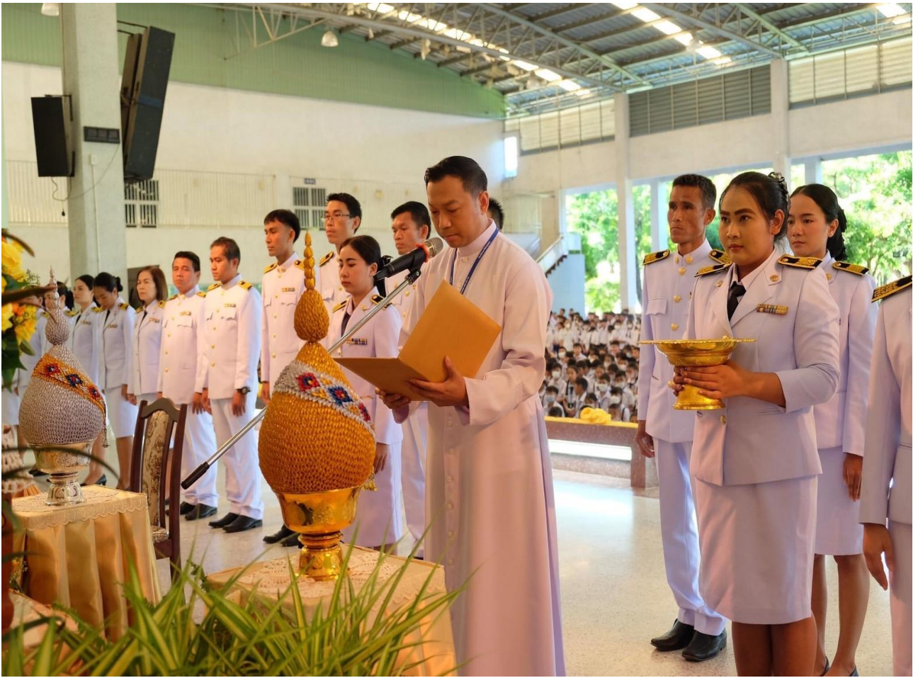
ประธานในพิธีอ่านคำสดุดีเฉลิมพระเกียรติถวายพระพรชัยมงคลแด่พระบาทสมเด็จพระปรเมนทรรามาธิบดีศรีสินทรมหาวชิราลงกรณพระวชิรเกล้าเจ้าอยู่หัว