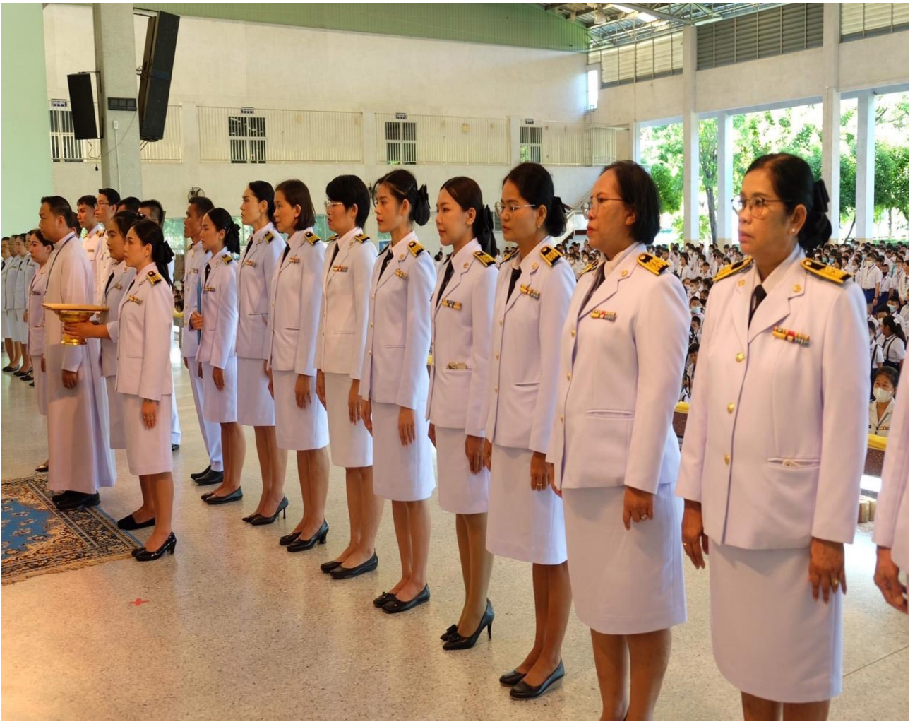
คณะครูและนักเรียนทุกระดับชั้น ร่วมร้องเพลง สดุดีจอมราชา และเพลงสรรเสริญพระบารมี