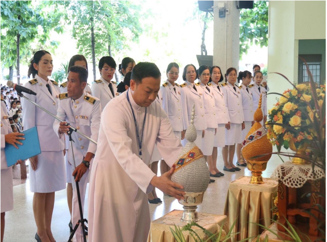
ประธานในพิธีถวายพานพุ่มเบื้องหน้าพระฉายาลักษณ์พระบาทสมเด็จพระปรเมนทรรามาธิบดีศรีสินทรมหาวชิราลงกรณพระวชิรเกล้าเจ้าอยู่หัว