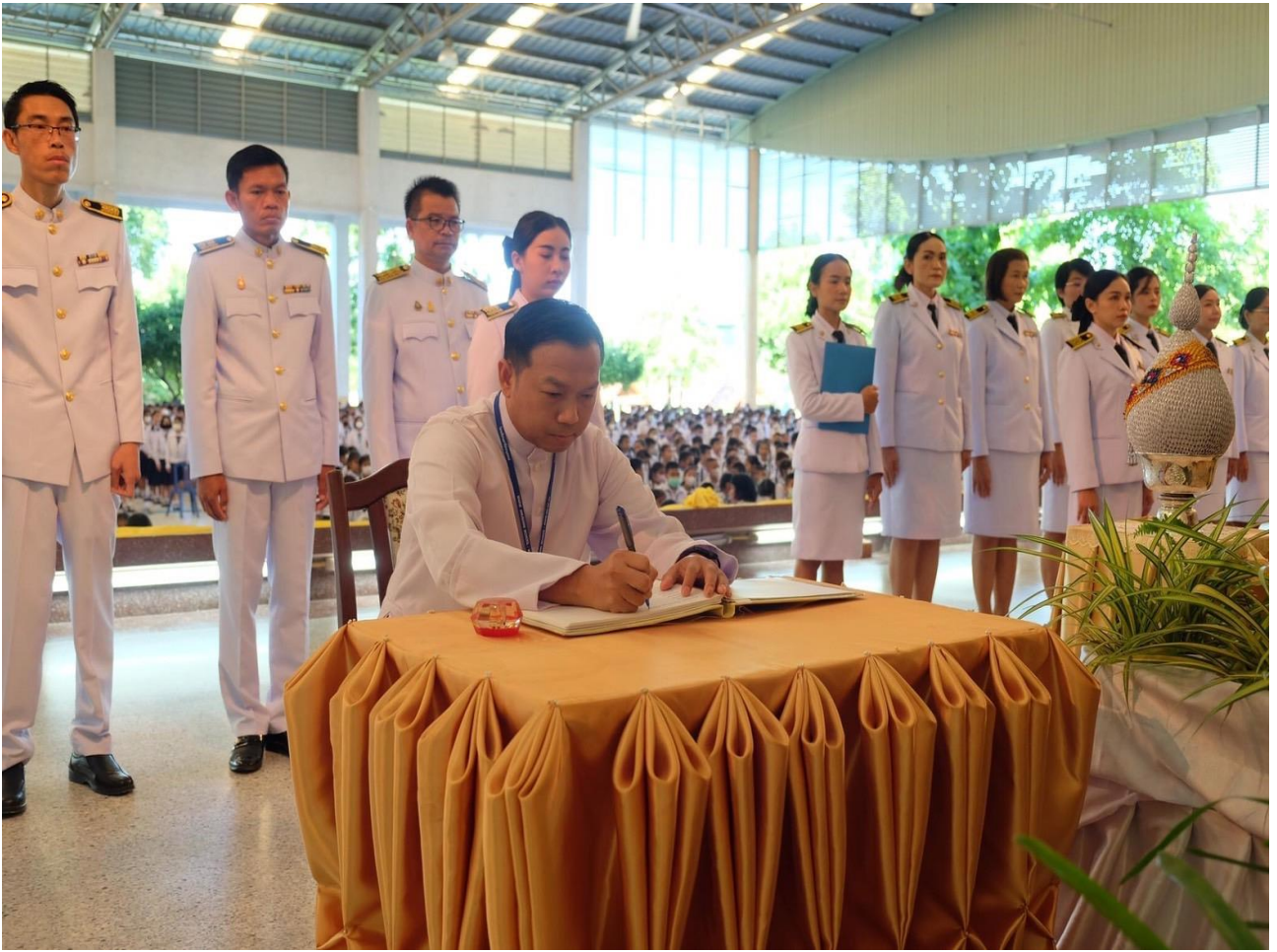
ประธานในพิธีลงนามถวายพระพรแด่พระบาทสมเด็จพระปรเมนทรรามาธิบดี ศรีสินทรมหาวชิราลงกรณ์พระวชิรเกล้าเจ้าอยู่หัว