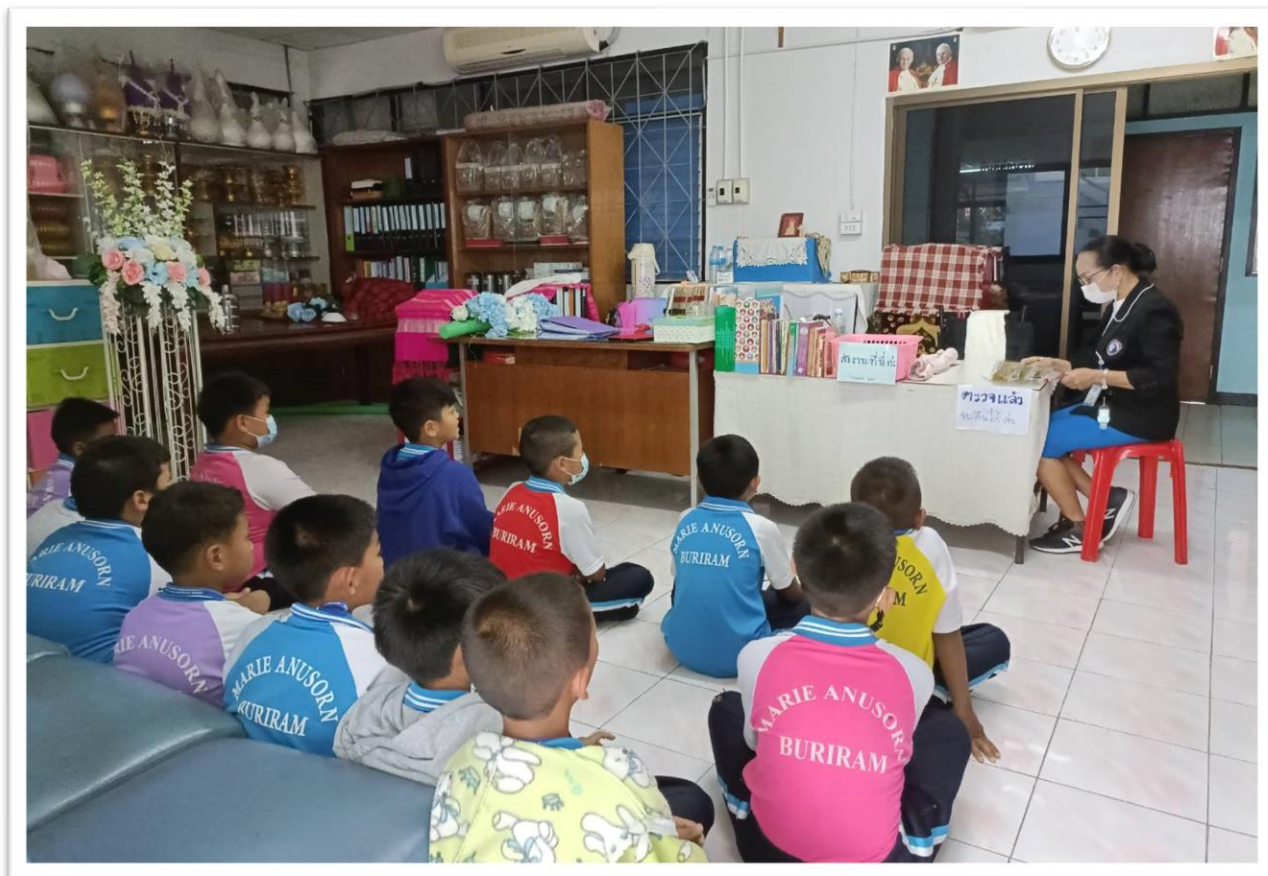
อบรมนักเรียน