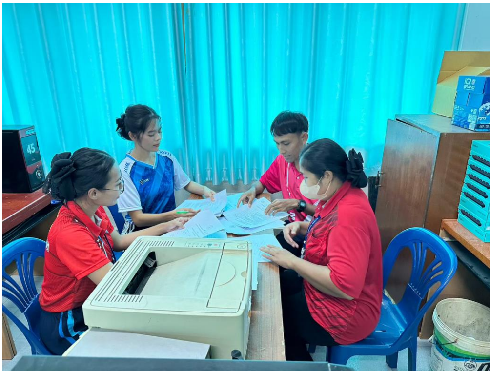
ภาพนิเทศการจัดการเรียนการสอน