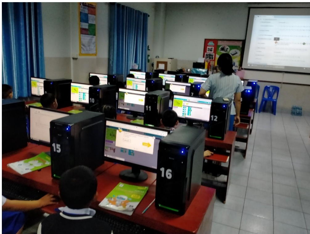
ภาพการจัดการเรียนการสอน