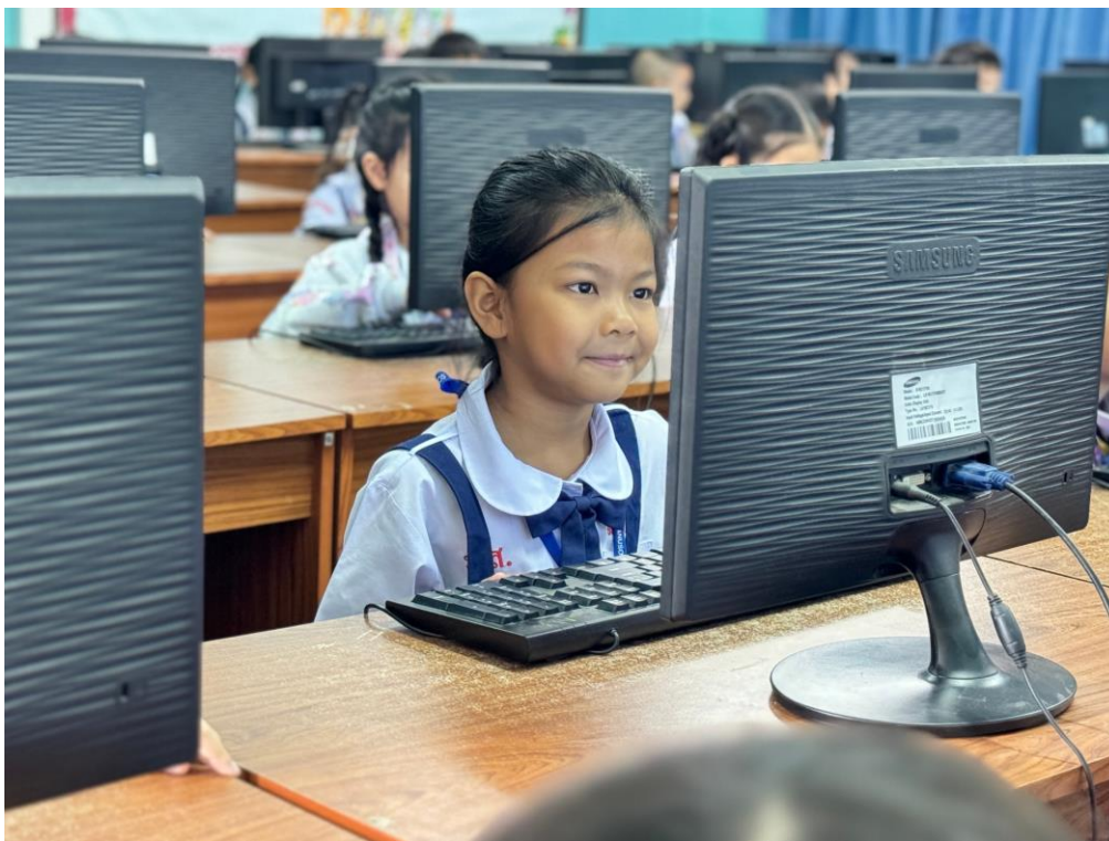
ภาพการจัดการเรียนการสอน