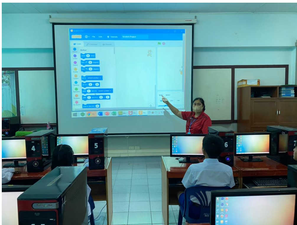
ภาพการจัดการเรียนการสอน