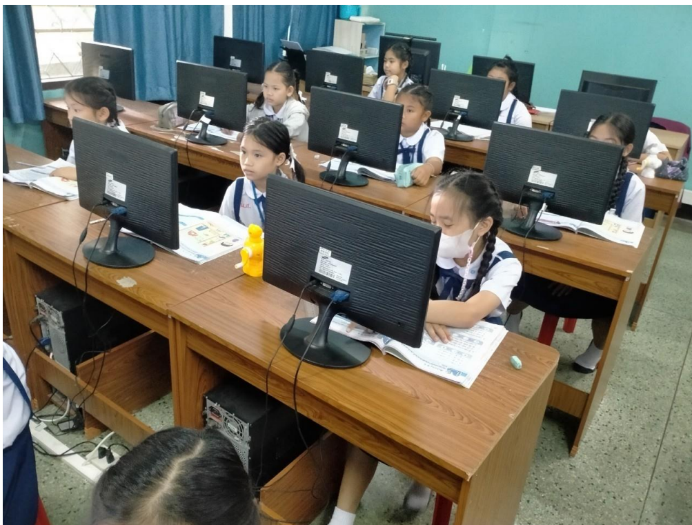
ภาพการจัดการเรียนการสอน