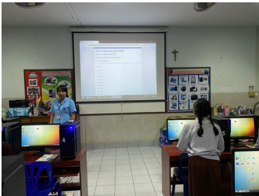
ภาพการจัดการเรียนการสอน