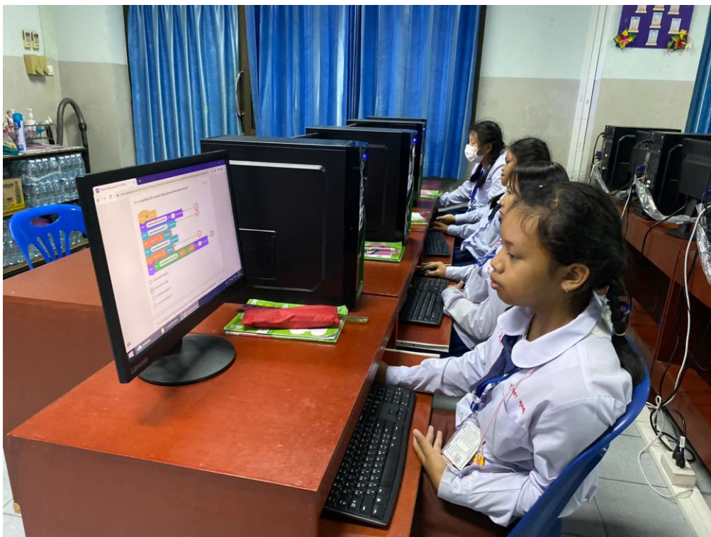
ภาพการจัดการเรียนการสอน