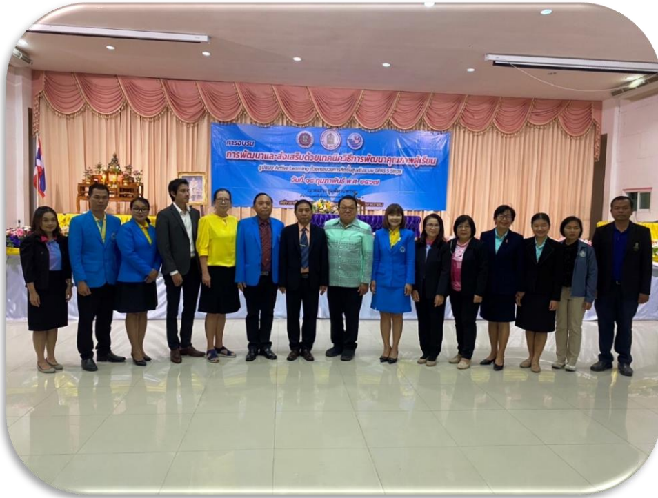
ภาพบรรยากาศการพัฒนาและส่งเสริมด้วยเทคนิควิธีการพัฒนาคุณภาพผู้เรียน