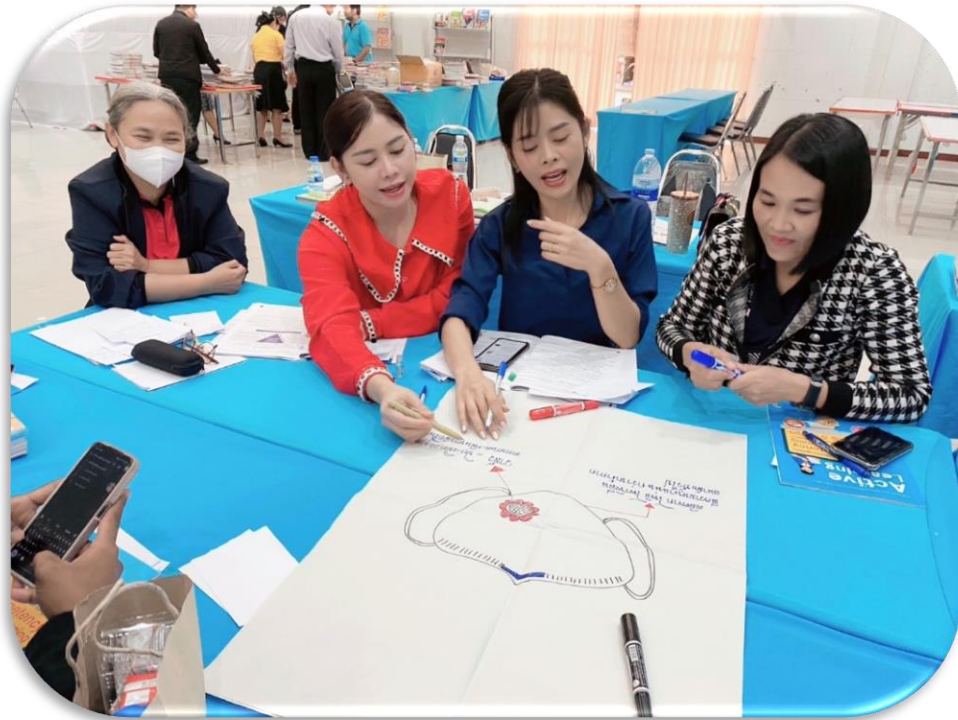
ผู้เข้ารับการอบรม ทำ Workshop : การพัฒนาและส่งเสริมด้วยเทคนิควิธีการ พัฒนาคุณภาพผู้เรียน