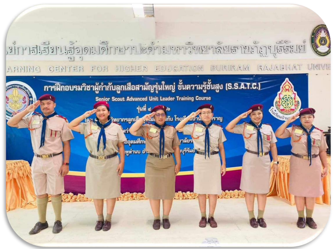
ผู้เข้าร่วมอบรมฝึกทักษะ และพัฒนาความรู้ในการอยู่ค่าย