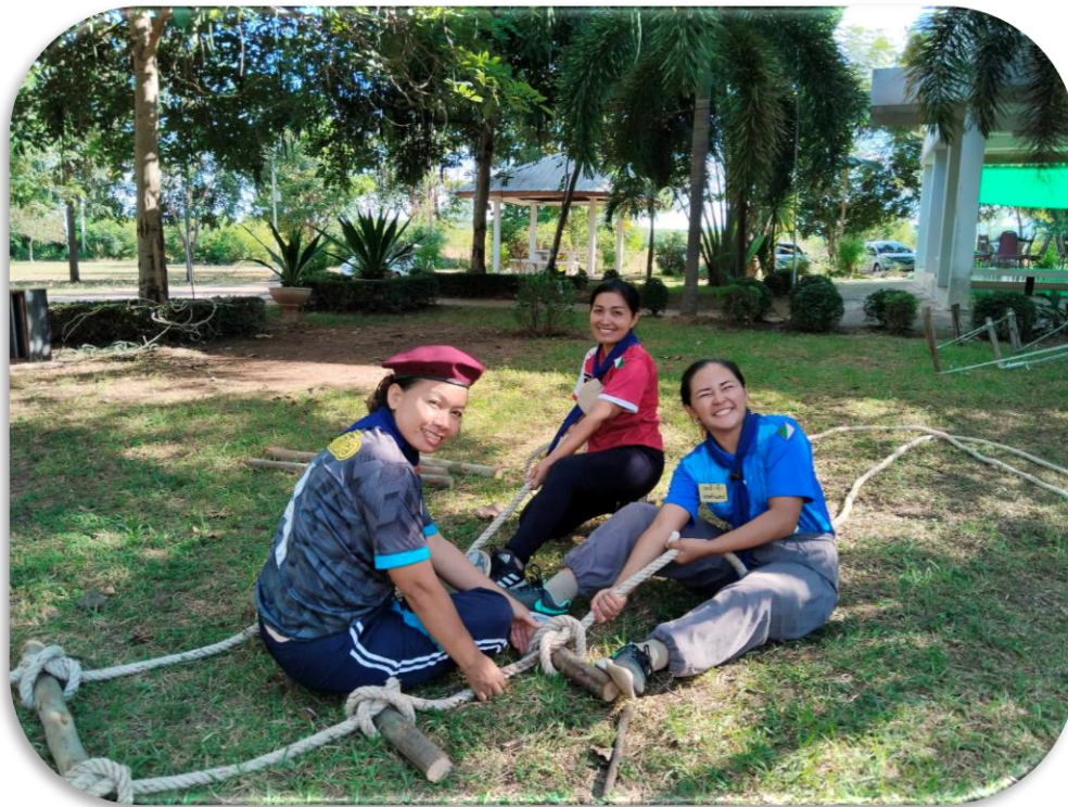
ผู้เข้าร่วมอบรมฝึกทักษะ และพัฒนาความรู้ในการอยู่ค่าย