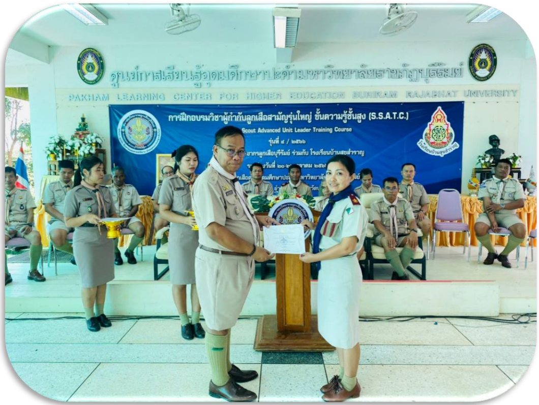
ตัวแทนกลุ่มแต่ละโรงเรียน รับมอบเกียรติบัตร