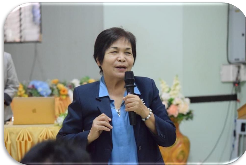
ผู้เข้ารับการอบรม ทำ Workshop : การจัดทำหลักสูตรฐานสมรรถนะ