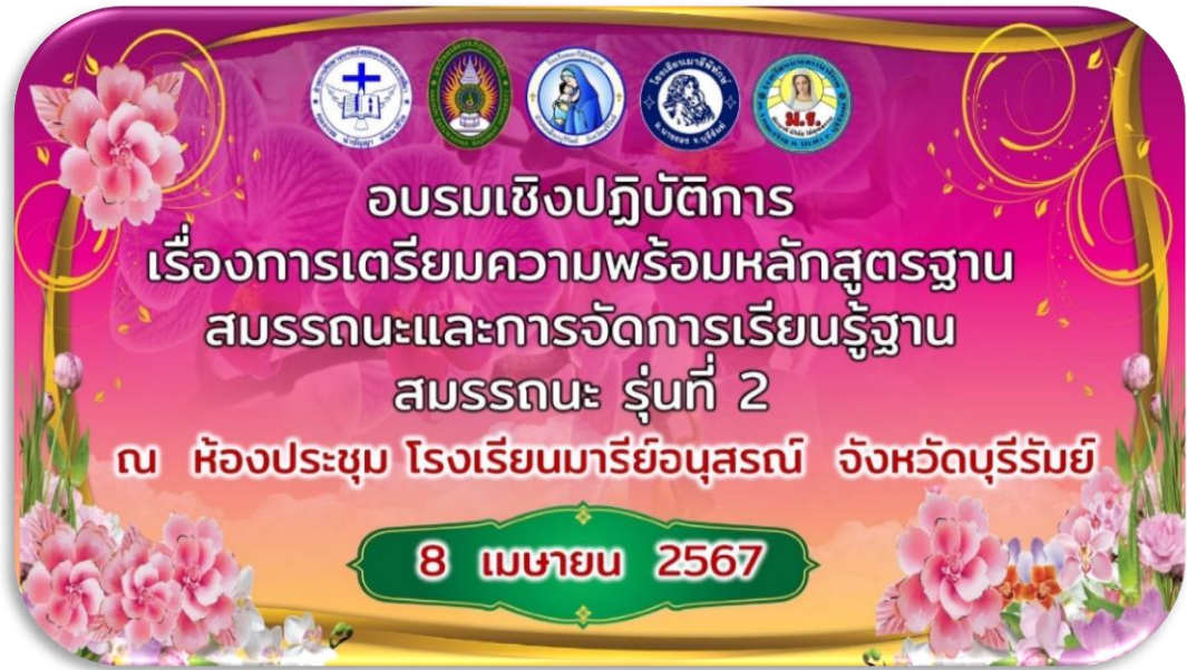
การอบรมเชิงปฏิบัติการการจัดทำหลักสูตรฐานสมรรถนะ