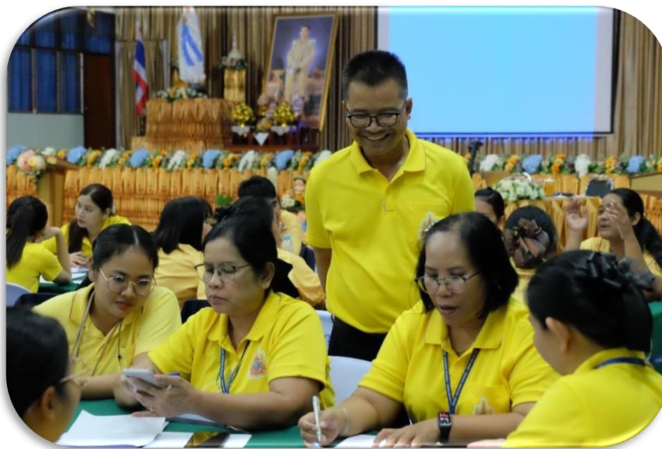
คุณครูที่เข้าร่วมการจัดทำหลักสูตรฐานสมรรถนะ