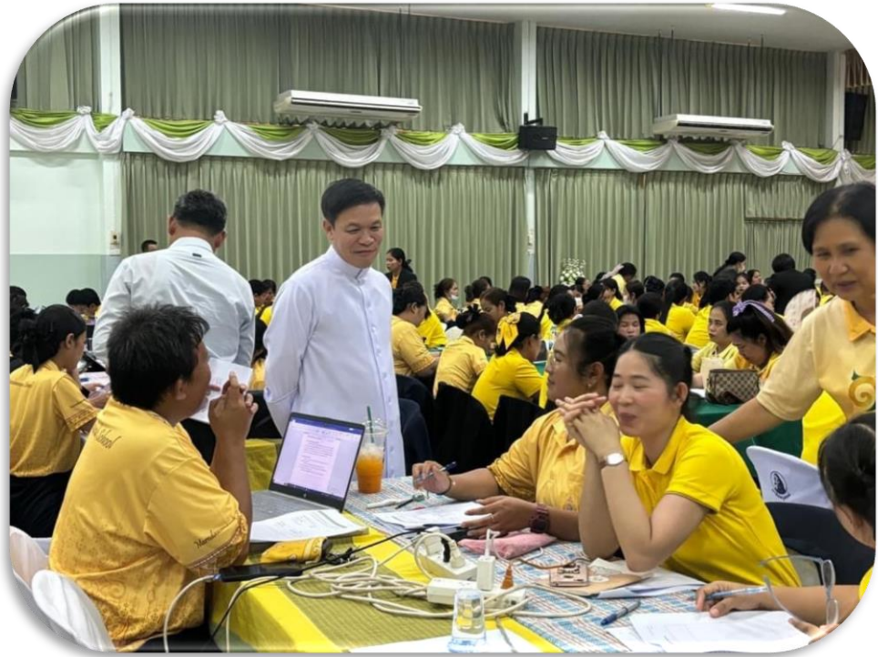
ภาพบรรยากาศการจัดทำหลักสูตรฐานสมรรถนะ