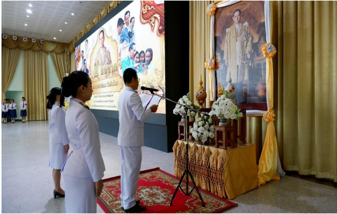
ประธานในพิธีกล่าวน้อมรำลึกในพระมหากรุณาธิคุณพระบาทสมเด็จพระบรมชนกาธิเบศร มหาภูมิพลอดุลยเดชมหาราช บรมนาถบพิตร