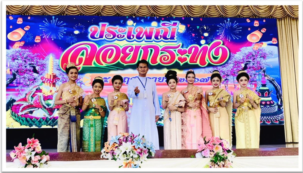
ภาพการประกวดนางนพมาศประจำปีการศึกษา 2567