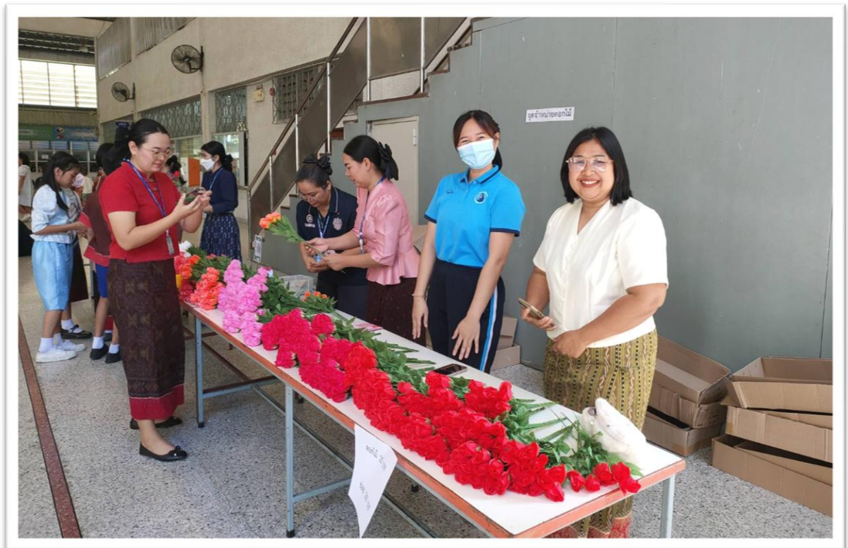
ภาพบรรยากาศการทำกระทง