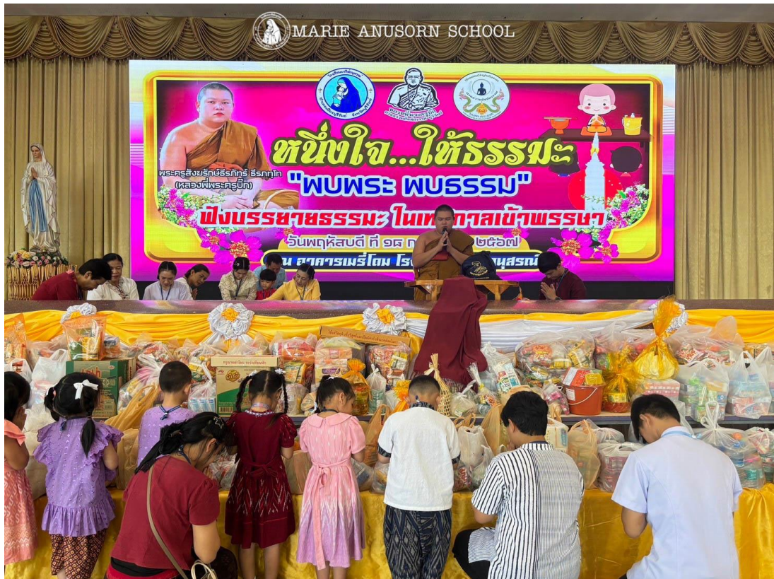
ครูและนักเรียนร่วมใจถวายสังฆทานพร้อมด้วยจตุปัจจัยแด่พระสงฆ์ เนื่องในโอกาสวันเข้าพรรษา