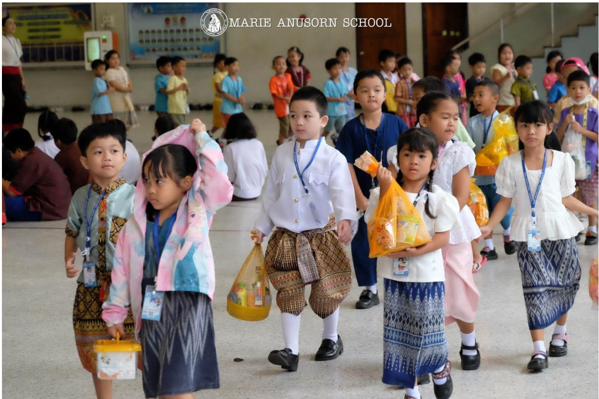
ครูและนักเรียนเตรียมถวายสังฆทานพร้อมด้วยจตุปัจจัยแด่พระสงฆ์