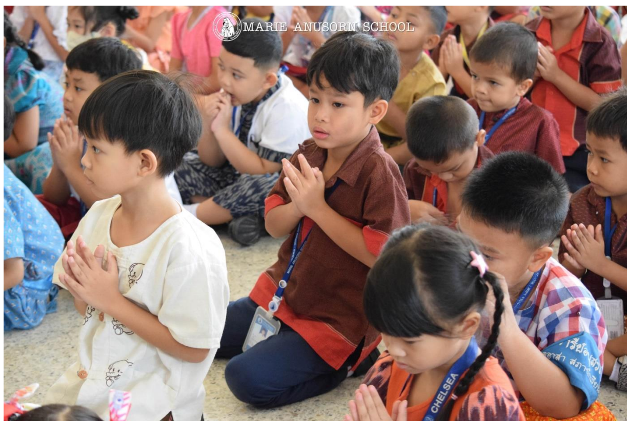
ครูและนักเรียนร่วมฟังธรรมะเนื่องในโอกาสวันเข้าพรรษา