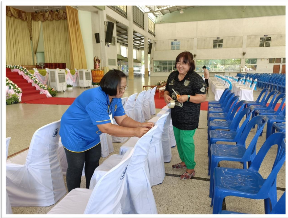
จัดเตรียมสถานที่เสิร์ฟ