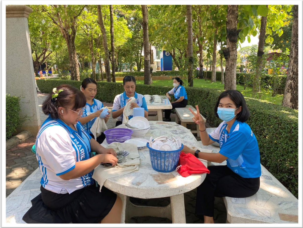
จัดเตรียมอุปกรณ์การเสิร์ฟ งาน ซ้อม ส้อม แก้วน้ำ ล้างทำความสะอาด เตรียมใช้เสิร์ฟ ในวันฉลองวัดแม่พระแห่งสายประคำศักดิ์สิทธิ์