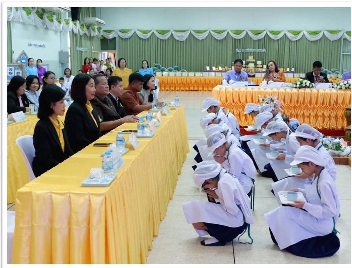
27 ก.พ.68 : เสริฟอาหารว่าง น้ำดื่ม ต้อนรับคณะกรรมการประเมินสถานศึกษา