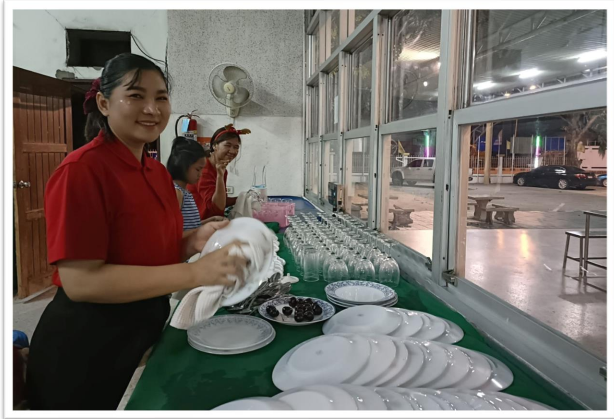
21 ธันวาคม 67 : หลังจากจบงานค่ำคืนสุขสันต์วันคริสต์มาส จัดเก็บถ้วย จาน แก้วน้ำ ล้างทำความสะอาด และเก็บเข้าที่ให้เรียบร้อย