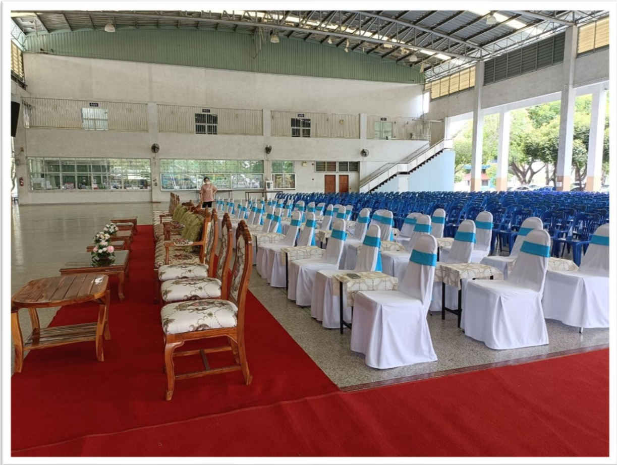
จัดเตรียมสถานที่เสร็จ