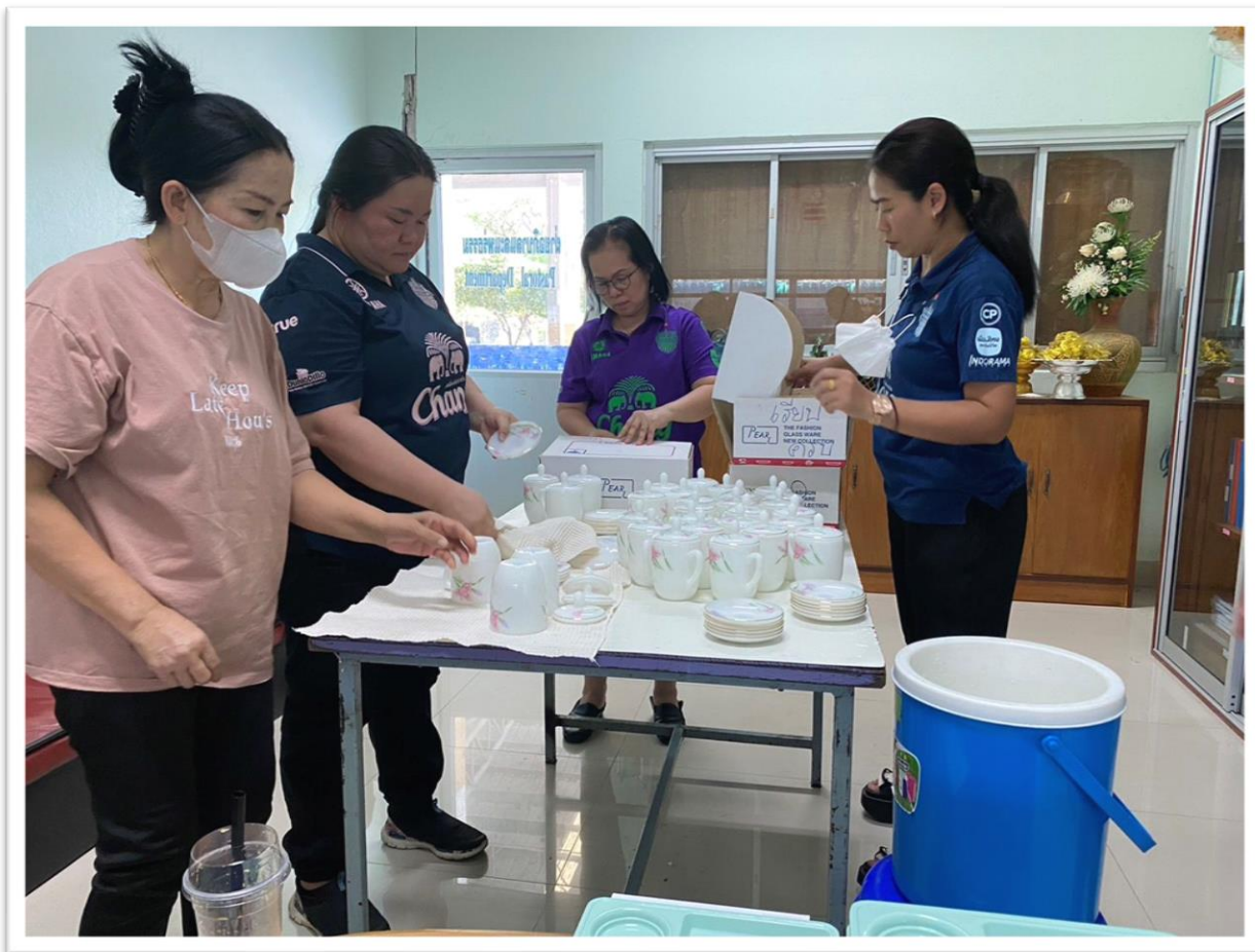
จัดเตรียมแก้วมุก ล้างทำความสะอาด