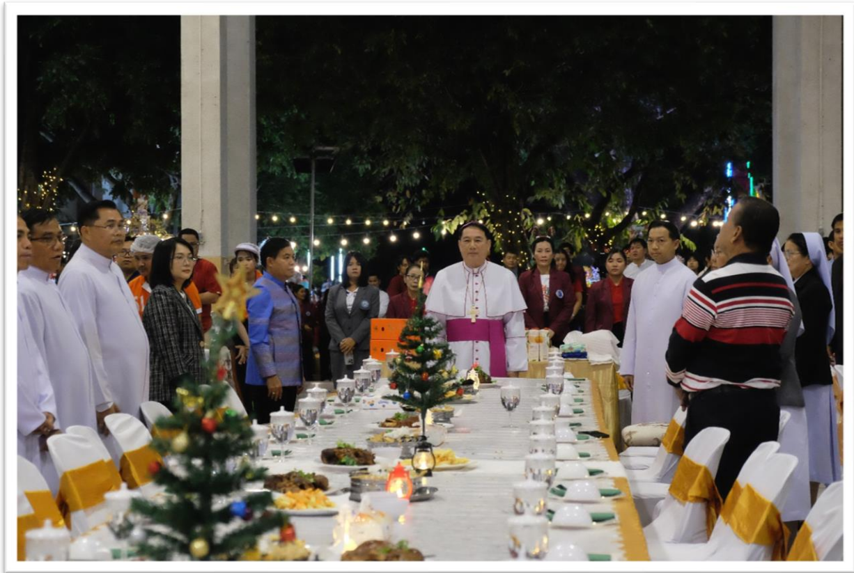
21 ธันวาคม 67 : จัดโต๊ะอาหาร และดูแลอาหารแขก VIP งานค่ำคืนสุขสันต์วันคริสต์มาส