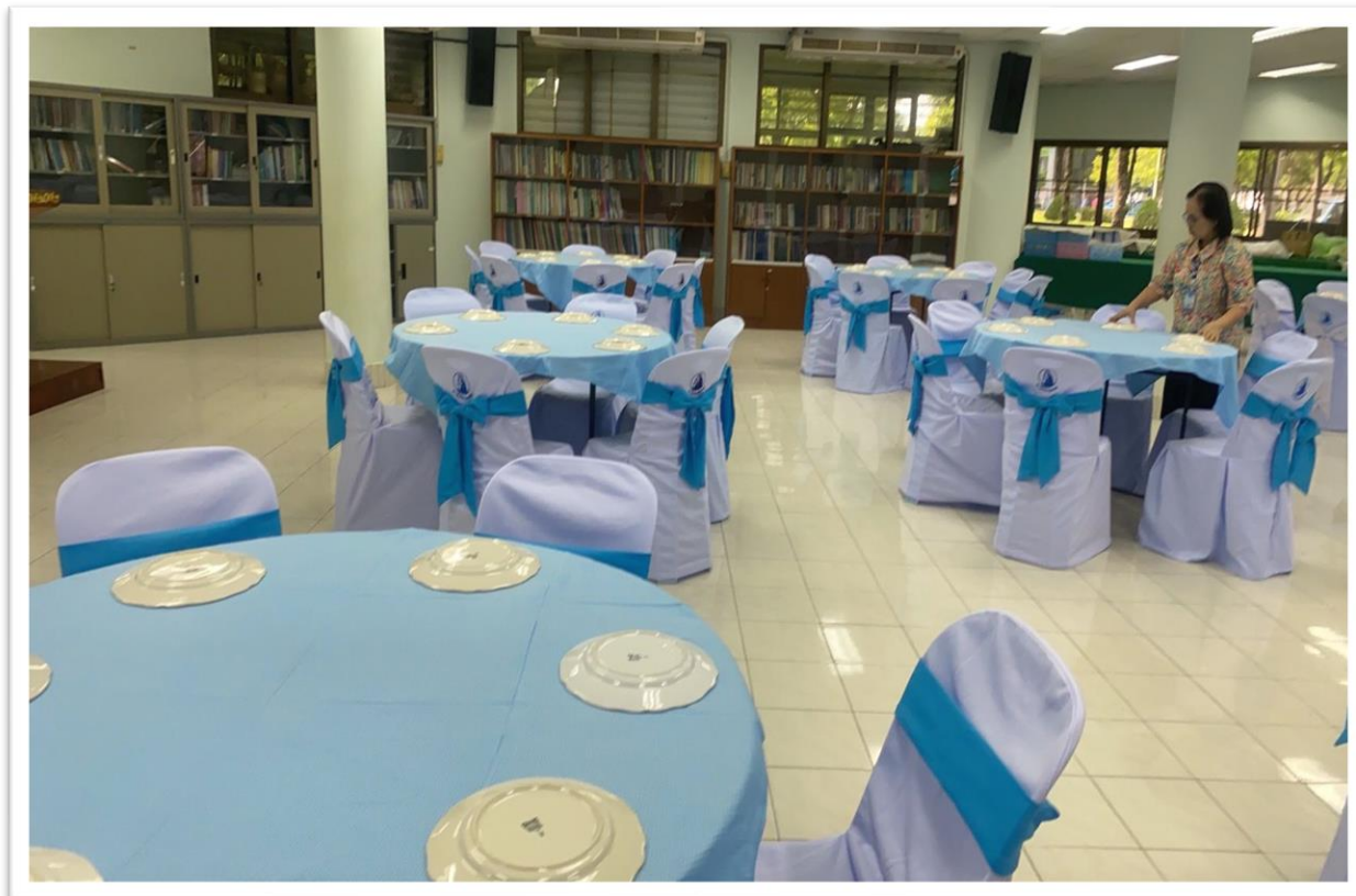
จัดเตรียมสถานที่รับประทานอาหาร