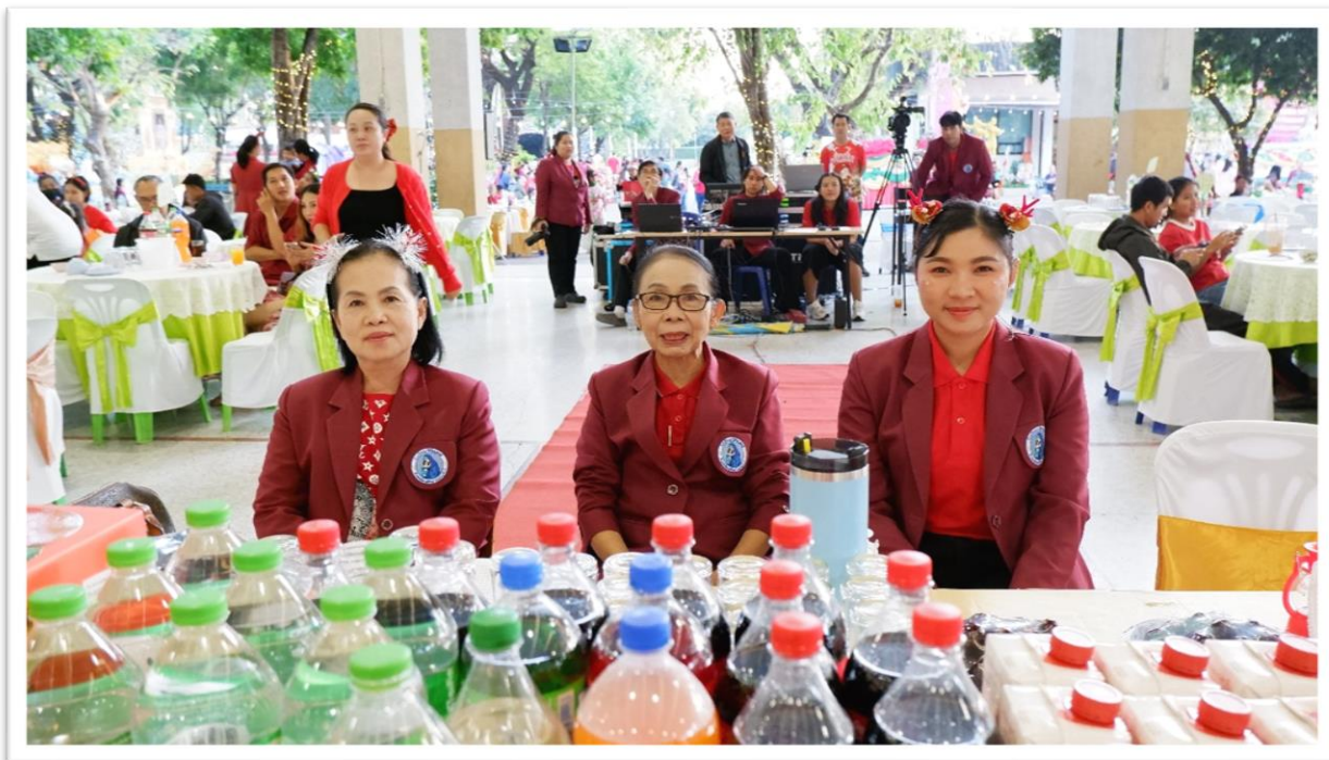
21 ธันวาคม 67 : จัดโต๊ะอาหาร และดูแลอาหารแขก VIP งานคำคืนสุขสันต์วันคริสต์มาส