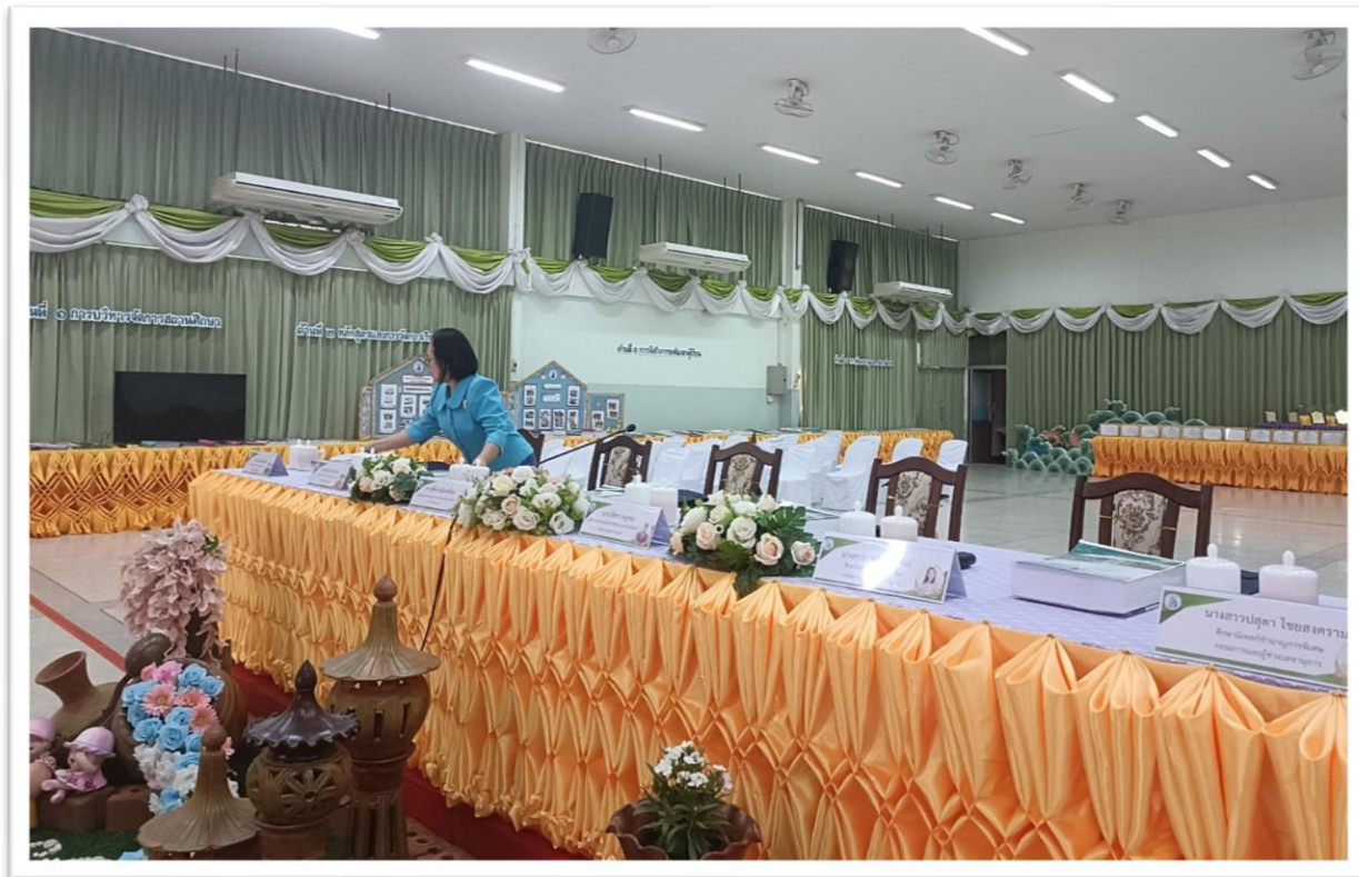
27 ก.พ.68 : จัดเตรียมสถานที่ อาหารว่าง น้ำดื่ม ต้อนรับคณะกรรมการ ประเมินสถานศึกษา