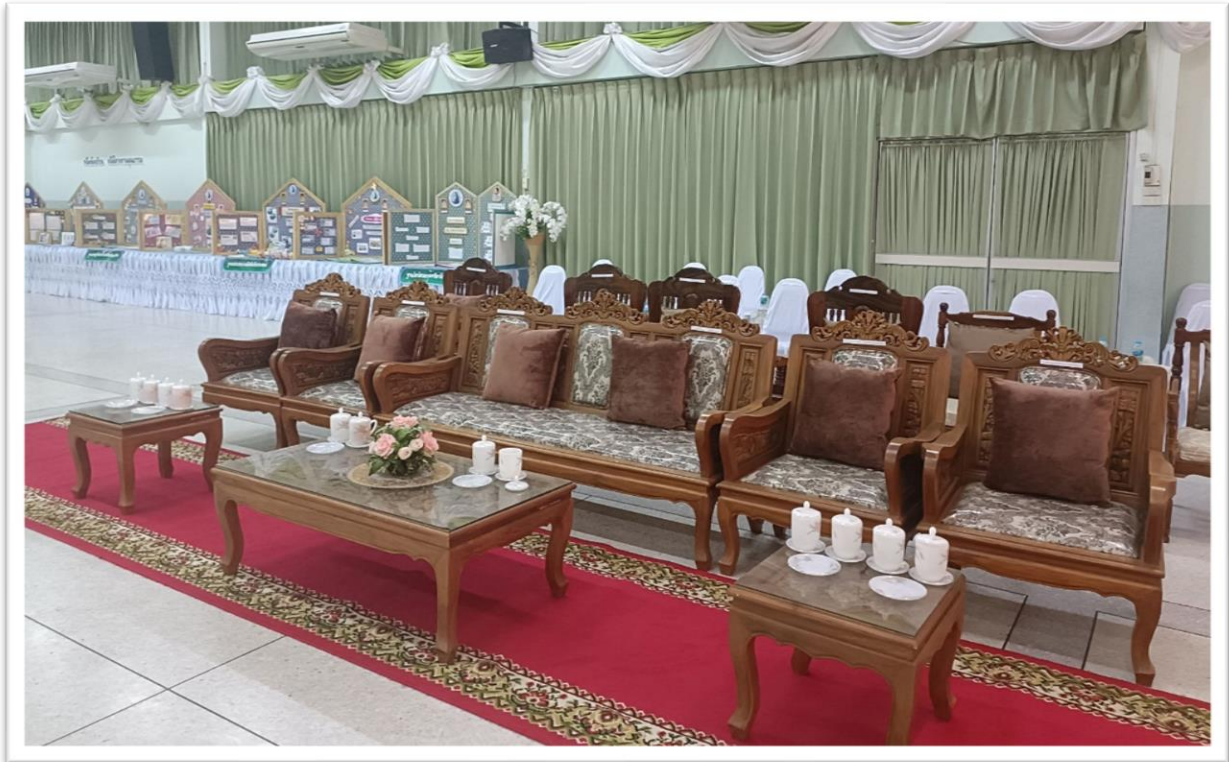
27 ก.พ.68 : จัดเตรียมสถานที่ อาหารว่าง น้ำดื่ม ต้อนรับคณะกรรมการ ประเมินสถานศึกษา