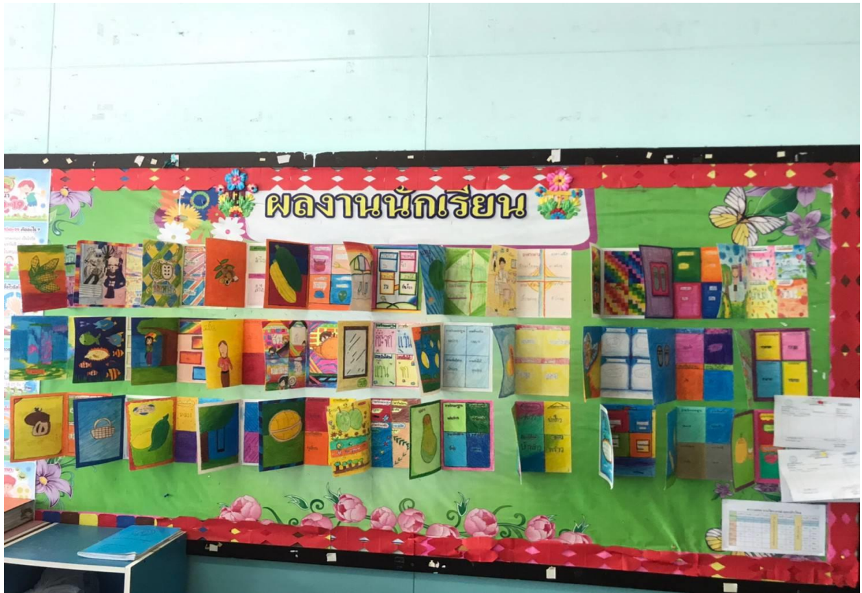
บอร์ดผลงานนักเรียนในแต่ละห้องเรียน