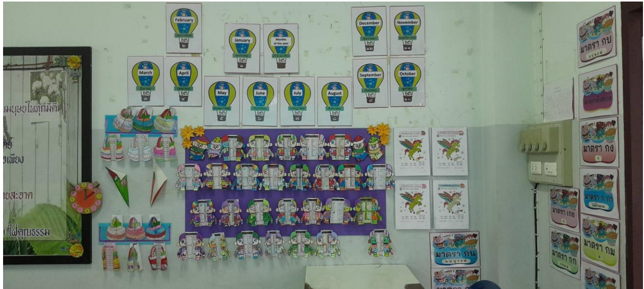
บอร์ดผลงานนักเรียนในแต่ละห้องเรียน