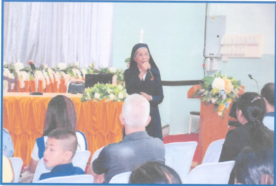
ผู้บริหารกล่าวต้อนรับผู้ปกครองและนักเรียนทุกคน