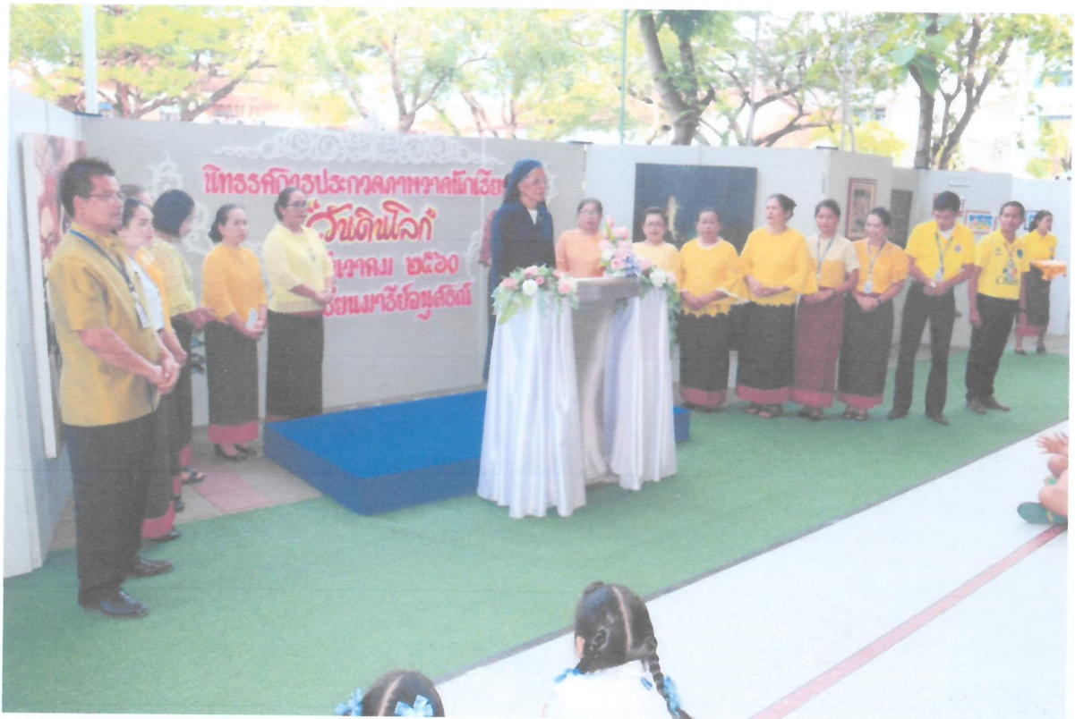
ซิสเตอร์ผู้อำนวยการเป็นประธานในพิธีกิจกรรมวันดินโลก