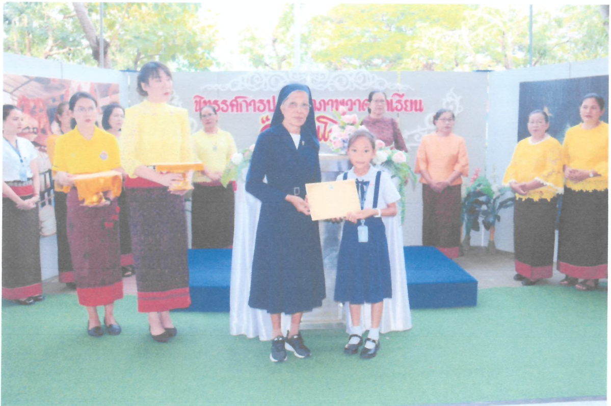
ซิสเตอร์ผู้อำนวยความสะดวกมอบเกียรติบัตรให้กับนักเรียนที่ชนะการประกวดวาดภาพวันดินโลก