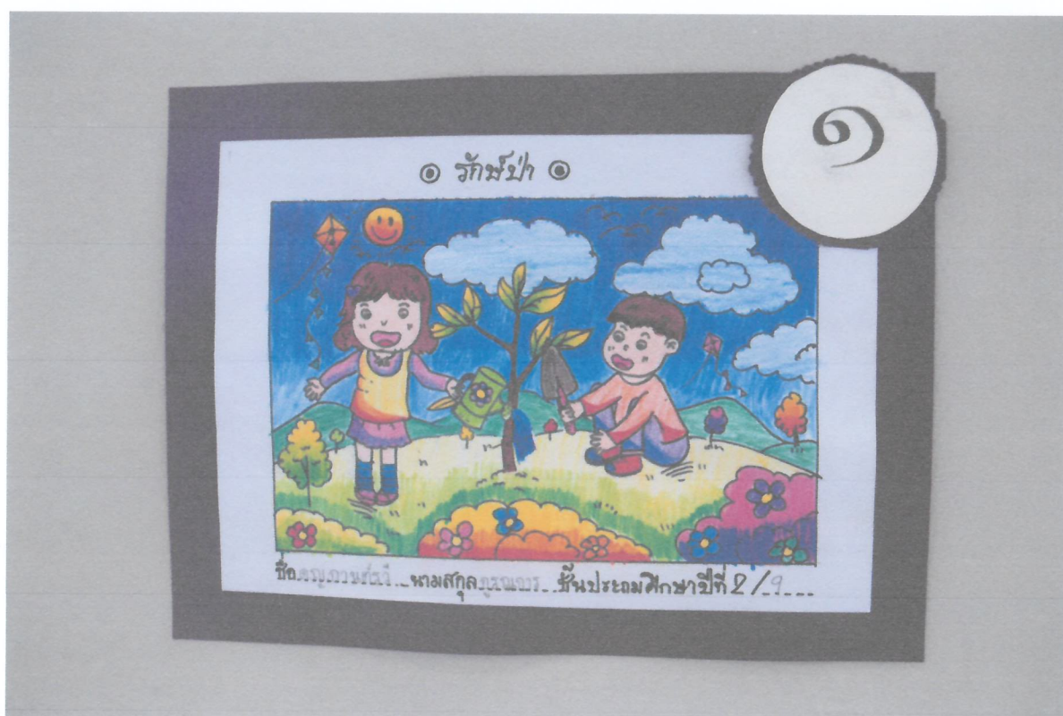
ภาพถ่ายจากงานนิทรรศการการประกวดวาดภาพวันดินโลก รางวัลอันดับที่ 1 จากช่วงชั้นต่างๆ