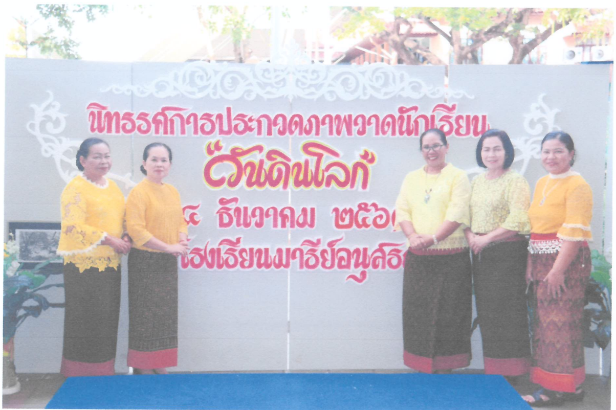
คณะคุณครูร่วมถ่ายภาพร่วมกัน