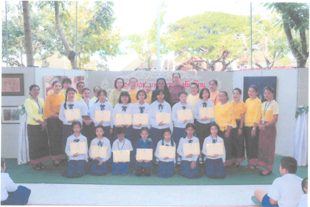
คณะครูและคณะผู้บริหารร่วมถ่ายรูปกับนักเรียนที่ได้รับรางวัล