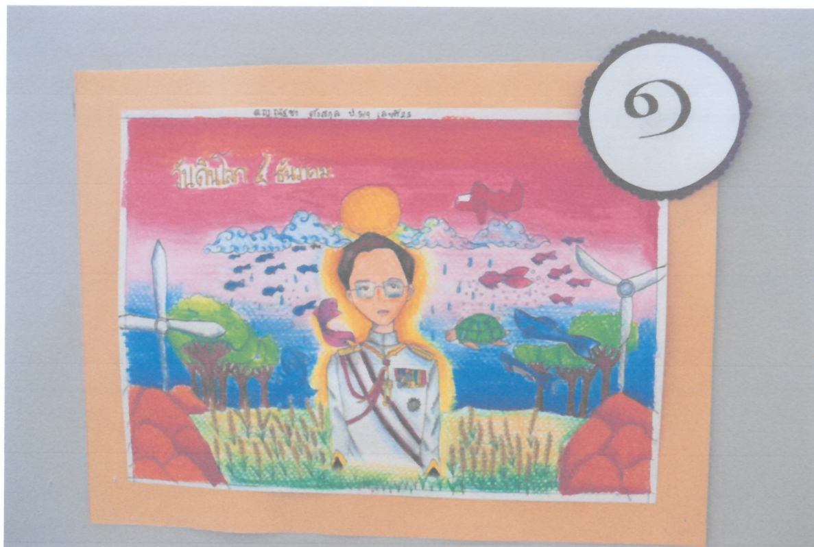
ภาพถ่ายจากงานนิทรรศการการประกวดวาดภาพวันดินโลก รางวัลอันดับที่ 1 จากช่วงชั้นต่างๆ