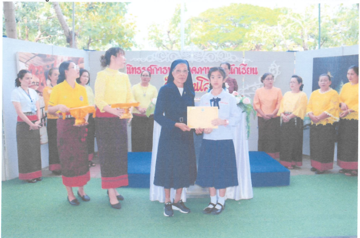
ซิสเตอร์ผู้อำนวยความสะดวกมอบเกียรติบัตรให้กับนักเรียนที่ชนะการประกวดวาดภาพวันดินโลก