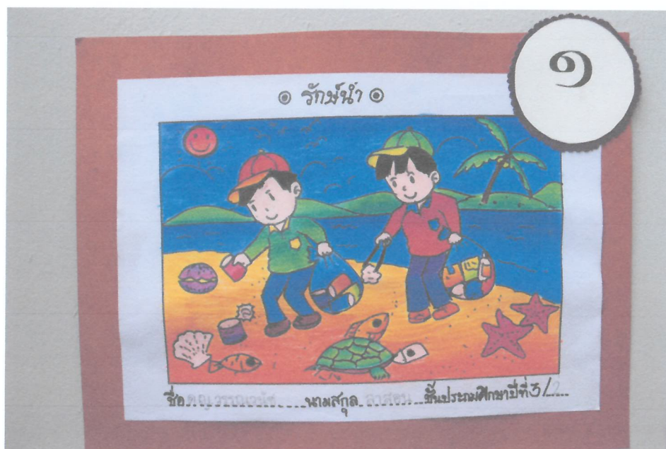
ภาพถ่ายจากงานนิทรรศการการประกวดวาดภาพวันดินโลก รางวัลอันดับที่ 1 จากช่วงชั้นต่างๆ