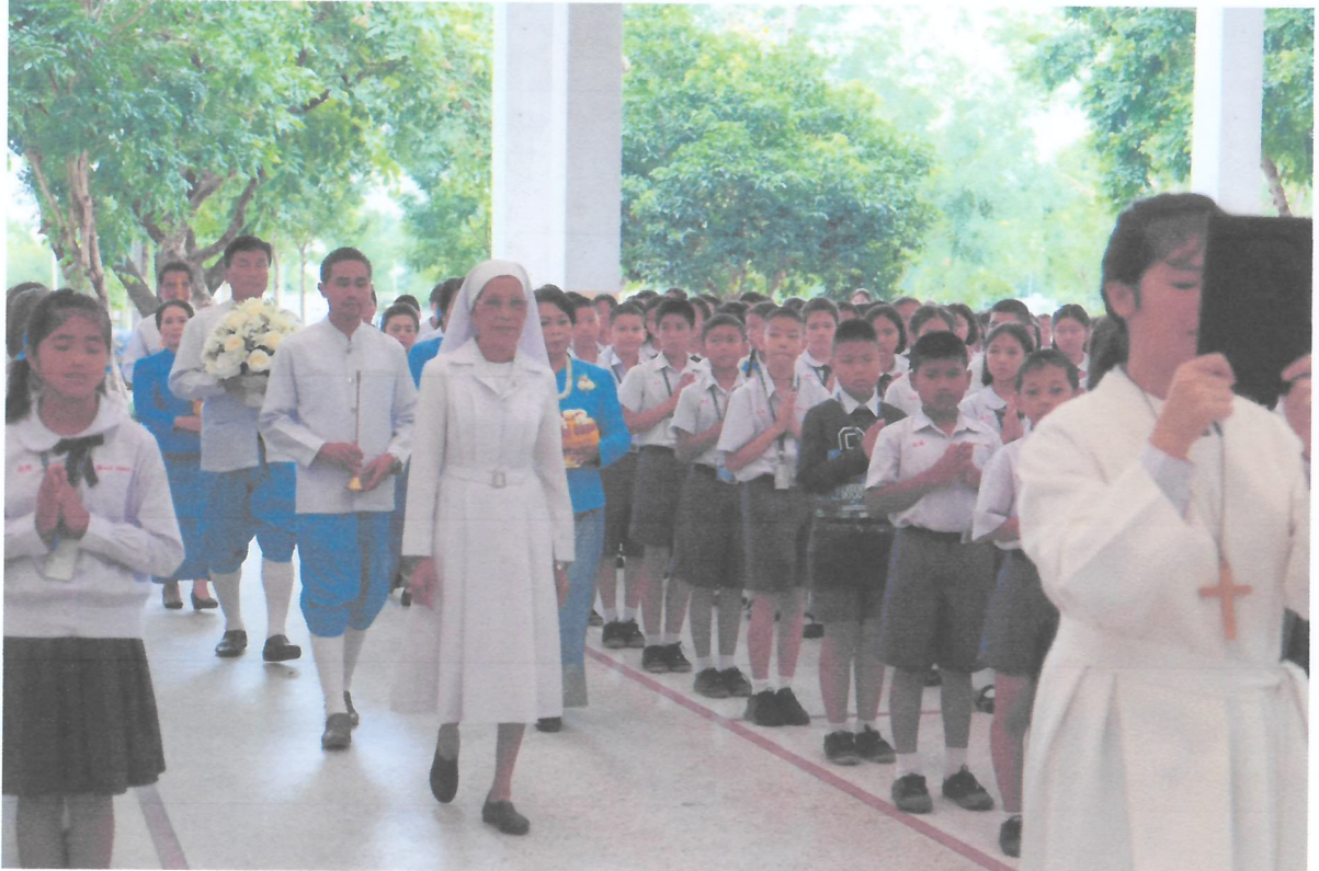
ซิสเตอร์ผู้อำนวยการเป็นประธานในพิธีเปิดกิจกรรมวันแม่แห่งชาติ