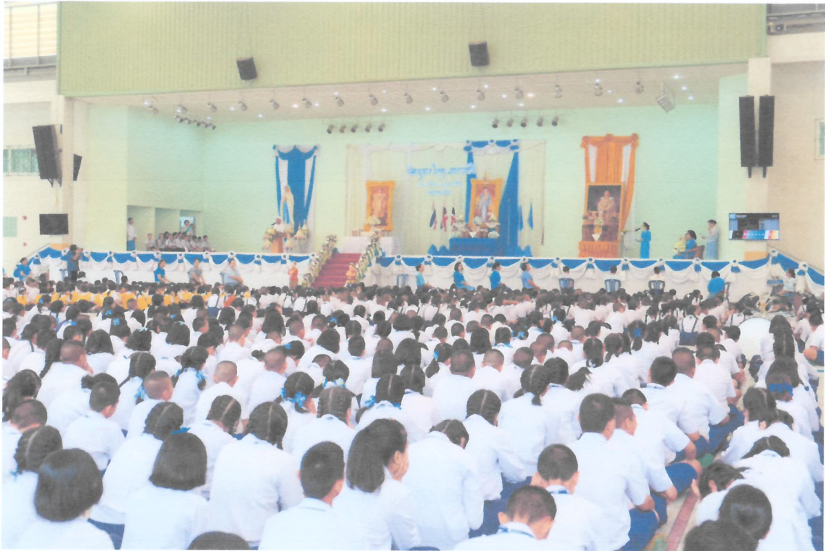
คณะครูและนักเรียนเข้าร่วมกิจกรรมวันแม่แห่งชาติด้วยความพร้อมเพรียงกัน