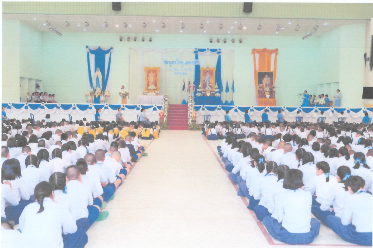
คณะครูและนักเรียนเข้าร่วมกิจกรรมวันแม่แห่งชาติด้วยความพร้อมเพรียงกัน