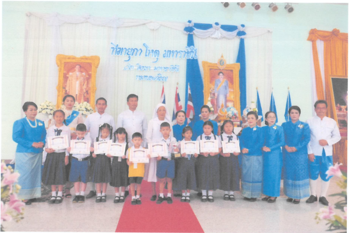
คณะครูและผู้บริหารร่วมถ่ายรูปกับนักเรียนที่ได้รับรางวัล