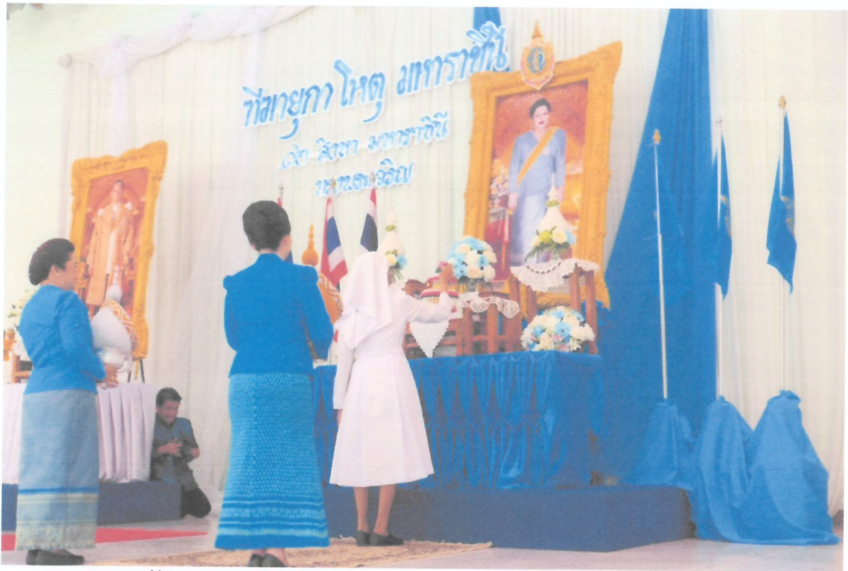
ซิสเตอร์ผู้อำนวยการเปิดกรวยสักการะต่อหน้าพระบรมฉายาลักษณ์สมเด็จพระนางเจ้า พระบรมราชินีนาถในรัชกาลที่ 9