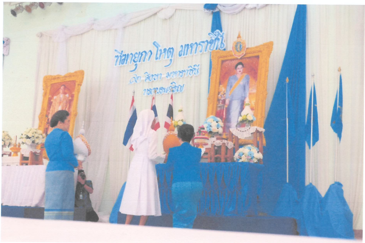
ซิสเตอร์ผู้อำนวยการถวายพานพุ่มเงิน และพานพุ่มทองต่อหน้าพระบรมฉายาลักษณ์สมเด็จพระนางเจ้า พระบรมราชินีนาถในรัชกาลที่ 9