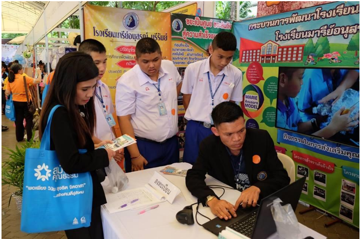
นักเรียนและครูร่วมกันนำเสนอกระบวนการพัฒนาโรงเรียนคุณธรรม