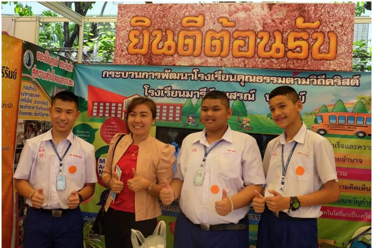
นักเรียนและครูร่วมกันนำเสนอกระบวนการพัฒนาโรงเรียนคุณธรรม