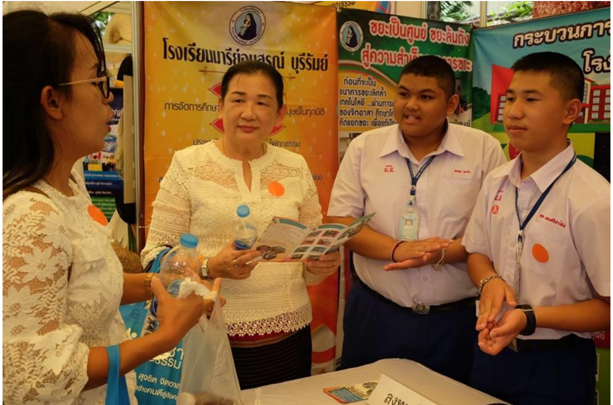
นักเรียนและครูร่วมกันนำเสนอกระบวนการพัฒนาโรงเรียนคุณธรรม