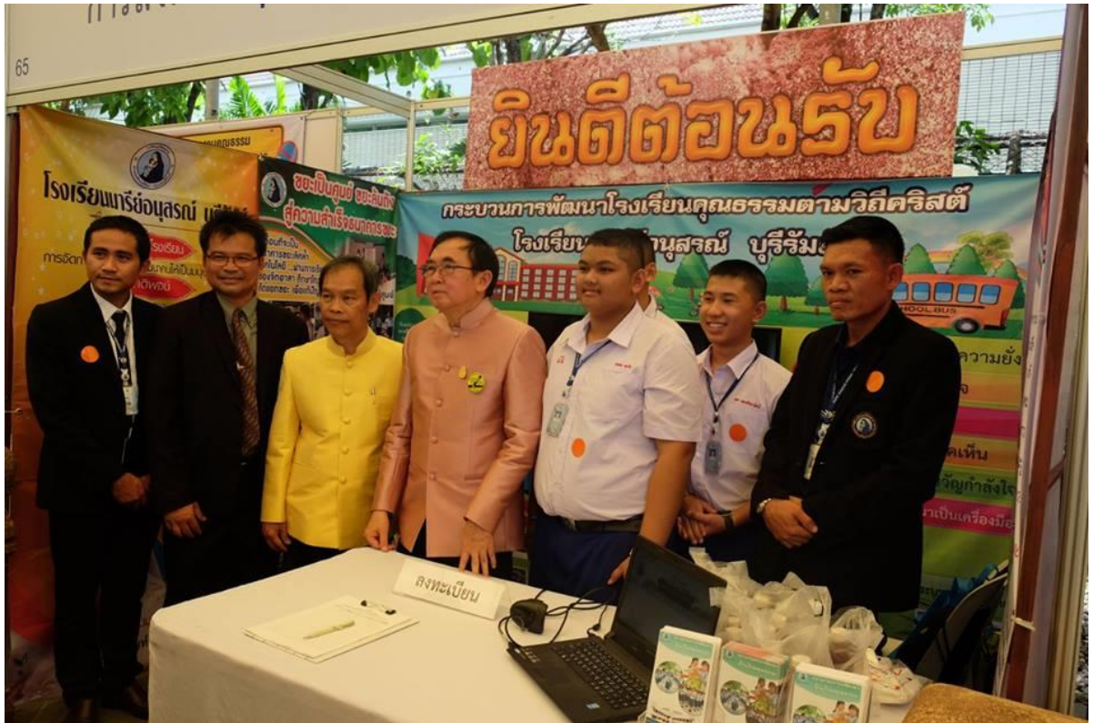
รัฐมนตรีกระทรวงวัฒนธรรม...เยี่ยมชมนิทรรศการโรงเรียนมารีย์อนุสรณ์