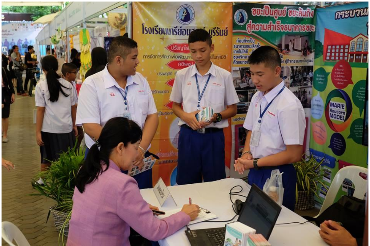
นักเรียนและครูร่วมกันนำเสนอกระบวนการพัฒนาโรงเรียนคุณธรรม