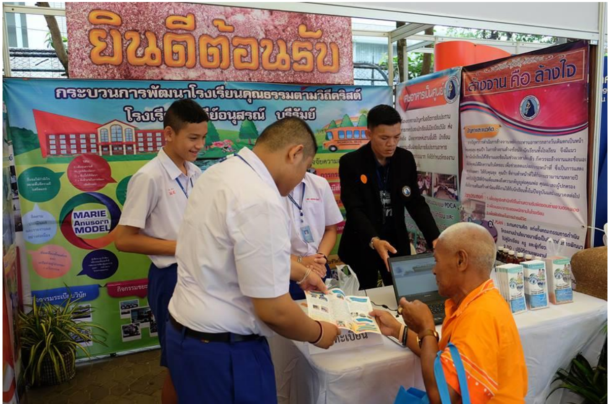
นักเรียนและครูร่วมกันนำเสนอกระบวนการพัฒนาโรงเรียนคุณธรรม