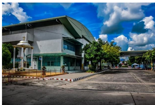
ที่ตั้งและแผนที่เดินทาง