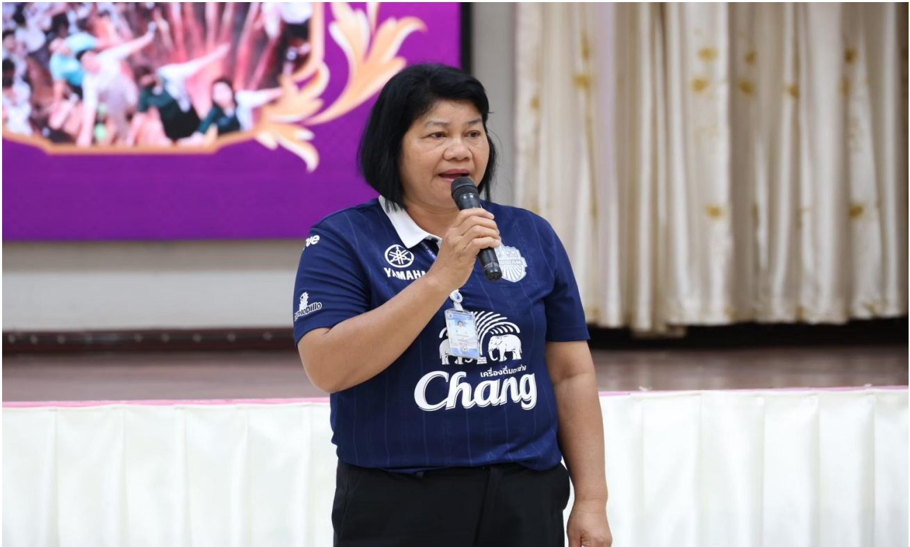
กิจกรรมทัศนศึกษาปีการศึกษา 2568