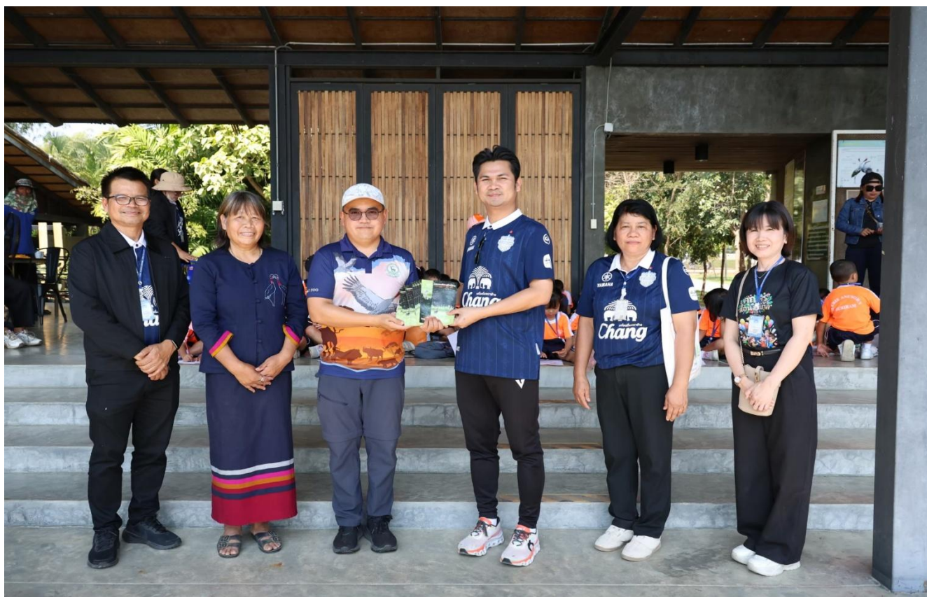
กิจกรรมทัศนศึกษาปีการศึกษา 2568