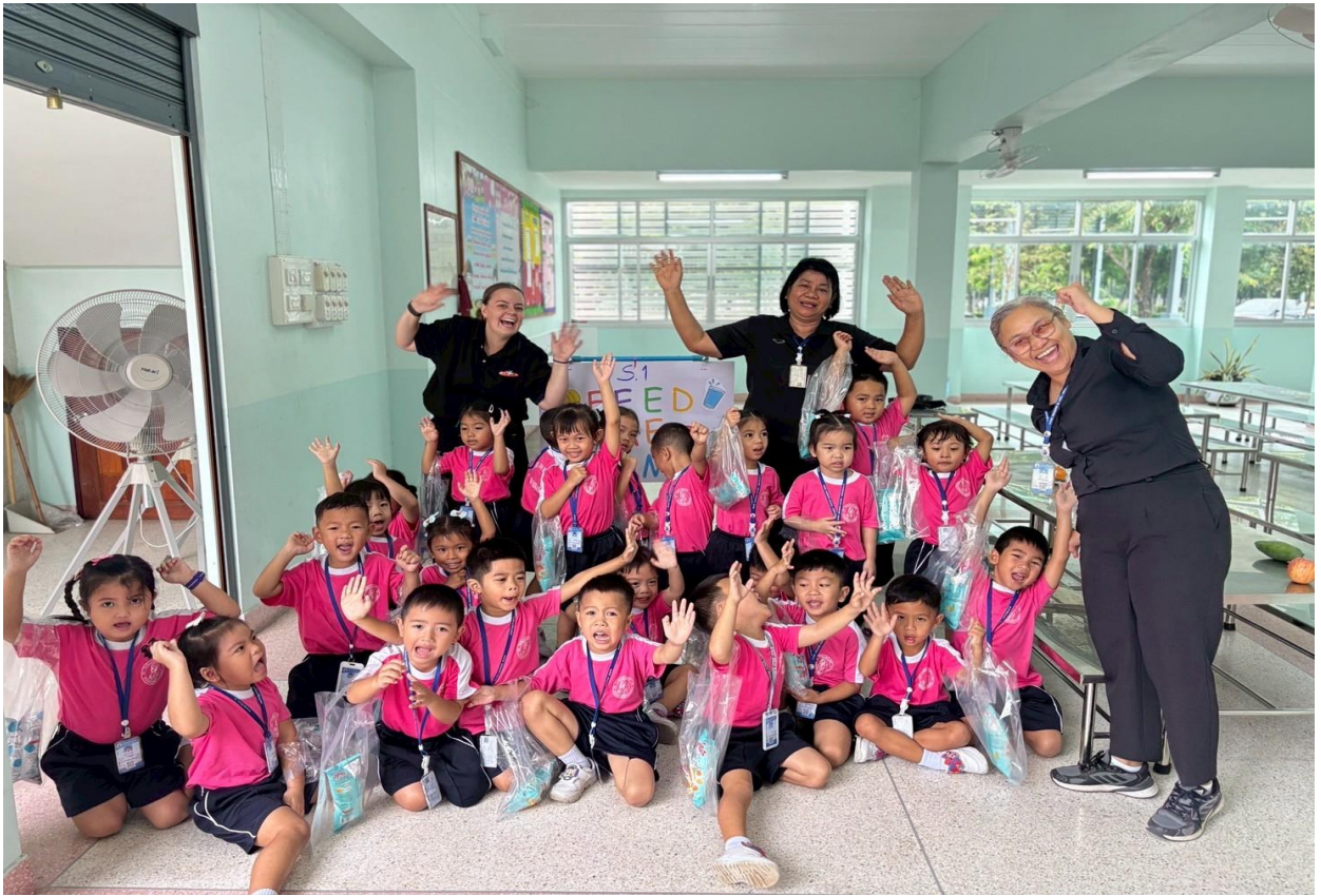
กิจกรรมเข้าค่ายภาษาอังกฤษ