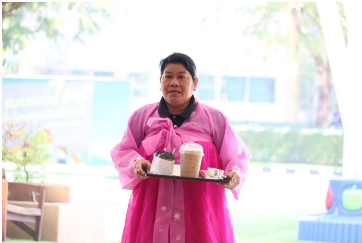
กิจกรรมวันเด็ก