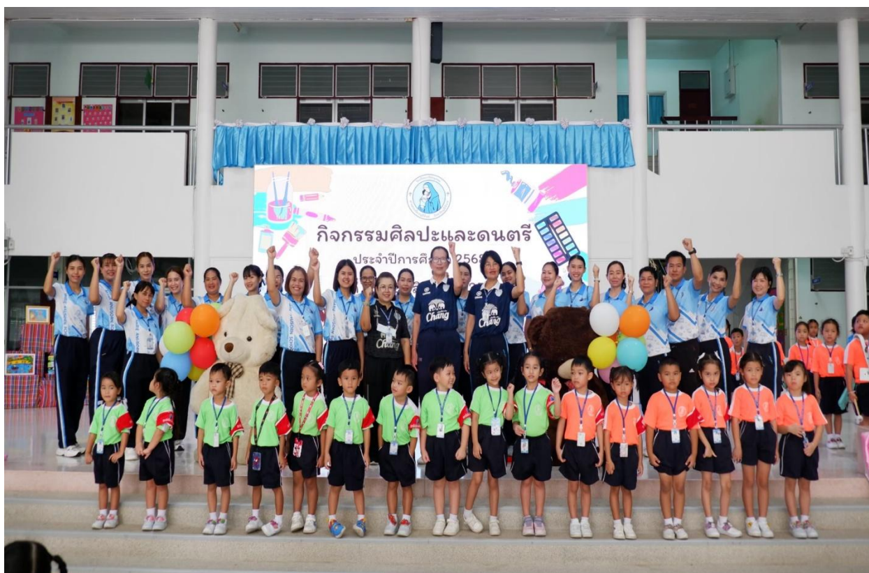
กิจกรรมเข้าค่ายศิลปะและดนตรี