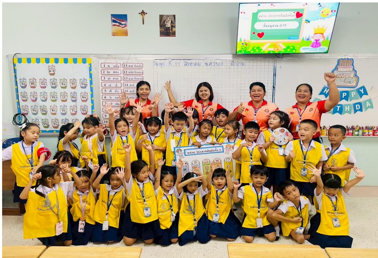
กิจกรรมเข้านิเทศการสอนของคณะครูระดับปฐมวัย