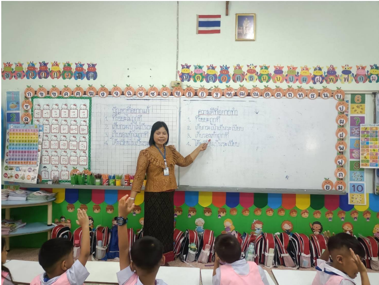
การสอนแบบ Project Approach เรื่อง มะนาว