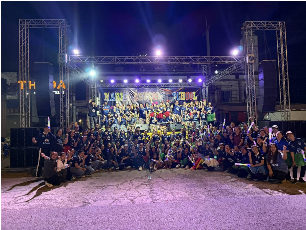
ร่วมกิจกรรมการแข่งขันวิ่งบุรีรัมย์มาราธอน2026