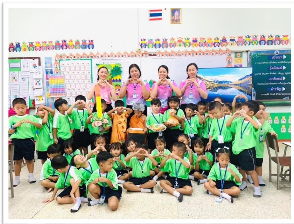
นิเทศการสอน หน่วยวันเข้าพรรษา