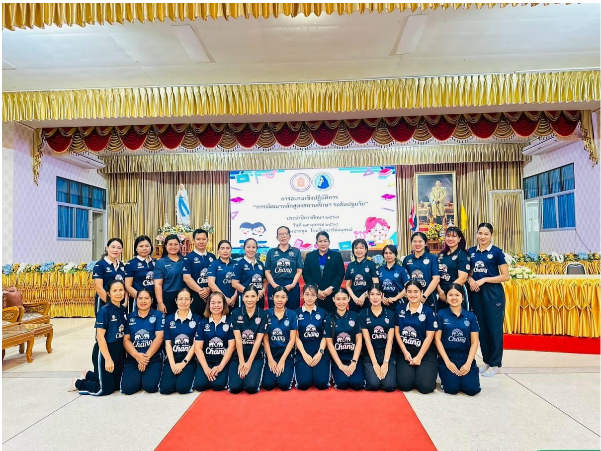
อบรมการพัฒนาหลักสูตรสถานศึกษา ระดับปฐมวัย