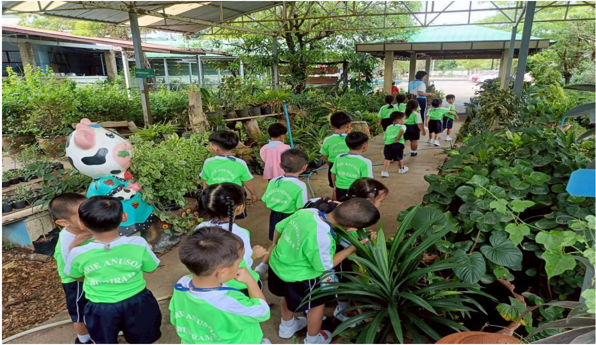
พาเด็กๆเดินสำรวจปลาของจริงในสวนเกษตรของโรงเรียน