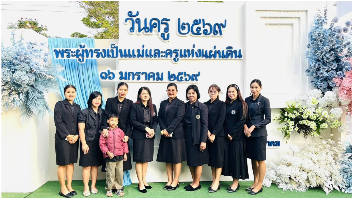
ร่วมกิจกรรมวันครู