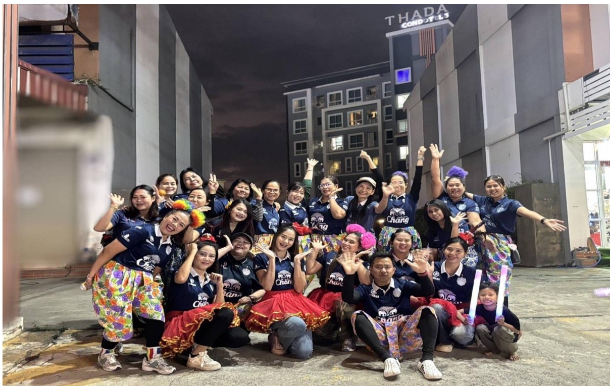
ร่วมกิจกรรมการแข่งขันวิ่งบุรีรัมย์มาราธอน2026