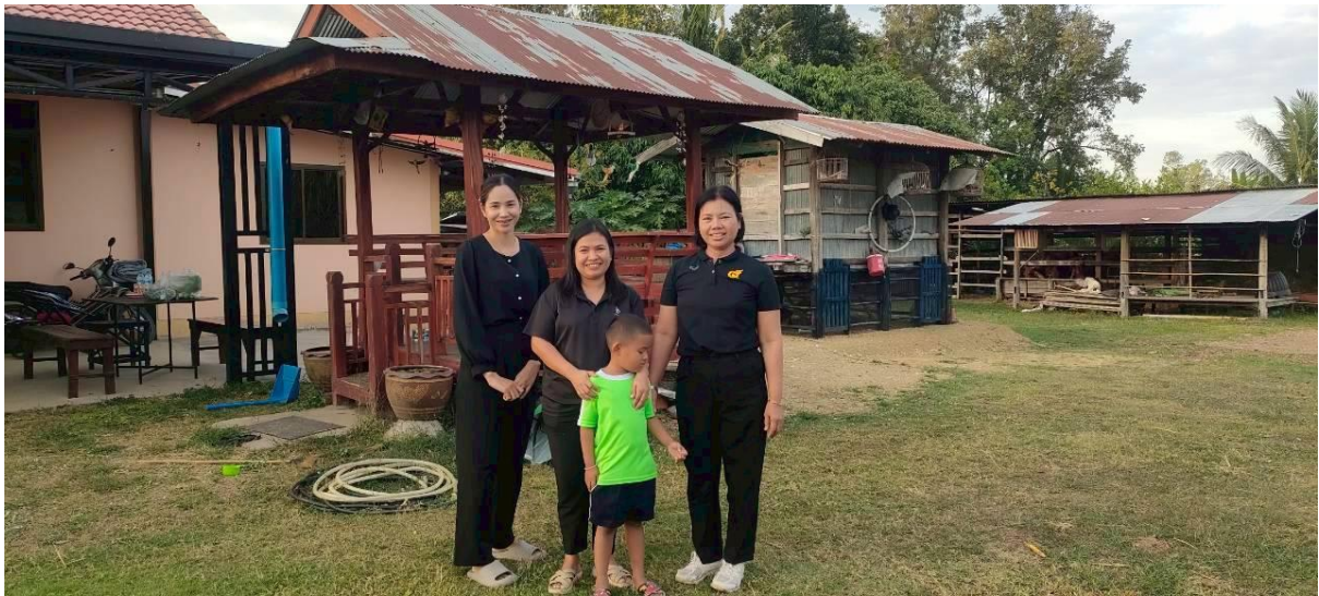
เยี่ยมบ้านนักเรียน