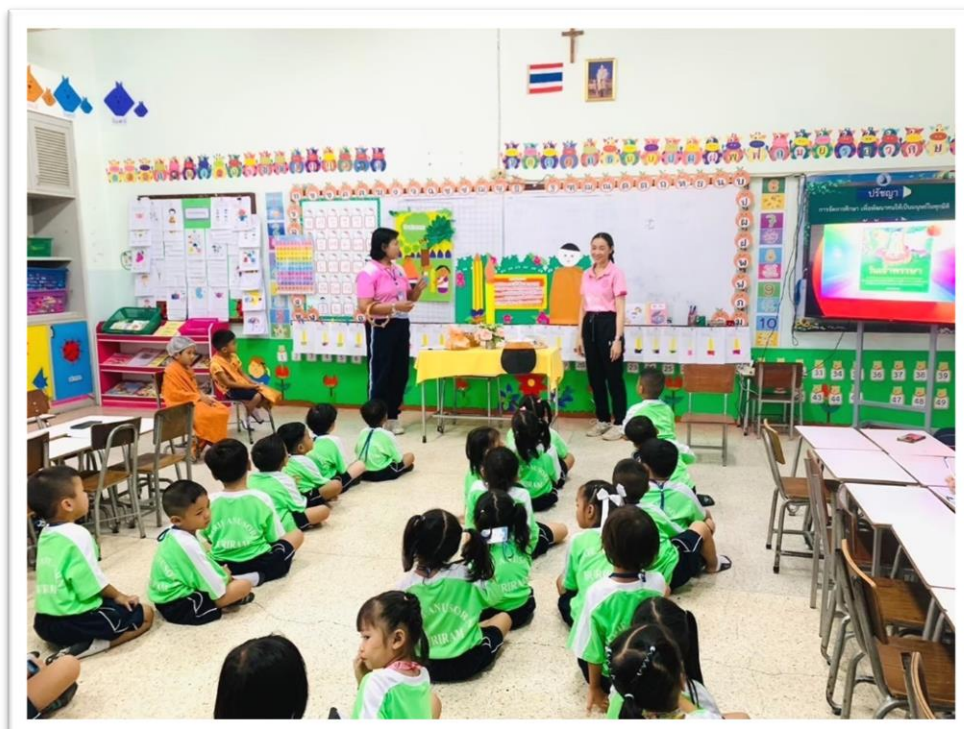
กิจกรรมเสริม