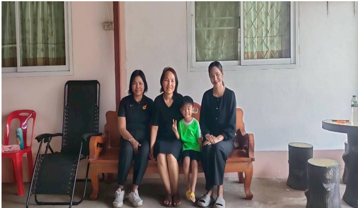
เยี่ยมบ้านนักเรียน