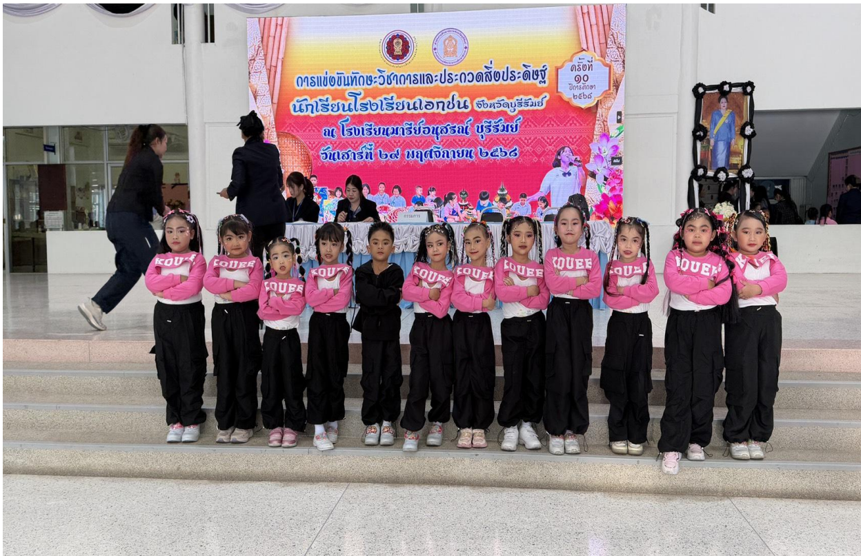
ครูผู้ฝึกซ้อมการแข่งขันทักษะระดับปฐมวัย