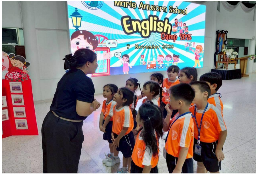
กิจกรรม English camp ปี 68