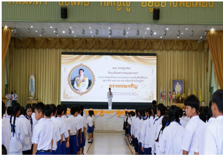
กิจกรรมวันเฉลิมพระชนมพรรษาพระบาทสมเด็จพระวชิรเกล้าเจ้าอยู่หัว ร.10 ปี68