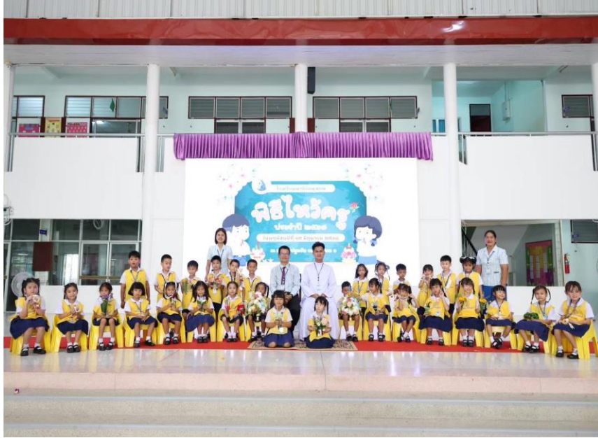
กิจกรรมไหว้ครูปีการศึกษา 2568