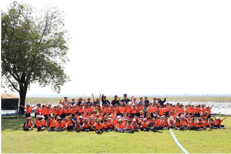
เด็กๆ ทัศนศึกษาที่ศูนย์การเรียนรู้นกกกระเรียนกับคุณครูและเพื่อนๆ