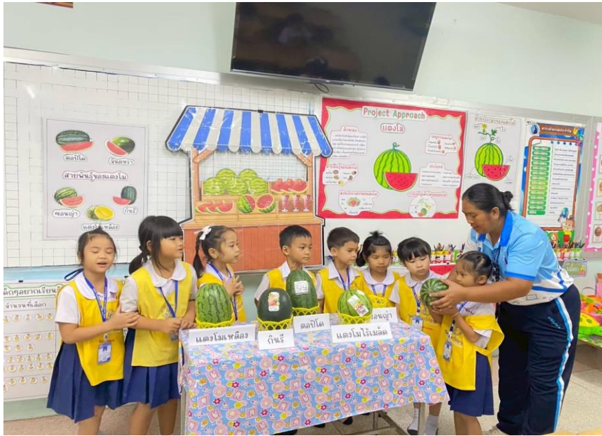
เด็กๆ เรียนรู้เรื่อง Project Approach เรื่อง แตงโม