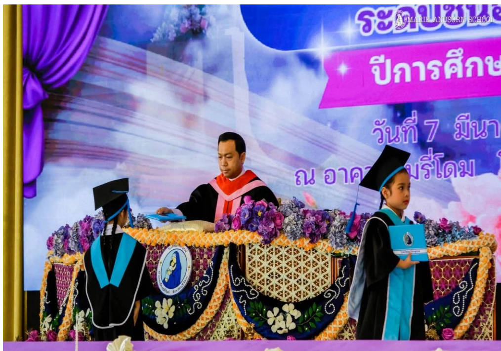
ร่วมกิจกรรมยวบัณฑิต ปีการศึกษา 2568