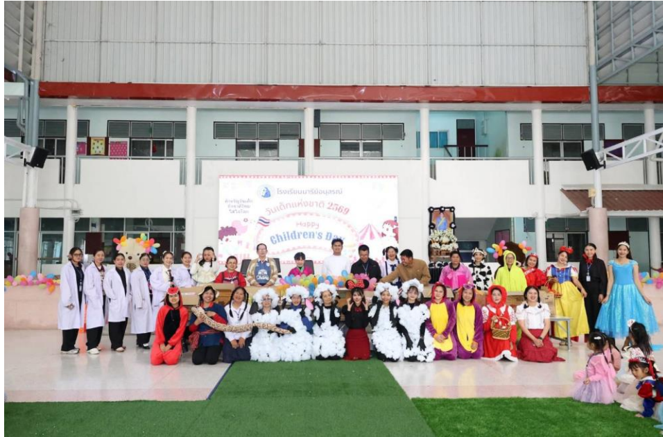
กิจกรรมวันเด็ก ปี68